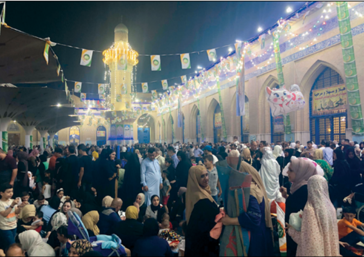
من أجواء الاحتفال بالمولد النبوي الشريف في مرقد الشيخ عبد القادر الكيلاني...