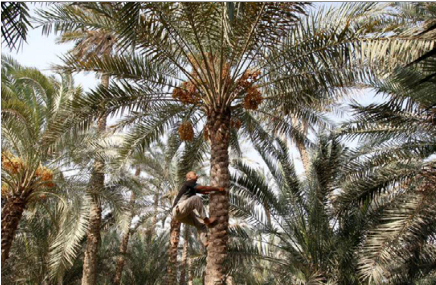
تحديات كبيرة تواجه زراعة النخيل في العراق

تحجب ضوء الشمس وتؤثر على الثمرة وتجعلها اقل وزناً واقل قيمة غذائية."