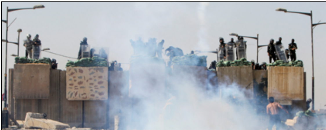
متظاهرين يقتر من حاجز للقوات الأمنية خلال احياء الذكرى الثالثة للانتفاضة تشرين في بغداد

وأكد التقرير، أن "الخلافات السياسية لا تزال متواصلة بين المعسكرين الشيعيين البارزين، التيار الصدري من جهة والإطاري التنسيقي، الذي يضم كتلا تمثل الحشد الشعبي، وهو تحالف فصائل مسلحة موالية لإيران باتت منضوية في أجهزة الدولة، من جهة ثانية".