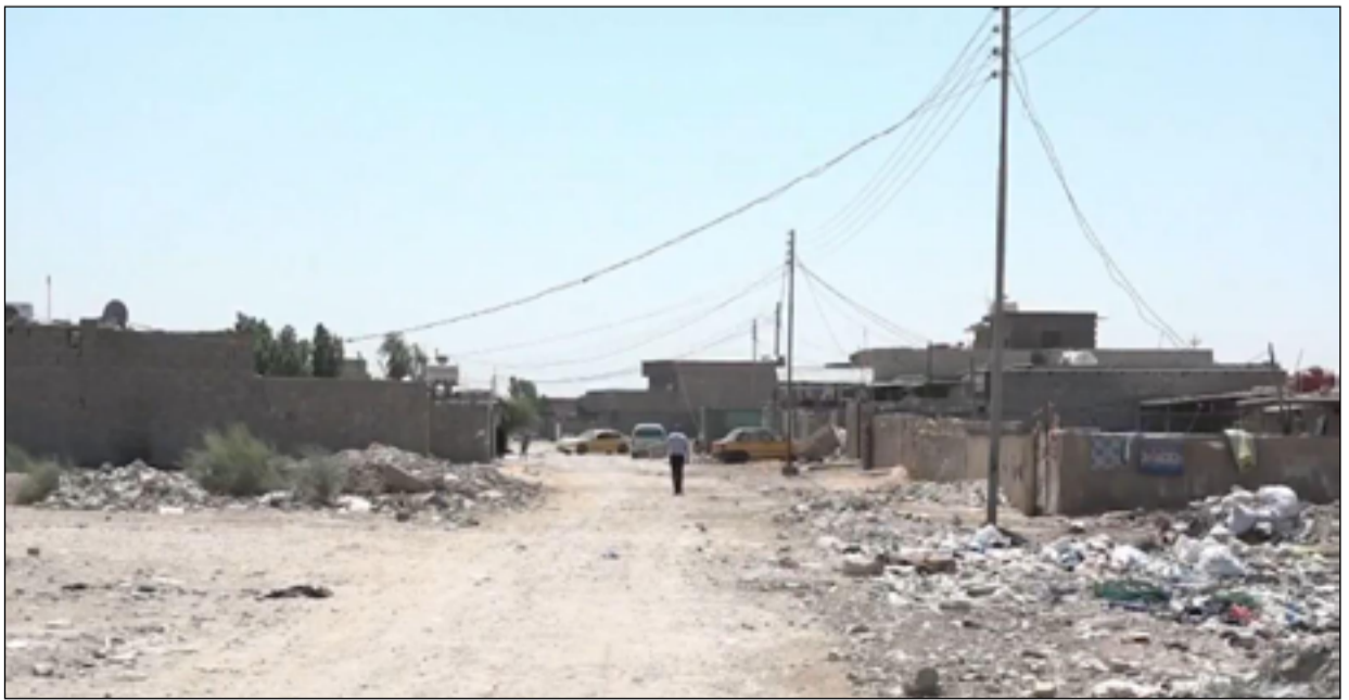
جهود نيابية جديدة لمعالجة أزمة العشوائيات

والمشروع الذي يهدف الى معالجة أزمة السكن في العراق، كما قال: "انا قلق بمشكلة السكن العشوائي في العراق، وفي عملية مكلفة وغير مستدامة." وأشار التقرير، أنه عبد الله قال: "انا قلق بخصوص انتاج السنة القادمة." حيث ان كمية الأسلاك التي امتصتها أشجاره قد "تؤثر سلباً على محصول السنة القادمة" او انه قد لا يكون هناك محصول." وأكد، أن "العراق شهد خلال السنوات الثلاث الماضية معدلات عالية بدرجات الحرارة تجاوزت الـ