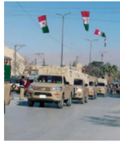
مظاهرات في باكستان

كشف تقرير صادر عن معهد باكستان للدراسات الحربية والأمن عن تزايد بعدد الهجمات الإرهابية خلال شهر أيلول 2022 مقارنة بشهر آب. وأظهر وقوع 42 هجوما مسلحا خلال أيلول (وهو الأعلى شهريا خلال عام 2022) بزيادة عن شهر آب بنسبة 35%. وشوهدت أيضا زيادة ملحوظة بعددات العنف في منطقتي فاتا وخيبر باختونخوا بنسبة 106%.