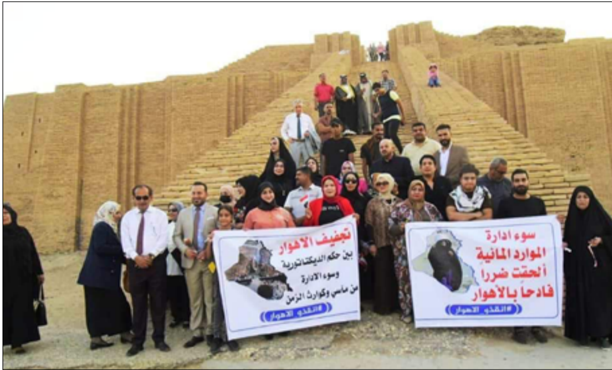
حملات لانقاذ الاموار من الجفاف يطلقها نشطاء مدنيون في ذي قار

وأشار، إلى أن "الجمعية تبنت جملة من الفعاليات الميدانية في هذا المجال من بينها تقديم مساعدات غذائية وملابس وحفايا مدرسية إلى عدد من العوائل والطلاب في أهوار الجبايش"، داعياً إلى "تحرك حكومي حقيقي وفعال لإنقاذ سكان الأهوار". وبالتزامن مع الذكرى السنوية السادسة لانضمام الأهوار إلى لائحة التراث العالمي دعا مسؤولون ومنظمات بيئية في ذي قار يوم منتصف شهر تموز الماضي الحكوميين المحلي والمركزية إلى إعلان الأهوار منقطة منسوبة، وأكدوا جفاف معظم مناطقها ونفوق الأسماك والكائنات الحية ونزوح سكان القرى ومربي الجاموس، وطالبوا باستحداث هيئة عليا لإدارة الملف ترتبط بمجلس الوزراء.