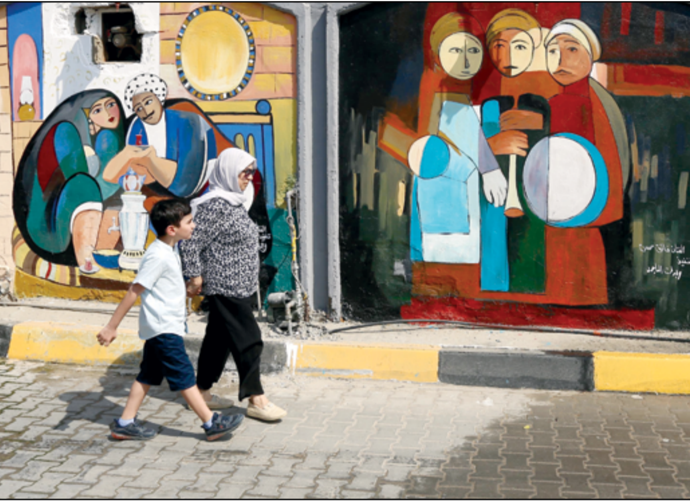
رسومات تزين أزقة بغداد القديمة.