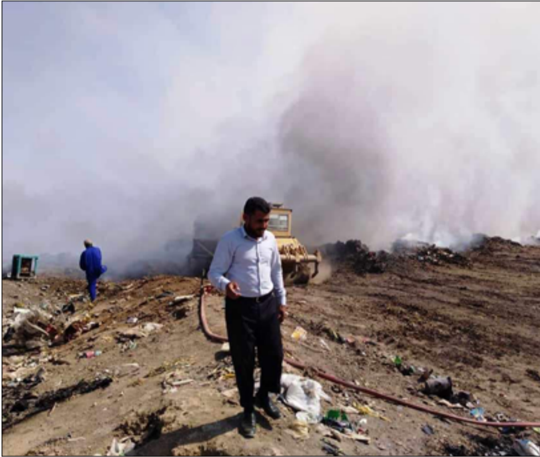
مواقع الطمر الصحي تزيد من معاناة المواطنين

الصحي وانتشار الدخان الكثيف الذي بات يغطي مناطقهم ويشكل تهديداً لحياتهم.