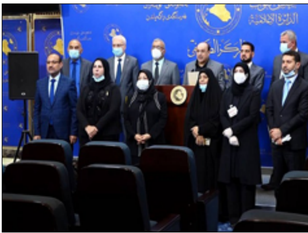
نواب ائتلاف دولة القانون من أكثر المتحمسين لتشكيل حكومة برئاسة السوداني

المزيد من الوقت". وتابع النوري، أن "المؤشرات تفيد بوجود انفراج في الانسداد السياسي بعودة جلسات البرلمان واختيار النائب الأول لرئيس المجلس ومن ثم المضي بالعملية التشريعية والرقابية". ولفت، إلى أن "عملية انتخاب رئيس الجمهورية ستكون خلال الشهر الحالي، كي يتم بعد ذلك تكليف مرشح الإطار التأسيسي محمد شياع السوداني بتشكيل الحكومة". وأوضح النوري، أن "العدد الحالي للمقاعد يعطي الحق للإطراف التأسيسية لتقديم مرشحة لمنصب رئيس الوزراء، مع وجود حرص لدى الكافة بأن يعود النشاط إلى الدولة بتشريع القوانين وغيرها من الإجراءات التي تصب في مصلحة الشارع العراقي. وبين، أن "الحكومة الحالية غير متكاملة معطلة لعدم قدرة السلطة التنفيذية على المضي بمشاريع استثمارية وغيرها كونها تمارس عملها بموجب تصريف المهام اليومية". وانتهى النوري، إلى أن "الواجب الوطني والسياسي يفرض على الكتل السياسية أن تساعد في