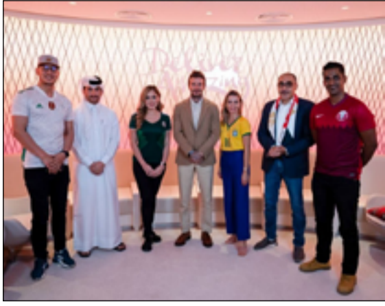
□ الدوحة / خاص بالمدى

التقى نجم الكرة الإنكليزية السابق، وسفير كأس العالم FIFA قطر ٢٠٢٢™ ديفيد بيكهام، مجموعة من أعضاء شبكة قطر لقادة المشجعين، التي أطلقتها اللجنة العليا للمشاريع والإرث القطرية العام الماضي، حيث استعرضوا أمام قائد منتخب إنكلترا السابق دورهم في تعزيز الحماسة لدى الجمهور حول المونديال المرتقب، وضمان خوض جمهور البطولة تجربة استثنائية خلال منافسات النسخة الأولى من كأس العالم في المنطقة.