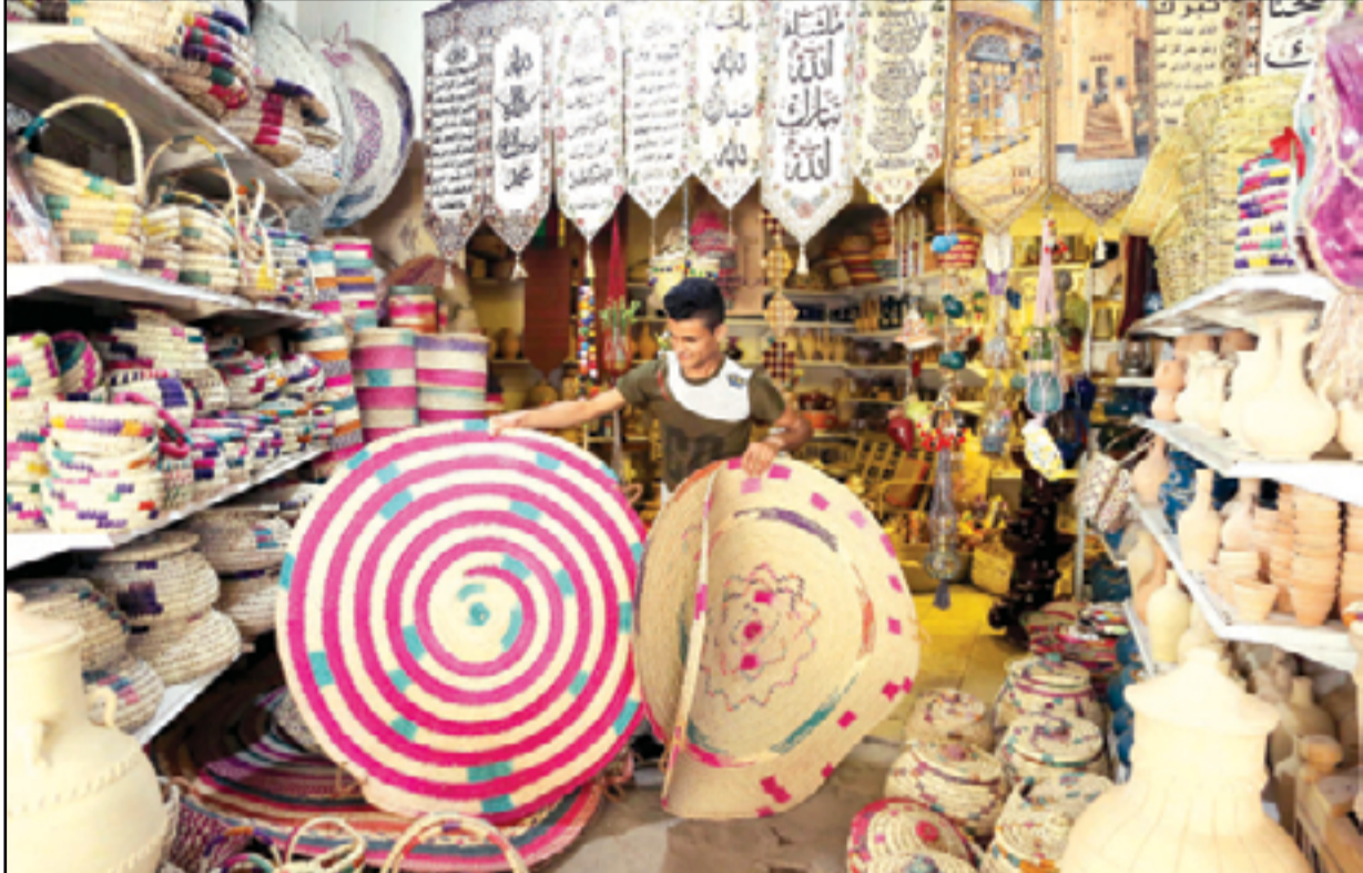
محال لبيع المشغولات اليدوية التراثية وسط بغداد...