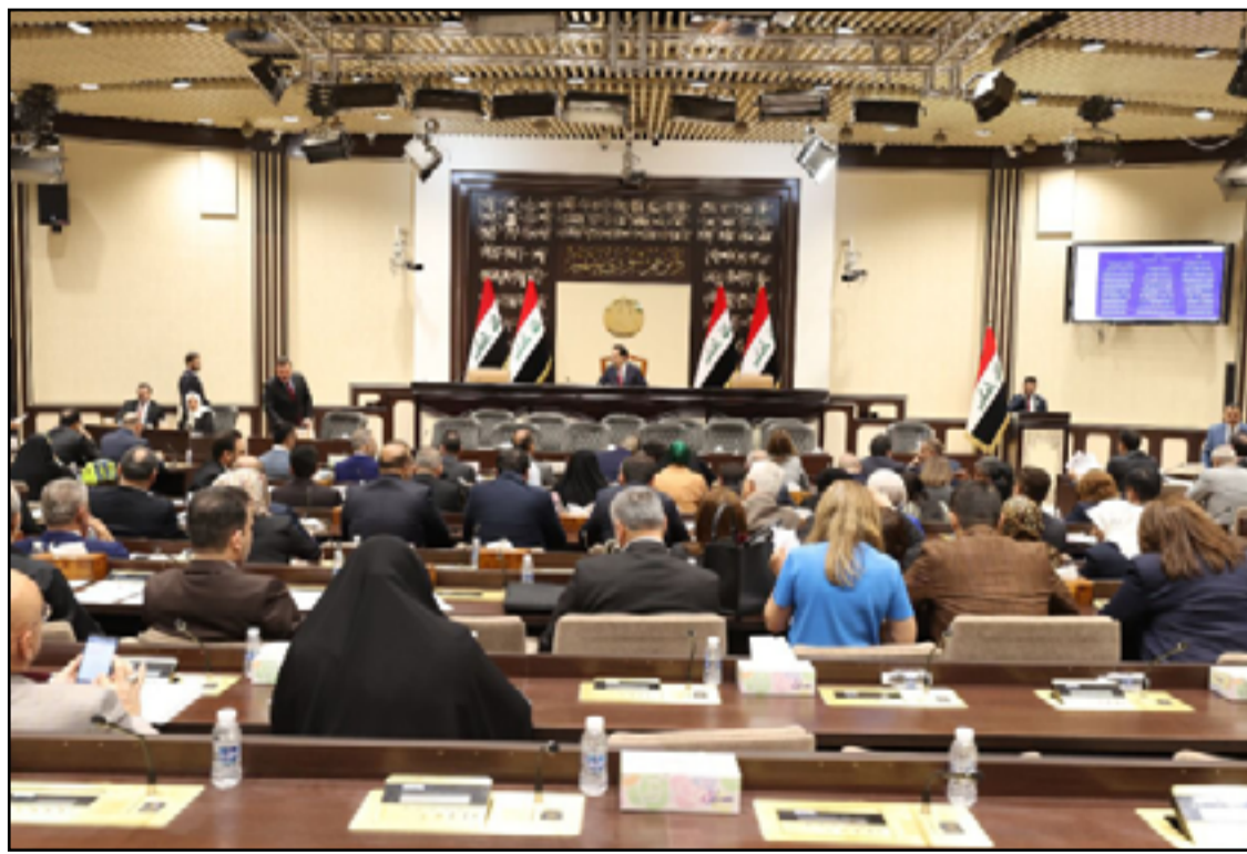
جانب من جلسة البرلمان ليوم أمس

فيما أحيى محتجو (تشرين) الذكرى الثالثة للانتفاضة في (1 تشرين الأول 2022) بتجديد مطالبهم، لتنتهي المظاهرات سريعاً مسجلة إصابة نحو 50 شخصاً من المحتجين، وسط تأكيدات بالعودة مجدداً إلى ساحات الاعتصام في الـ 25 من تشرين الأول. وهنا دخل مجلس الأمن الدولي على خط الأزمة العراقية بعقد جلسة طارئة بشأن الأحداث الأخيرة في (4 أكتوبر/ تشرين الأول 2022)، قدمت خلالها المبعوثة الأممية جينين بلاسخرات إحاطة، أكدت فيها أن «الخلافات تسود على لغة الحوار على مختلف الأصعدة، وأن العراق يشهد مناوشات مسلحة