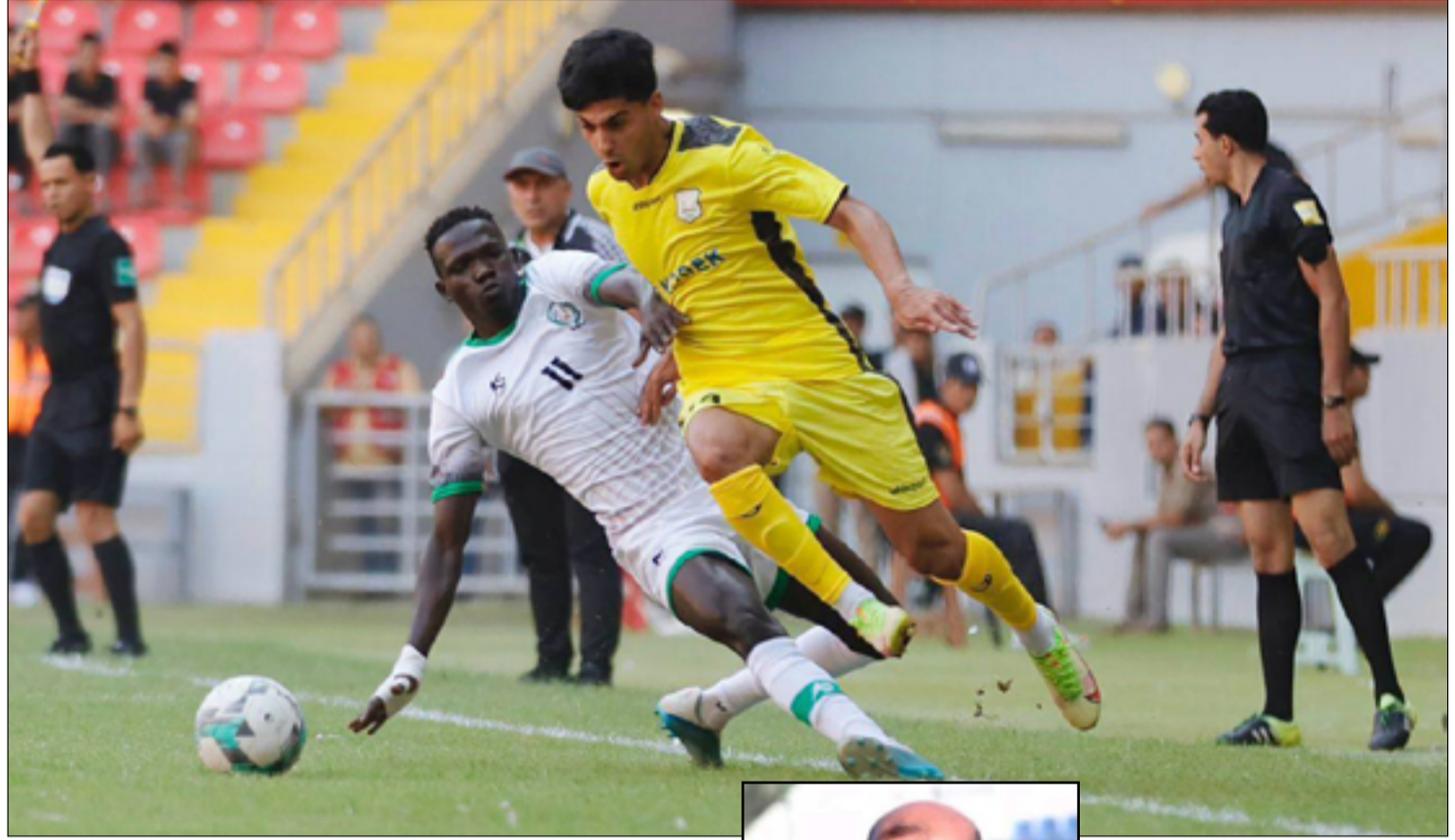
بغداد / المدى

انطلقت الأحد الماضي، منافسات الجولة الأولى لدوري كرة القدم الممتاز للموسم الجديد ٢٠٢٣-٢٠٢٢ في ملاعب بغداد والمحافظات، وسط ترقب لمباريات قوية وترقي بالكرة العراقية نحو الأفضل تمهيدا لتدشين مسابقة دوري المحترفين ٢٠٢٣-٢٠٢٤. وتعرض (المدى) أبرز أحداث الجولة من نتائج ومواقف.