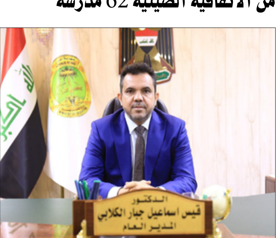
مدير تربية الكرخ الثانية