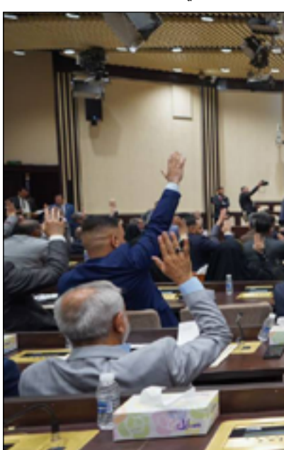
اعضاء البرلمان اثناء التصويت على إنهاء تكليف عبد الجبار بمهام وزارة المالية

"عملية تكليف وزير النفط بمهام وزير المالية ابتداءً صحيحة، لأننا في ظل حكومة تصريف مهام يومية، فلا يمكن أن نضيف أي وزير جديد بدلا عن المستقبل علي عبد الأمير علاوي".