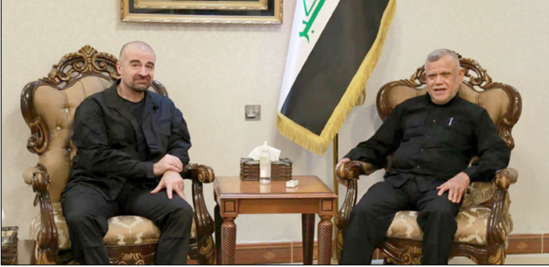
العامري يستقبل طالباني أمس ويبحث معه الأزمة السياسية

ويتوقع بروراي أن "يعاد سيناريو 2018 بوجود مرشحين اثنين للرئاسة داخل البرلمان"، فيما نفى علمه بما تسرب عن احتمال مقاطعة الحزب الديمقراطي رئيسه إذا لم يتم الاتفاق على مرشحه.