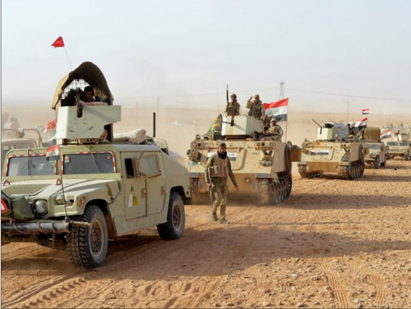
قوة تابعة للجيش العراقي تلاحق أوكار داعش في الصحراء

مواطنيها، فان مشاكل داخلية وأزمات تحد من قدراتها".