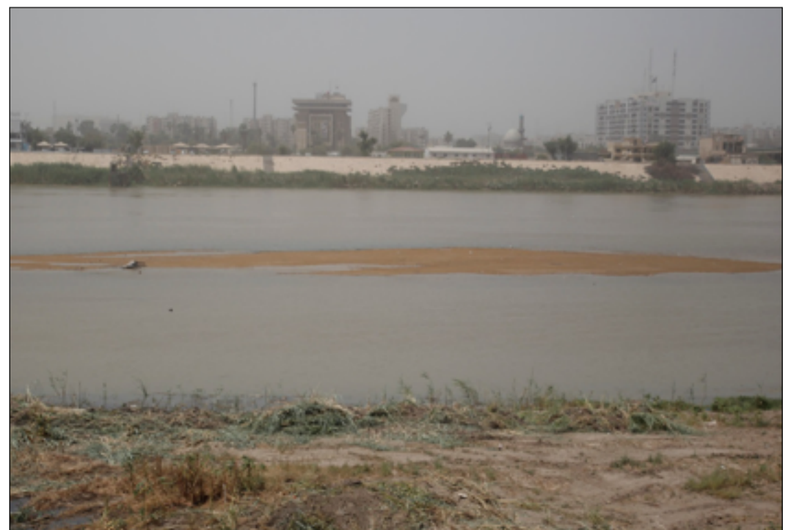
العراق ينظر موسماً شتوياً ممطراً لإنقاذه من الجفاف