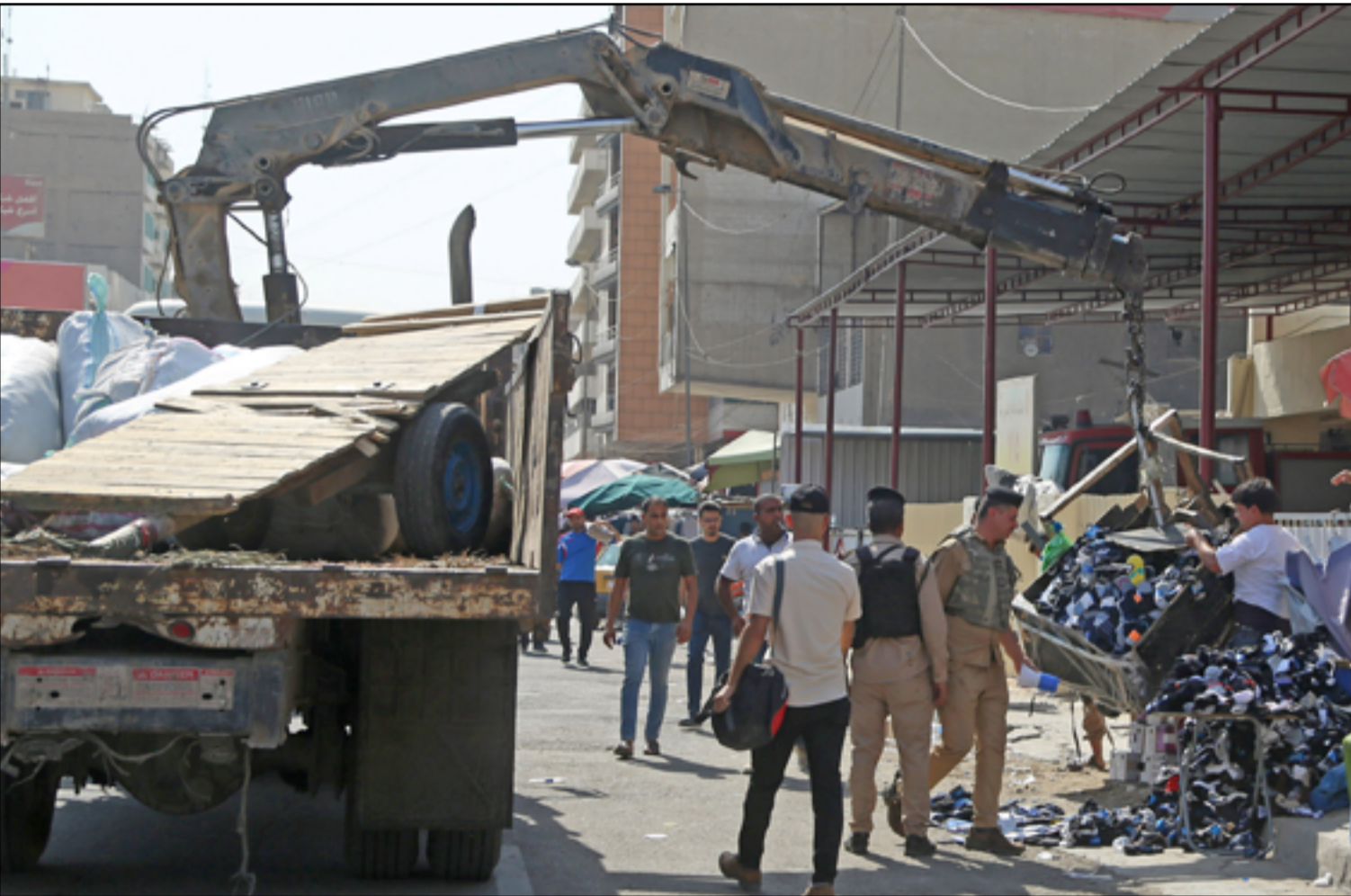
حملة لازالة التجاوزات قرب سوق الشورجة..