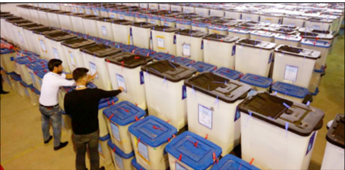
تراجع مستمر في أعداد المشاركين في الانتخابات

المكونات الطائفية والقومية إلى صراع آخر معقد هو داخل الكون الواحد من أجل السيطرة على السلطة".