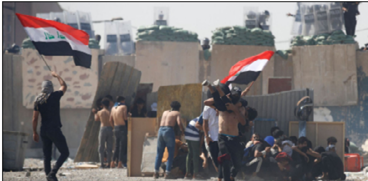
مخاوف من عودة الصدامات خلال التظاهرات المرتقبة نهاية الشهر الحالي

وأضاف الأسعد، أن «مطالب المحتجين منذ العام 2019 لم تتغير، ومن بينها محاسبة قسلة المتظاهرين والذين كانوا وراء أحداث سفك الدماء والأشخاص الفاسدين الذين الخصومات ادت إلى مواجهات عنيفة