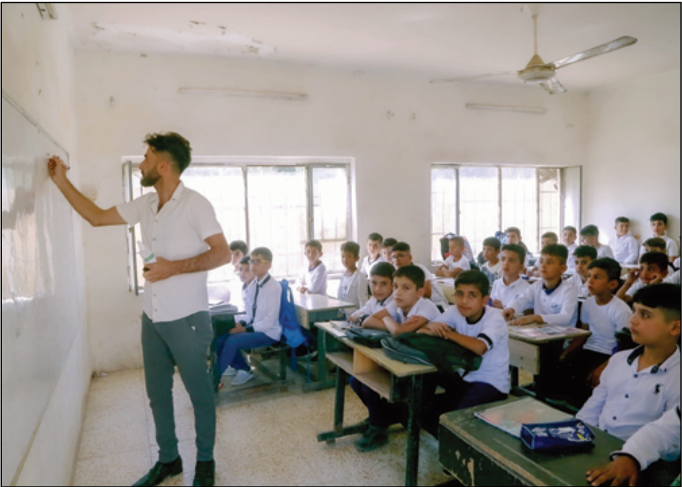
بده العام الدراسي الجديد في مدارس البلاد..