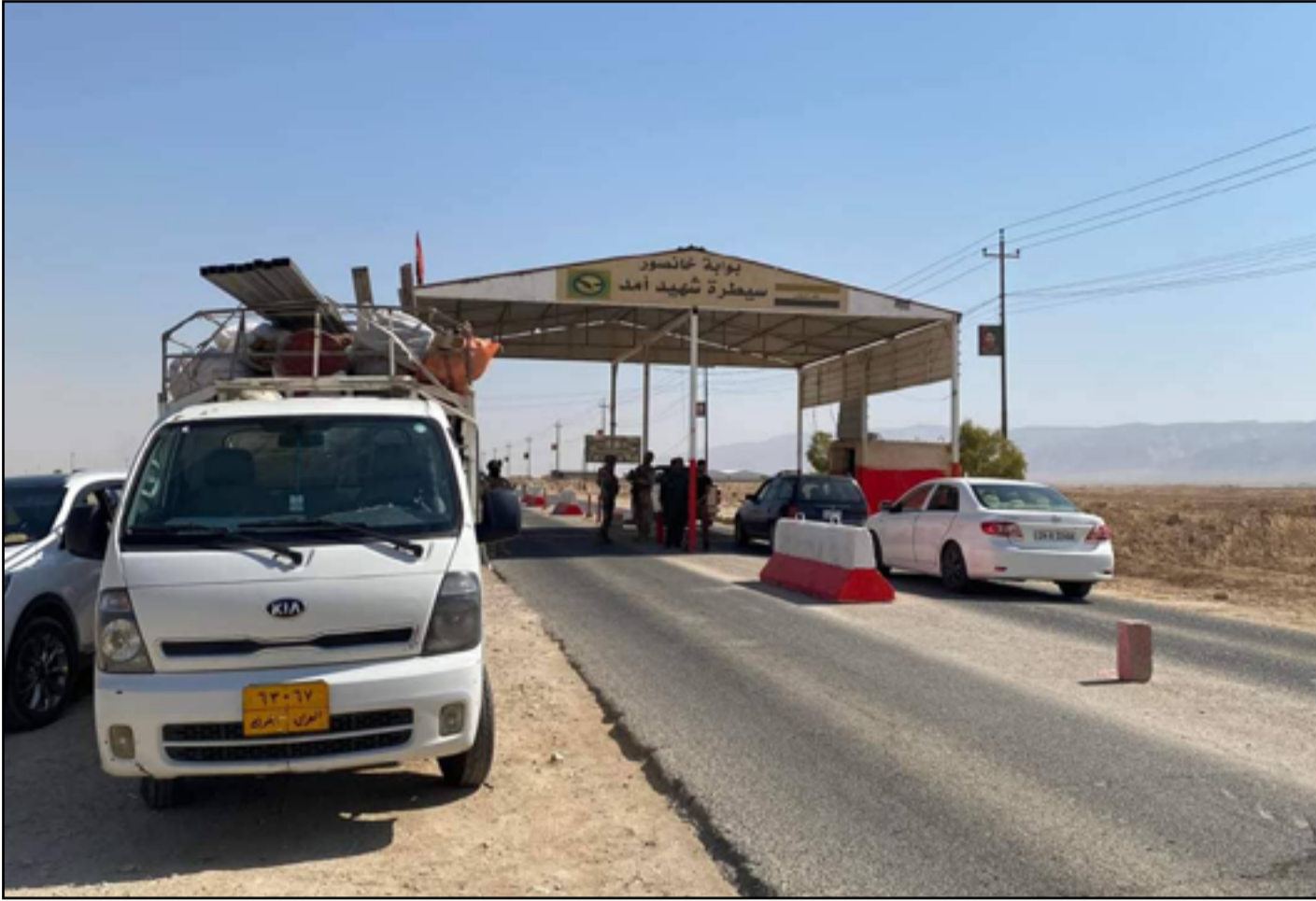
مفرزة للجيش العراقي عند مدخل قضاء سنجار