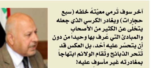
الأمين العام الأسبق لاتحاد كرة القدم

آخر سوف ترمي معيته خلفه (سبع حجرات) ويغادر الكرسي الذي جعله يتخلى عن الكثير من الأصحاب والمبادئ التي عُرف بها وحيداً من دون أن يتحسّر عليه أحد، بل العكس قد تُحسّر الذبائح وتقام الولائم ابتهاجاً بمغادرته غير مأسوف عليه!