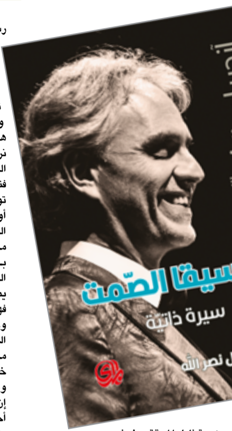
ترجمة: دلال نصر الله سيرة ذاتية

قارئ منكود الحظ قاده حظه لقراءة هذه الخريشات الثقافية وترك الكتاب جانباً ونسيانه، بل وجود عيدين تراقبان تسلسل افكاري وأنا اكتب؛ عينا رجل كهل، بهي الطلعة، ذي ابتسامة مورا به لانه محيط بكميديا الحياة، فغدا منفصلاً وعازفاً عنها، وهاربا من اعمال العقل، مما جعله يحكم على بقسوة اشعر تحت نظريه بالحماقة والمخافة والعجز عن فعل اي شي رغم كوني جريئاً وواهما قبل برهة، كطالب يحسب نفسه من سدنة الحقائق المطلقة القائمة على المفاهيم الفلسفة الاربعة التي تعلمها في المرحلة الثانوية. لكني لاحظت مع مرور الزمن حاناً نادراً بل وحتى شيئاً من السخرية على وجه الكهل الطيب. سأل نفسي حينها: لماذا لا يترفق بي كما يترفق بالآخرين؛ لماذا لا يأخذني على محمل الجد؟ ايها القارئ الكريم، لا بد أنك قد خمنت