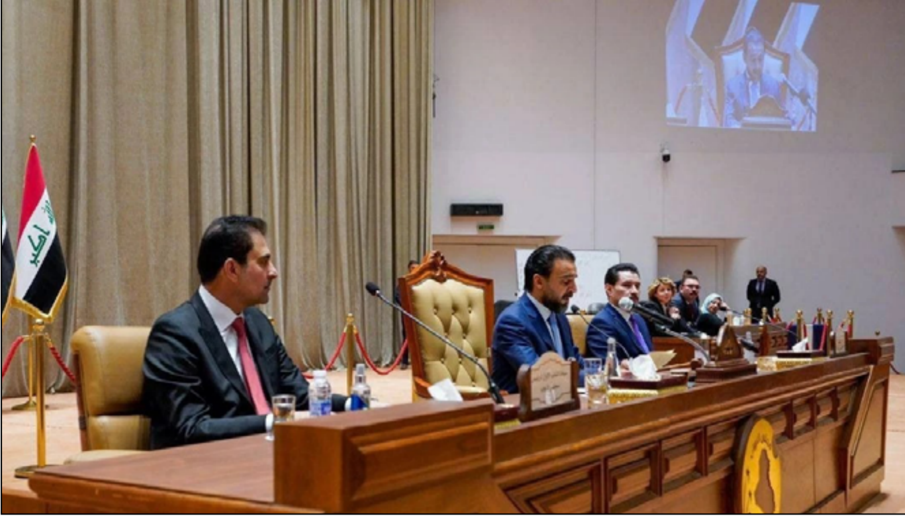
رئاسة مجلس النواب تستعد لاستئناف الجلسات مجدداً

ولزيادة النقاط، يكشف المصدر انه سوف تتم إضافة 3 مناصب تشريعية تحت اسم نواب «رئيس الوزراء الثلاثة»، مبيناً ان أحد النواب سيكون لدولة القانون مقابل 20 مقعداً (المنصب بـ 10 نقاط).