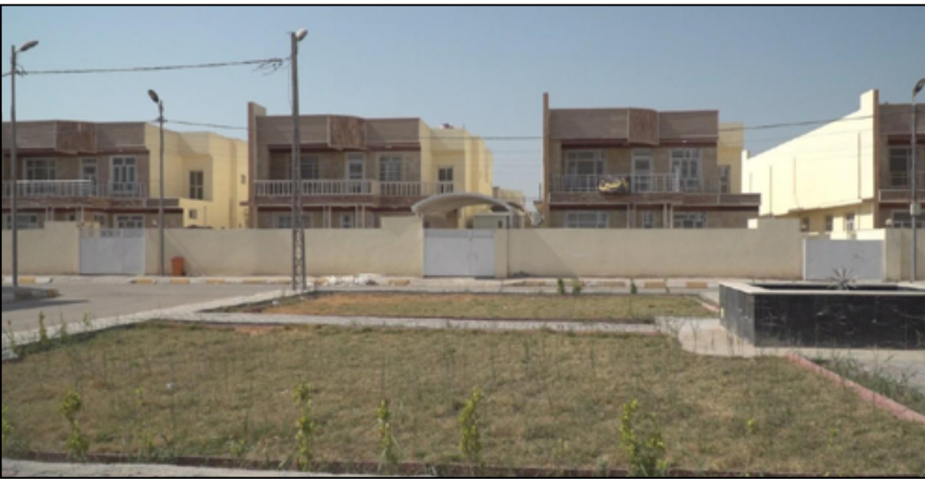
العراقيون يعانون من غلاء المجمعات الاستثمارية

المعدة من قبل مديرية التخطيط بأن تكون هذه الوحدات مدعومة الأسعار في ظل ارتفاع نسبة الفقر في المحافظة. وأضاف أن «الحاجة بتزايد مستمر في ظل النمو السكاني للمحافظة، والتي من المتوقع بحسب المعطيات أن تصل الى 250 ألف وحدة سكنية في حلول عام 2030». وقل الصالحى من «أهمية استمرار الحكومة بتوزيع قطع الأراضي خاصة شرائح المجتمع كونها غير مجدية، ويتعذر على الحكومة توفير الخدمات اللازمة لأمية منطقة يمكن أن تنشأ حديثاً». وبين أن «حل أزمة السكن يكمن في تخصيص مساحات من الأراضي وإعلانها كفرص استثمارية خاصة بإنشاء مجمعات سكنية بمواصفات معينة تتناسب والمستوى المعيشي لجميع أفراد المجتمع في المحافظة».