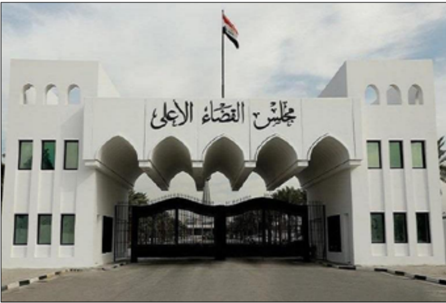
بوابة مجلس القضاء الاعلى في بغداد

من هم المالكون الحقيقيون لتلك الشركات ومن سمح بإعطاء الصكوك لتلك الشركات؟ وكيف عبر الأمر غير ملحوظ لعام كامل؟ من هم السياسيون المتورطون في عملية الفساد والسرقة الكبيرة هذه؟".