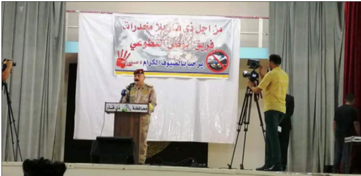
قائد عمليات سومر أثناء حضوره فعالية فريق الوطن التطوعي