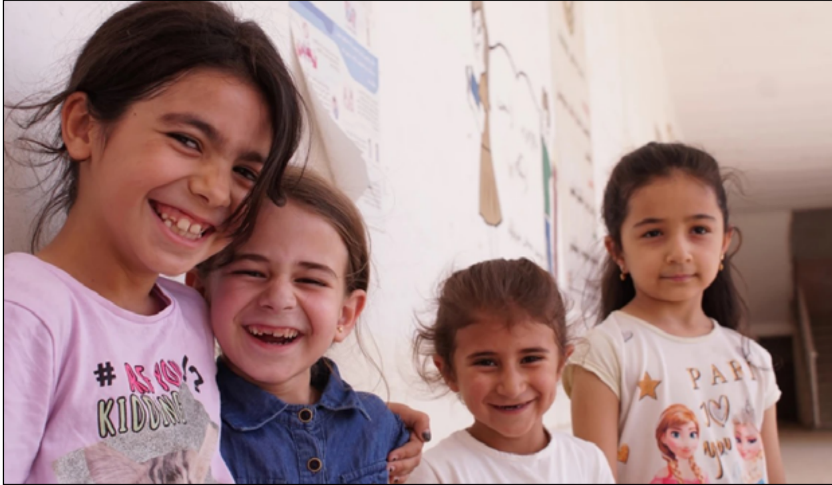
أربعة من أطفال مخيمات النزوح

ولفت، إلى أن "المنظمة تقول ان هذه الدروس والأنشطة تخدم كحلقة وصل بين الطالب والمدرسة، تساعدهم في تحسين مستواهم الأكاديمي واستذكار ما تم تدريسهم له سابقاً