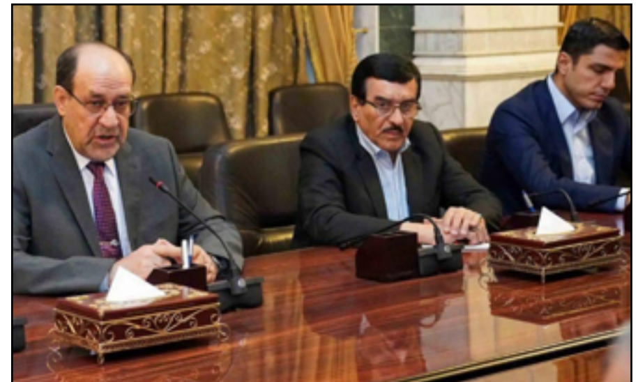
تأثير المالكي اصبح واضحاً على تشكيل الحكومة المقبلة

أحد الولايات المتحدة ستتابع احدى القضايا المتمثلة بالأموال المخصصة للجيش العراقي وجهاز مكافحة الارهاب في الميزانية مقارنة بالأموال التي ستخصص للحشد الشعبي». ودعا التقرير، «السوداني إلى تحديد التعامل مع الصدر وقاعدته الموالية له، حيث أنه في حال جرى استبعاده بشكل كامل من الحكم». وذهب، إلى أن «التعامل مع هذا الهدوء الشعبي الحالي على أنه أمر مسلم به ليس من الحكمة، طالما أن الصدر هو من يحرك وعاء الطبخة». وشدد التقرير، على «عدم وضوح موقف الإطار التنسيقي من الوجود العسكري الأمريكي» من الحكم». مذكراً بـ «قرار الرئيس الأمريكي السابق دونالد ترامب باغتتيال قائد قوة القدس الإيراني قاسم سليماني ونائب قائد الحشد الشعبي ابو مهدي المهندس، الذي أدى إلى مطالب علنية تدعو الى مغادرة القوات الامريكية». ووصف، «علاقة الحشد الشعبي بالولايات المتحدة بأنها أصبحت أكثر تعقيداً»، مستدركا أن «قوى الحشد وبعدما أصبحت الان في السلطة، قد تكون مترددة في القيام بتغييرات جذرية». ومضى التقرير، إلى أن «الأكثر إثارة للقلق، هو التأثير المحتمل لنوري المالكي على رئيس الحكومة الجديد، خصوصا وأن الإدارة الأميركية كانت قد حملت المالكي المسؤولية في تهيئة الظروف التي أتاحت احتضان داعش في العراق».