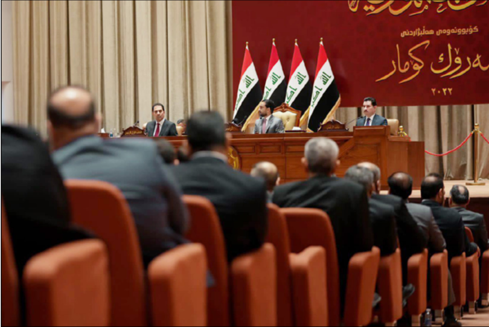
الإطار التنسيقي يحاول الاسراع في عقد جلسة منح الثقة للحكومة

وبحسب اتفاق اولي سيتم اكماله لاحقا داخل «الإطار» فان هذه الوزارات سوف لن تحصل على الاصوات اللازمة داخل البرلمان وستبقى شاغرة كما حدث في دورات حكومية سابقة، اصلا في ان يعود الصدر فيحصل على تلك المناصب المجمدة، وحتى الان يرفض زعيم التيار الصدري العودة الى العملية السياسية، وتتوقع أوساط الصدر ان «ينفجر الوضع» قريبا داخل الإطار التنسيقي. وبحسب تلك الاوساط ان «السوداني هو ظل نوري المالكي وسيعيد سياسات حزب الدعوة التي اهدرت ميزانية 8 سنوات (بين 2006 و2014)، خصوصا وان الاول كان وكيل وزير المالية في أكثر فترة تم التكتم فيها على النفقات وهي عام 2014، وتشير تلك الاوساط الى ان المناصب السابقة التي شغلها السوداني اهمها وزارة حقوق الانسان والعمل والشؤون الاجتماعية «لم تحدث فيها إنجازات واضحة وهو دليل غير كاف على كفاءة المرشح».