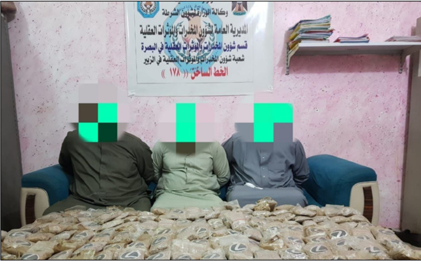
ثلاثة من تجار المخدرات بقبضة القوات الأمنية في البصرة