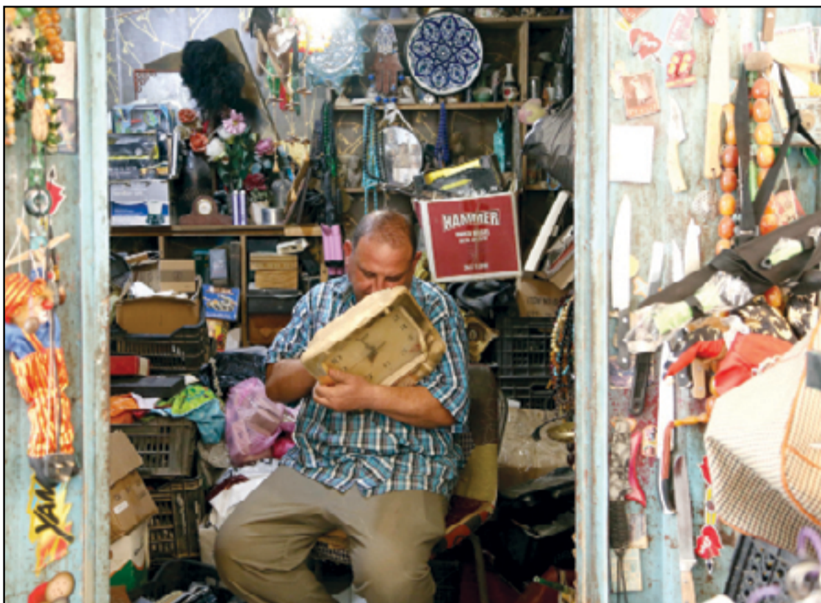
بائع مقتنيات قديمة في سوق الهرج.. عذسة: محمود رؤوف

أكد تقرير صحفي أميركي انتشارا كبيرا لمادة الكريستال المخدرة في العراق، لافتا إلى أن مصدرها يأتي من أفغانستان وإيران، وتحدث عن ضعف واضح في وسائل علاج المدمنين. وذكر تقرير لصحيفة (واشنطن بوست) الأميركية، ترجمته (المدى)، "داخل مقر وحدة مكافحة المخدرات في البصرة، نادراً ما يقل حجم كدس ملفات القضايا التي يتابعها العقيد المسؤول إيهاب. وأضاف التقرير، أن مناقشات ومباحثات تجري في كل ليلة تحت ضوء مصباح (الفلورسنت) الخافت قبل البدء بجولة جديدة من الغارات والمطاردات. وأشار، إلى أن العراق يعيش حالياً الأم وباء ادمان في وقت لجات فيه أعداد من جيل، علاوة على الفقر جراء حروب واهمال،