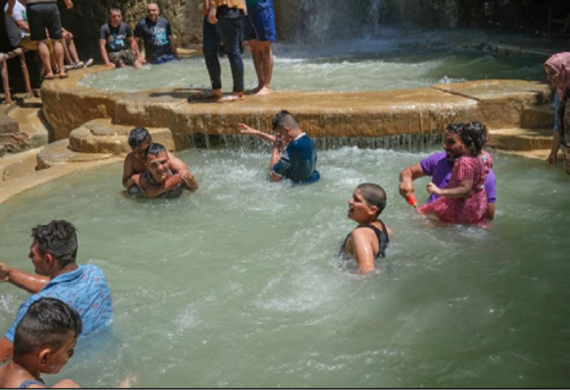
مجموعة أطفال مع عائلاتهم بأحد مصافي إقليم كردستان

الأكثر تعرضاً لخطر الوفاة المتعلقة بارتفاع درجات الحرارة كما تؤثر موجات الحر أيضاً على بيئات الأطفال وسلامتهم وتغذيتهم ووصولهم إلى المياه فضلاً عن تعليمهم ومعيشتهم المستقبلية بشكل عام". ونوه التقرير، إلى أن "اليونيسف تدعو الحكومات إلى حماية الأطفال من التدهور المناخي بتكثيف الخدمات الاجتماعية وإعداد الأطفال للعيش في عالم ذي مناخ متغير ومنح الأولوية للأطفال للاندماج في التمويل الموارد المتعلقة بالمناخ". وانتهى التقرير، إلى أن "منظمة اليونيسف تحث الحكومة أيضاً على العمل على منع وقوع كارثة مناخية، وذلك عن طريق الحد بشكل كبير من انبعاثات الغازات الدفيئة وإدامة الحرارة عند 1.5 درجة مئوية". وكان تقرير للمنظمة نشرته في 2.5 مليون قد أظهر، أن "العراق لا يزال فيه 2.5 مليون شخص، من بينهم 1.1 مليون طفل، بحاجة إلى المساعدة الإنسانية". وأضاف التقرير، أن "منظمة اليونيسف بحاجة إلى 52.2 مليون دولار أمريكي لتلبية الاحتياجات الإنسانية الحرجة والحادة للأطفال المعرضين للخطر والأسر المتضررة من مجموعة من الأوضاع الإنسانية".