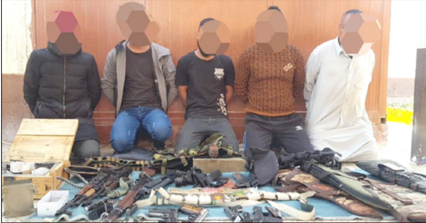
تمهون بنزاعات عشائرية بقبضة القوات الأمنية

الأحزاب لضمان بقائها في السلطة". وبدأت تتعافى وتحاول ملاحقة العشائر التي تحمل السلاح خارج إطار الدولة بتطبيق المادة 4 من قانون مكافحة الإرهاب، وهناك نجاحات واضحة في الوقت الحالي يتم الإعلان عنها في وسائل الإعلام. ويجسد مخلد، أن "هذا الملف طويل ومعقد، يكون بعض العشائر لديها سلاح