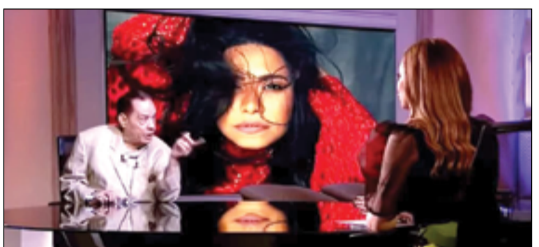
فجر الملحن المصري حلمي بكر مفاجأة للمخدرات وتورط الفنان حسام حبيب.

وأكد حلمي بكر أن شيرين مدمنة قبل ارتباطها به، وقد أضر ذلك سلباً بغنائها في الحفلات، لأن المخدرات تفقد الإنسان أعصابه. حديث حلمي بكر هذا جاء خلال لقائه مع برنامج تلفزيوني، وكان الفنان حسام حبيب، نفى تورطه في أزمة شيرين عبد الوهاب، ودخلها المستشفى للعلاج من الإدمان. وقال حبيب بمدخلة هاتفية في برنامج تلفزيوني: "خيرت شيرين بنيت وبين المخدرات، وتطلقنا عشان أنا كنت عايزها تبطل اللي بتعلمه وتبعد عن اللي حو اليها، وبقيت أنا مغضوب عليها".