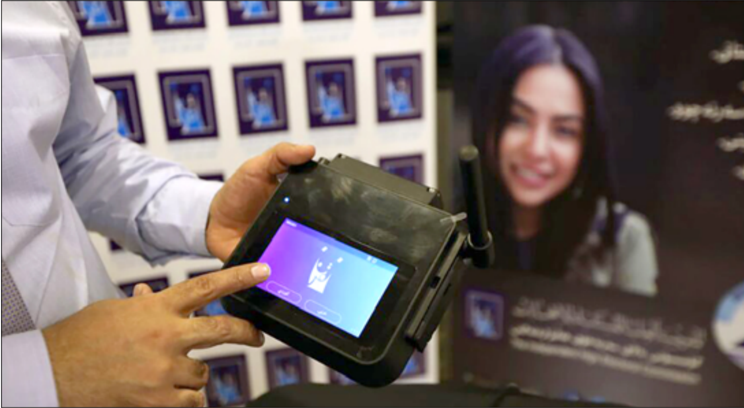
موظف اقتراح يعرض الية رقمية للانتخابات في اربيل

وأضاف بقوله "من اجل تحقيق ستراتيجية رقمية تحتاج الى حلول تسديد رقمية مستقرة، حتى بالنسبة لرواتب الموظفين فيجب ان يتبع نظام الحساب المصرفي المرخص والتوقف