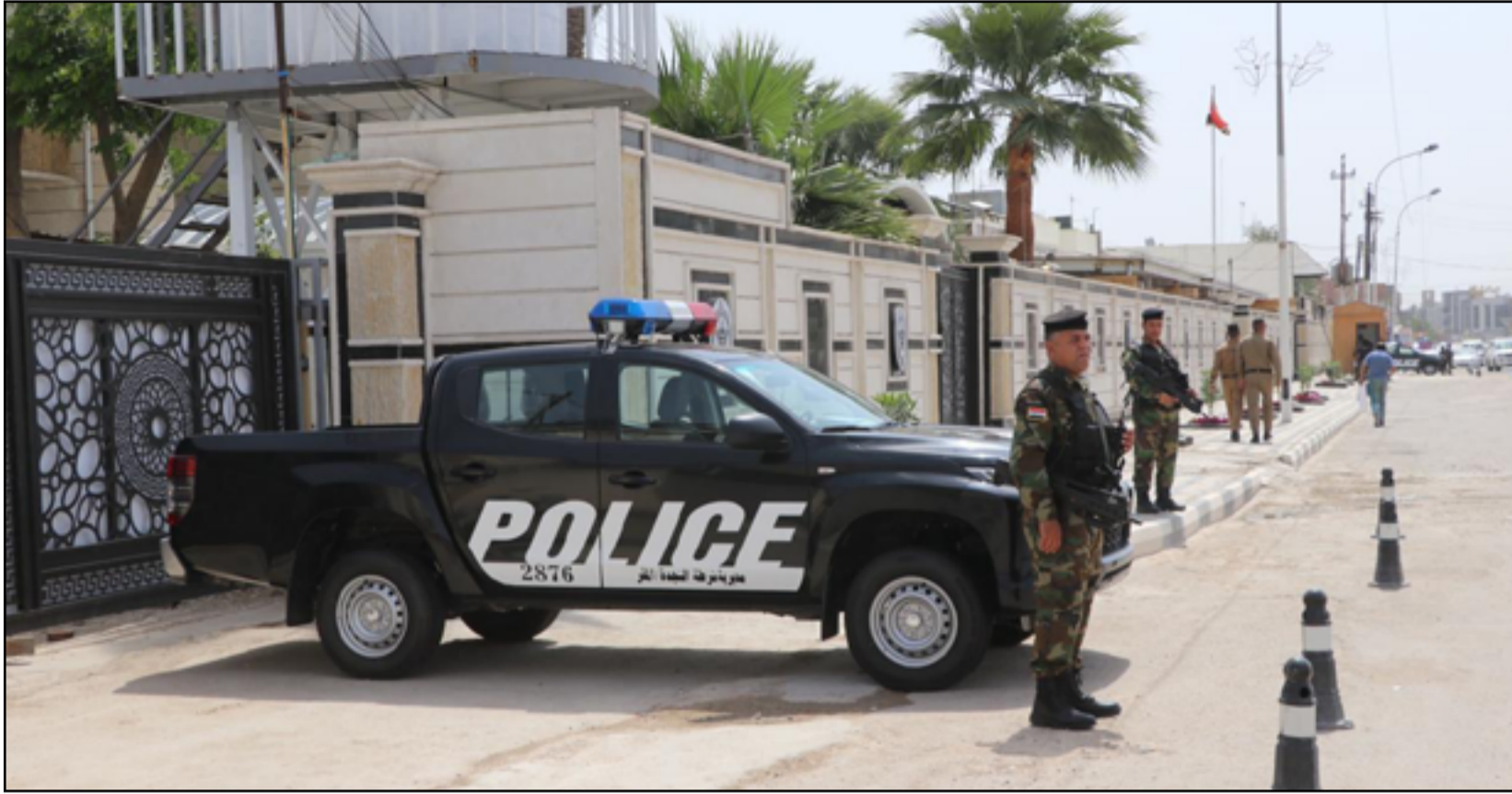
عناصر شرطة يقفون أمام إحدى المؤسسات الرسمية في بغداد

الهجمات أغلقت قنصليات وهددت شركات النفط وعطلت تحليق الـ«أف 16»