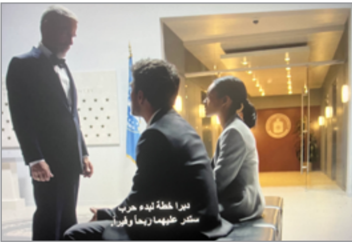
مشهد من نهاية المسلسل الامريكى (القناص) 2016

الجمهوري ريتشارد نيكسون في التجسس على مقر الحزب الديمقراطي الأمريكي ايام انتخابات عام 1972 وزرع أجهزة تنصت هناك، وبعد كشف الالاسبات وتجنبنا لسحب الثقة منه اضطر نيكسون للاستقالة على اثرها، وحيث اصبح مصطلح ووتر غيت رمزاً شعبياً للنشاطات والتآمر غير القانوني واستغلال مكتب التحقيقات الفيدرالي (FBI) ووكالة المخابرات المركزية (CIA) ودائرة الإيرادات الداخلية (IRS) كأسلحة سياسية. وهكذا ستقودنا عمليات البحث الى عناوين العديد من الأفلام، التي صيغت احداثها تبعا لمصطلح ومفهوم المؤامرة، وأمثلة: الفيلم الشهير (ثلاثة أيام من الكونдор- 1975)، عن الفساد في أجهزة المخابرات وحيث التهديدات للمواطن تمتد إلى أعلى المستويات في الحكومة، والفيلم من اخراج سيدني بولاك (1934- 2008) تمثيل روبرت ريدفورد مع فاي دونواي (مواليد 1941)، ترشح الفيلم لعدة جوائز منها الأوسكار لأفضل مونتاج. وفيلم (نظرية المؤامرة - 1997) اخراج ريتشارد دونر( 1930 - 2021)