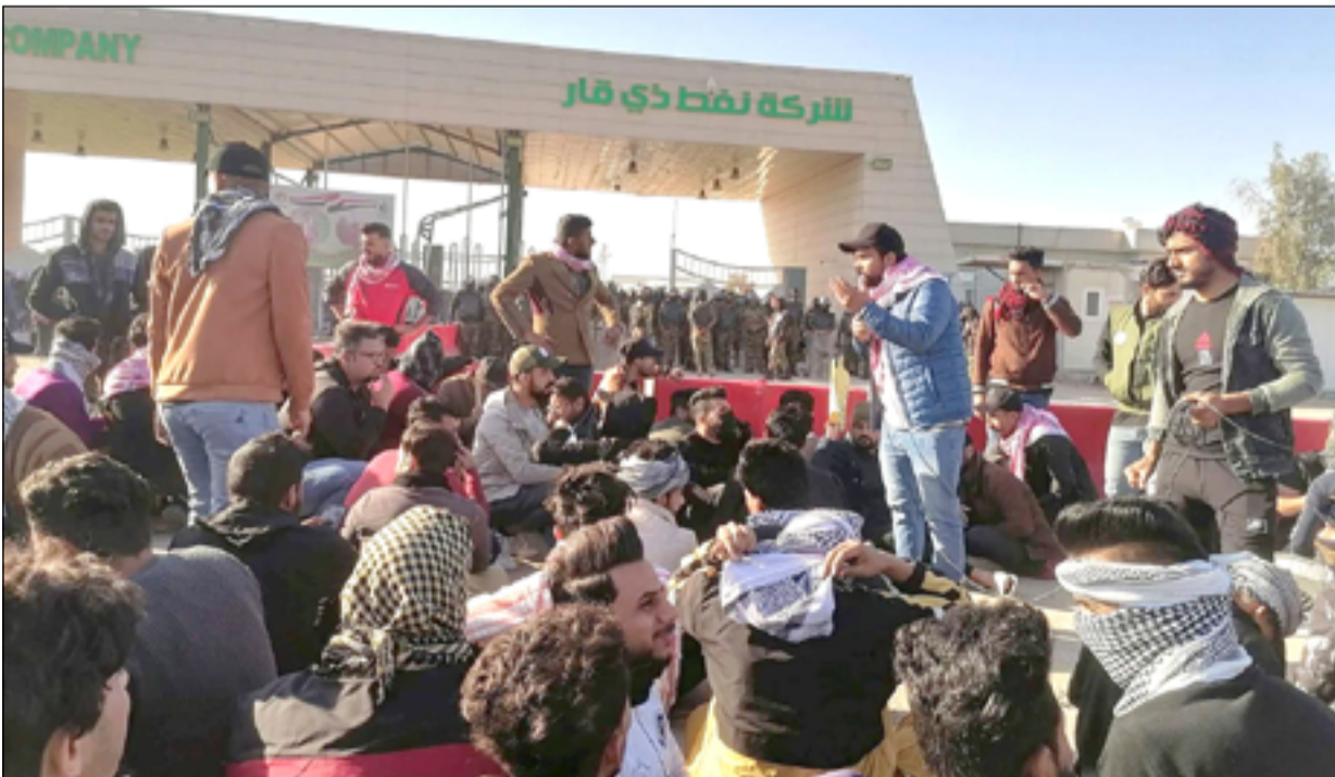
تظاهرات للمطالبة بالتعيين أمام شركة نفط ذي قار

الجريمة والانتحار بين اوساط الشباب العاطلين