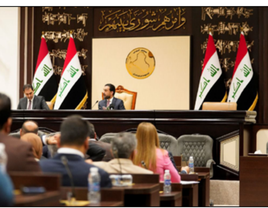
جانب من جلسة البرلمان التي عقدت أمس الأول

شأنه أن يساعد على زيادة الثقة بأن ورقة الاتفاق السياسي تضي نحو الطريق الصحيح». ويواصل سليمان، ان «توزيع الرئاسات سيكون بحسب الآلية التي تم بموجبها تشكيل الحكومة وهي أن تحصل كل كتلة على استحقاقها وفق ما لديها من مقاعد داخل البرلمان». ونوه، إلى أن «الجميع متفق على إدارة الدولة على أساس التوازن والتوافق والشراكة والالتزام