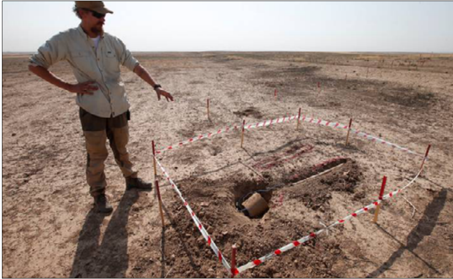
خبير إزالة متفجرات يتفقد لغماً أرضياً شرق الموصل

الحربية في محافظة البصرة التي تعاني من مخلفات حربية يرجع تاريخها لحقبة الحرب العراقية الإيرانية في ثمانينيات القرن الماضي. وذكر البيان ان المساهمة الفرنسية ستدعم العمليات المستمرة لإزالة الألغام في منطقة شط العرب قرب مدينة البصرة والتي ستمكن من المضي بمشاريع البنى التحتية وتعزيز التنمية الاقتصادية الاجتماعية في المنطقة. وقال مدير برنامج (يونماس) في العراق بيهر لودهايمر، ان هذه المساهمة تؤثر بشكل إيجابي على السكان المحليين في البصرة وتعزز جانب التنمية الاقتصادية في البصرة ومنطقة شط العرب حيث ستعمل على توفير أراضي جاهزة للزراعة وتنمية الإنتاج الاقتصادي. وذكر مكتب (يونماس) لمكافحة الألغام في العراق ببيانه انه بحلول عام 2021 تمكن من تنظيف مساحة تقدر بحدود 5 ملايين متر مربع من الألغام. وأشار، إلى ابطال مفعول 9 آلاف قطعة من المخلفات الحربية والألغام، لافتاً إلى أن