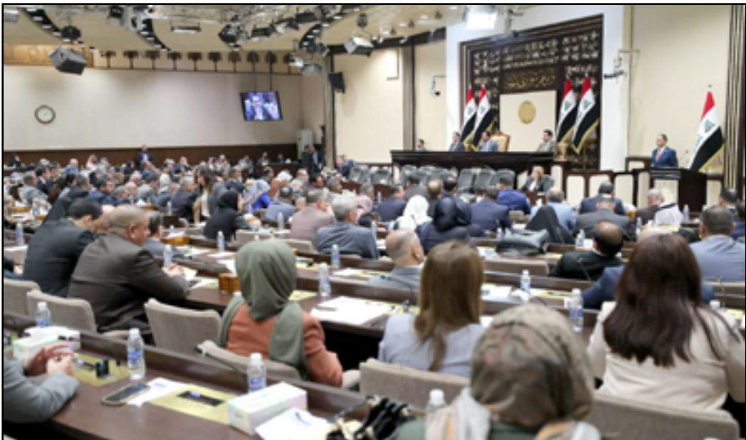
جلسة البرلمان ليوم أمس

وأكد، أن «شريحة الشباب تعاني من ضغوط عديدة أبرزها البطالة وعدم توفر