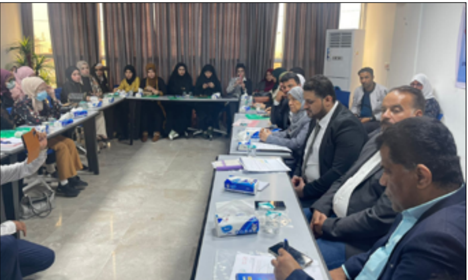
جانب من الاجتماع

وأكد الشريفي "التوصل إلى حلول وتوصيات بهذا الشأن، بعضها طبقت على ارض الواقع من قبل الحكومة المحلية".