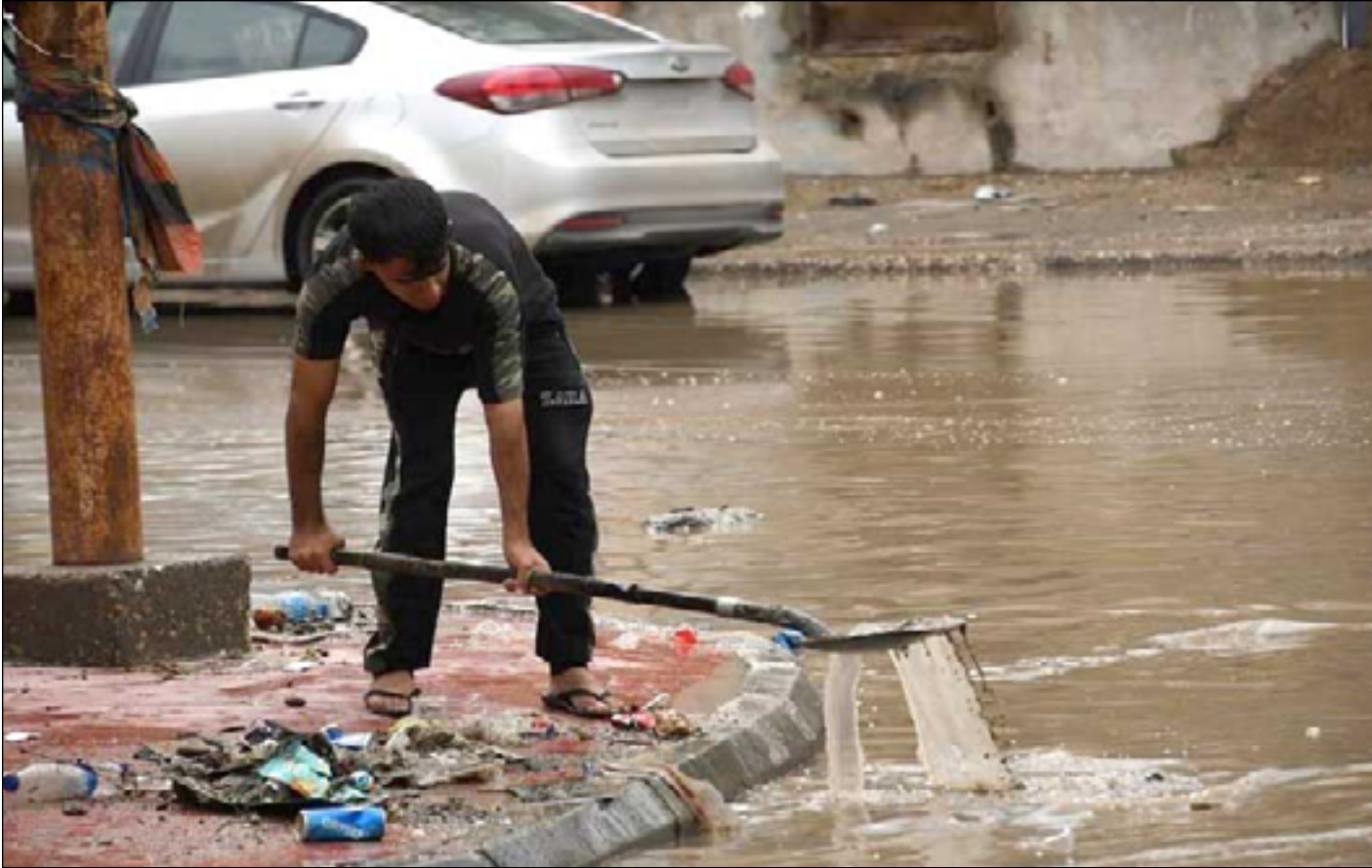
الامطار تقاوم معاناة أهالي محافظة ذي قار

منخفضة. ودعا الفخاجي، وزارة الصحة إلى الموافقة على مشروع إنشاء مستشفى تخصصي كون القضاء ما زال يعمل بنظام المراكز الصحية". يأتي ذلك في وقت نكرت وكالة الإنشاء الرسمية، أن رئيس الوزراء محمد شياع السوداني، وجّه بتفقد أحوال عائلة في قضاء الفجر بمحافظة ذي قار انهيار سقف دارهم جراء سقوط الأمطار وتوفي على أثره رجل وزوجته وطفلاهما اثنان. وأضافت الوكالة، أن "السوداني وجّه ايضا برعاية الأطفال الأربعة الذين نجوا من جراء سقوط سقف الدار وشمولهم براتب الرعاية الاجتماعية مع تقديم مبلغ مالي لهم . ويرى الناشط حسن هادي المدرس وهو من أهالي سوق الشيوخ، أن "تساقط الأمطار هو بارومتر لاختبار مستوى الخدمات فمدد خلال هطول الأمطار تتكشف جودة المشاريع من رداءتها". وتابع المدرس، أن "شوارع قضاء سوق