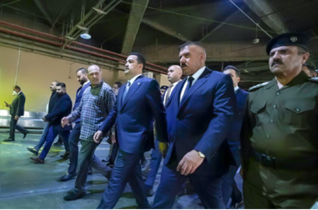
السوداني إلى جانبه عدد من المسؤولين في حكومته أثناء زيارته إلى مطار بغداد