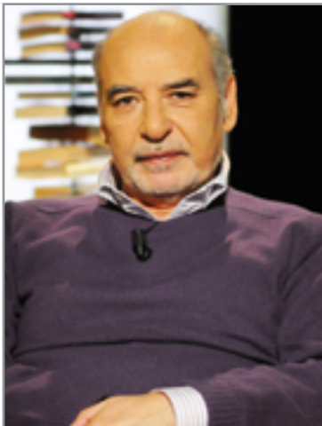
الطاهر بن جلون

للجميع إن المحرك للتناحر والاحتراب ليس إلا البحث عن المعد الأقرب للغتنا، والأدبي من ذلك إن من لا ينجرف مع موجة الشعارات الجوفاء ولا يبتضم إلى جوقة الاستعراضيين سيكون مكانه الهامش وبالطبع أن قساوة هذا الوضع أشد تأثيراً على من يهيمه الحفاظ على الاستقلالية الفكرية ويأبى التبعية للمتاجر السياسية. ولكن ما يكسب المرء مناعة في هذا الوسط الموبوء بالعاهات الذهنية هو التمرّد على مبدأ الفجوة في الاشتغالات المعرفية. من الواضح أن الحديث عن السياسة مرهق وممل لذا حري بنا العودة إلى حكاية الجنرال مع الكتب فمن المتوقع أن يصادر الذهب والمال خلال الاقتتال والحملات العسكرية غير أن المكتبة غالباً إما أن يُصرّف عنها النظر أو تدمر لذلك فإن قرار المكتبة بأخذ الكتب معه مثير للإعجاب بقدر ماخلف الأمل في الأنفوس. يصيب له أنه لم يحرق المكتبة كما فعل ذلك الغول بمكتبات بغداد، لاشك إنه كان عارفاً بقيمة الكنز المعرفي وإلا كيف تجشّم عناء هذا الاختيار في زمن حارق؟ والسؤال الذي لا يغادر الرأس هل تصفح الجنرال محتويات الكتب وهل قرأ ما دون عليها من الملاحظات وتاريخ اليوم الذي اشترى فيه الولد كتابه الأثير؟ هل أمهل القدر ذلك العسكري لقرأة جل ما اغتتمه إن لم يكن كله أو قضت عليه الحرب؟