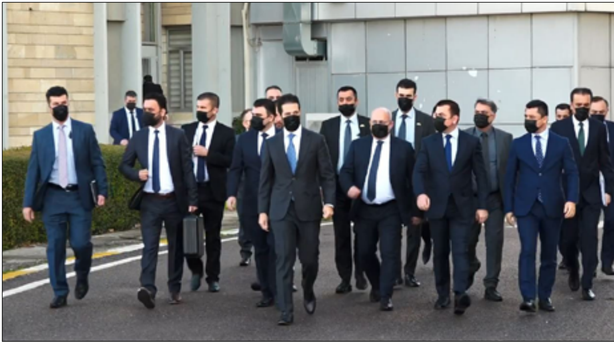
زيارة سابقة لوفد إقليم كردستان إلى بغداد

ووزير التخطيط، ورئيس الديوان لمجلس الوزراء، وسكرتير مجلس الوزراء". وأضاف: "كما صدرت تعليمات لهم، ببدء المفاوضات في إطار الحقوق الدستورية، وقرارات مجلس الوزراء، بشأن القضايا العالقة في أقرب وقت ممكن، وأكدوا "تقرر في اجتماع مجلس الوزراء (في الإقليم) أن يتألف الوفد التفاوضي مع الحكومة الاتحادية من: وزير المالية، ووزير الموارد الطبيعية بالوكالة،