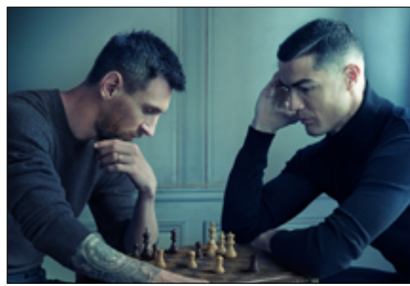
الاجتماعي بعد أن وصف لاحظ محبو رياضة الشطرنج، ب"الإبداع"، لا سيما بعد أن أن قطع الشطرنج الموضوعه

على حقيبة "لويس فيتون" كانت مطابقة تماماً لمباراة شهيرة بين من ينظر إليهما على نطاق واسع بأتهما أفضل من يمارس هذه الرياضة الذهنية، وكتبت الشركة عبر تويتر: "النصر هو حالة ذهنية. بالإضافة إلى تقليد طويل في صناعة جنود الكؤوس الرياضية الأكثر شهرة". يأتي الإعلان بالتزامن مع انطلاق نهائيات كأس العالم لكرة القدم في قطر ٢٠٢٢، حيث يتطلع النجمان إلى رفع الكأس الغالية حيث لم يسبق لأي منهما إحراز الموندنيل.