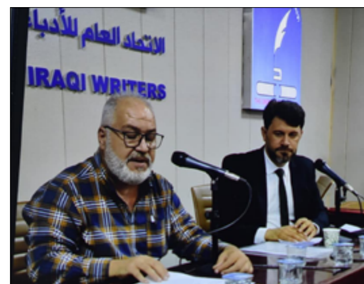
والعشرين. وقد كان لوسائل التواصل الاجتماعي الدور الأبرز في تعميم ونشر هذا النوع من الشعر. وينبغي الإشارة إلى أن الهايكو المكتوب باللغة العربية

ينحو منحى الهايكو العالمي المكتوب خارج اليابان، ومن هنا فإن: ١. قصيدة الهايكو وصفية ومكثفة جداً، تعتمد بناءً شكلياً من ثلاثة سطور (قصير، طويل، قصير) بمشهد واحد في الأعم أو أكثر أحياناً. ويمكن تجاوز هذه الشكلانية التي ابتكرتها المدرسة التصويرية للإيجاز والتكثيف الكبير في اللغة العربية. ٢. الهايكو المركب باللغة العربية يتجاوز استخدام البلاغة اللغوية والمحسنات والبيدع ولا يعتمد في تكوينه المجازات المشاعرة التي من شأنها أن تغير من المشهد، وإنما المجاز الذي بات من أصل اللغة باستعارة ضمنية بسيطة. كما يعتمد أيضاً على البلاغة المشهية بزمن الحاضر، ويتجاوز الروح المأساوية والفلكل والإطناب والغوص والذاتية المفرطة التي تكون مدسوسة/ متورطة بالمشهد على نحو لا يتلاءم مع الحدث