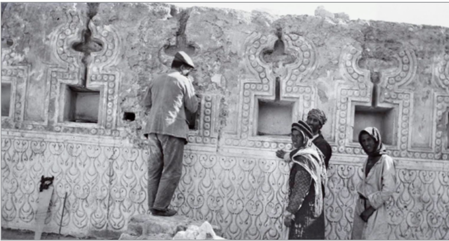
لحظة اكتشاف وتنظيف في سنة 1913 لـ "مصر بلقوار" احد قصور سامراء الريحية

لدى ثقافات تخطيطية أخرى كالعمارة الكلاسيكية أو العوطية وغيرهما. إذ لصيغ خطط تلك الشوارع والأضلاع إليها. بمعنى آخر، من السهولة بمكان مدّ شوارع جديدة من جهة الشرق مثلاً في مخطط المدينة (وهو الأمر الذي حدث وأُعدّ في الواقع "الحير الجديد" الواقع في أقصى الشرق استحدثت عندما تم ردم سور الحير وبناء هذا الشارع الموازي إلى شارع "عسكر" ضمن شبكة شوارع المدينة الأخرى. ونظرياً يمكن إيجاد شارع آخر، إذا كان من ثمة طلب أو ضرورة العظمى ودور الخبذة الخ...): إلا أن ذلك لا يعني بالضرورة توقف الشارع عند احد منها، أو التركيز على تلك "البؤرة" التخطيطية الهامة Focal Point، أو بما