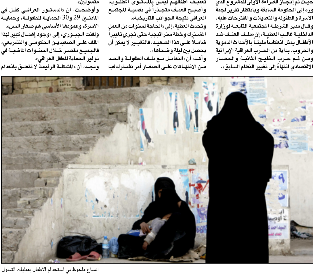
اتساع ملحوظ في استخدام الأطفال بعمليات التسول