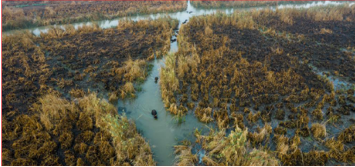
الجفاف يتسبب باضرار كبيرة جداً للاهوار

وشدد، على أن "تنافس الاستحواذ على منابع النهرين التي تنطلق من تركيا وتقطع أراضي في سوريا وكذلك إيران قبل ان تصل الى العراق، قد عقد قدرة بغداد على اعداد خطة مائية". وواصل التقرير، أن "انقرة وبغداد لم تتكئا من التوصل لاتفاق على كمية محددة من تدفق المياه بالنسبة لنهر دجلة". ويسترسل، أن "تركيا ملزمة