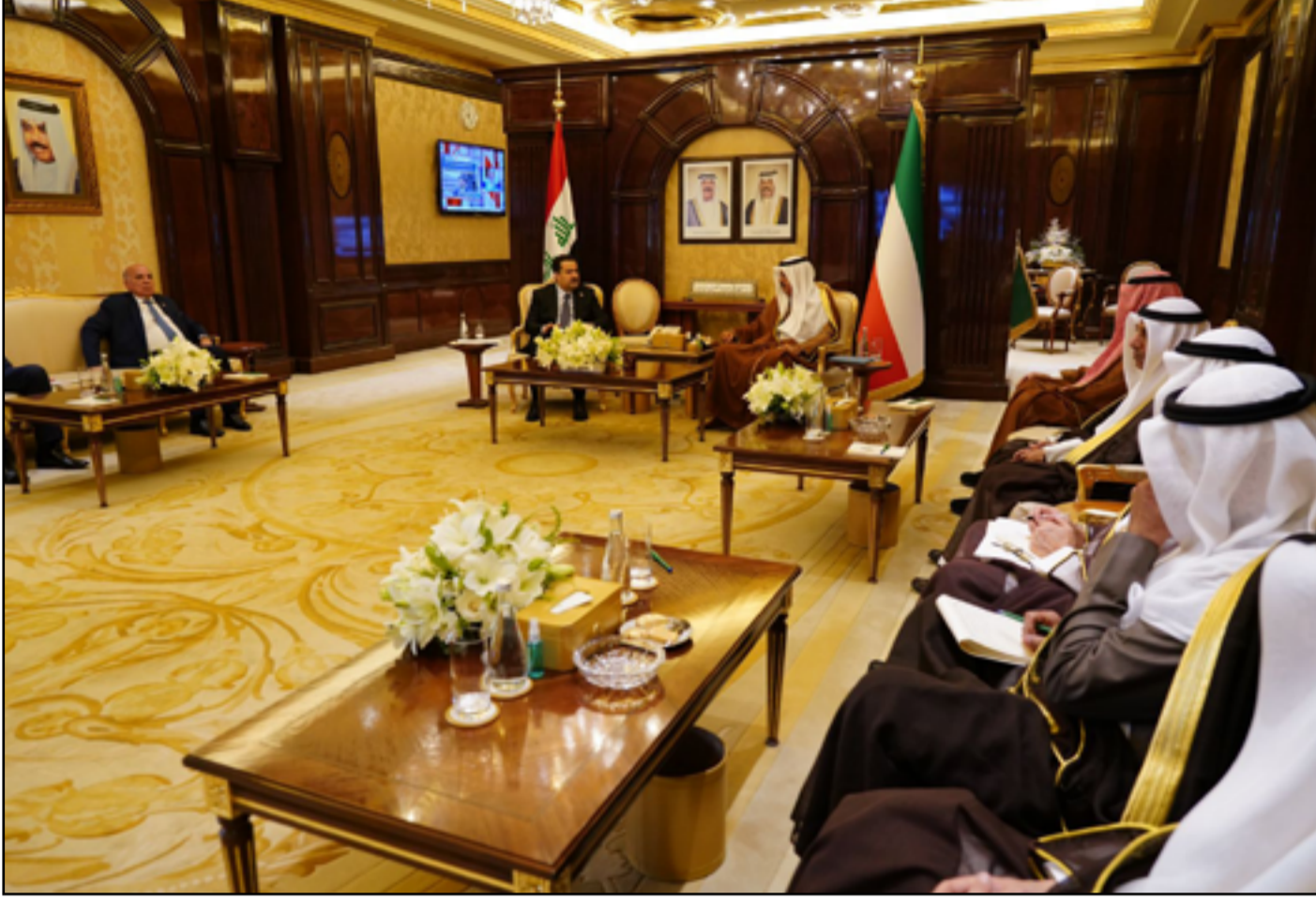
السوداني خلال جولة المباحثات مع الحكومة الكويتية أمس