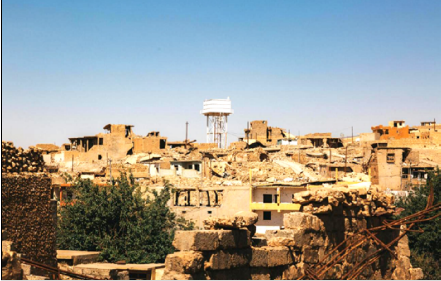
دمار كبير خلفه داعش في قضاء سنجار

ونكر تقرير نشره، مركز (ريس) للقانون والأمن في جامعة نيويورك، ترجمته (المدى)، أن "قضاء سنجار، وبعد مرور أكثر من ثماني سنوات على اقتحامه من قبل تنظيم داعش ما زال لحد اليوم يعاني الدمار والخراب وعدم الاستقرار". وأضاف التقرير، أن "المنطقة، وبعد مرور طوال هذه الفترة، لم تشهد أية مشاريع استثمارية تساعد على تعافيتها، أنها في الواقع بحاجة ماسة لدعم دولي". وأشار، إلى أن "الإرادة الدولية للمساعدة في إعادة الاستقرار للعراق قد تراجعت كثيراً خلال السنوات