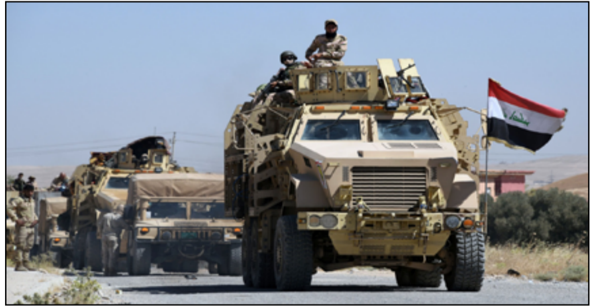
عجلات تابعة للجيش العراقي تنفذ عملية تمشيط في المناطق المحررة

□ بغداد / فراس عدنان أفادت قيادة العمليات المشتركة بان تنظيم داعش الإرهابي فقد القدرة على المواجهة المباشرة، مشيرة إلى قرب القضاء عليه بشكل نهائي، وتحدثت عن تطور نوعي في تعاون المواطنين مع الأجهزة الأمنية في المناطق المحررة. وقال المتحدث باسم قيادة العمليات تحسين الخفاجي، إن "مواجهة بقايا تنظيم داعش الإرهابي ما زالت مستمرة بعمليات مختلفة ذات طابع نوعي". وتابع الخفاجي، أن "قيادة العمليات المشتركة شهدت أمس الأول احتفالاً مركزياً حضره القائد العام للقوات المسلحة محمد شياع السوداني بمناسبة الذكرى الخامسة للانتصار على تنظيم داعش الإرهابي". وأشار، إلى أن "القوات الأمنية وبعد انتهاء الاحتفال مباشرة أعلنت عن خیر مهم، هو تمكن الفوج الثاني في اللواء 91 التابع لقيادة عمليات صلاح الدين من قتل ستة من الارهابيين". ولفت الخفاجي، إلى أن "هذه العملية تؤكد استمرار متابعة العدو؛ لأننا نبحت اليوم عن إدامة النصر الذي حققناه في عام 2017". وأوضح الخفاجي، أن "رسالة نبعثها إلى العراقيين بأن القوات المسلحة بمختلف تشكيلاتها لن تدخر جهداً في مواجهة التنظيم الإرهابي، والقضاء عليه نهائياً". وبين الخفاجي، أن "الهجوم الذي استهدف الإرهابيين في صلاح الدين أمس الأول كان نتيجة تعاون المواطنين في منطقة تلول الباج، حيث تم تشخيص ستة إرهابيين معهم عجلاتهم واسلحتهم وأجهزتهم اثنین منهم انتحاريين". وأفاد، بأن القوات الأمنية حاصرت هؤلاء الإرهابيين والاشتياك مع ثلاثة في المرحلة الأولى وقتلهم، فيما حاول الرابع الهرب لكن تم التصدي له من قبل أهالي المنطقة مع الجيش العراقي، وقتله في حال". ولفت الخفاجي، إلى أن "الاثنتين المتبقيين