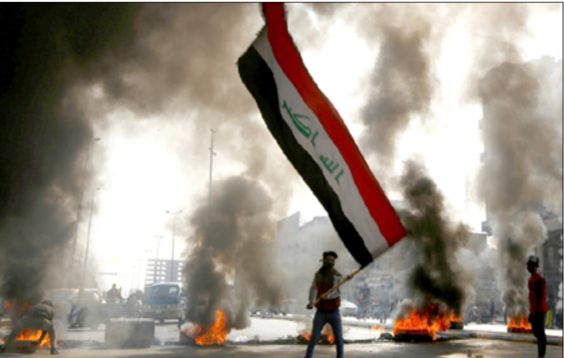
محتجون في الناصرية يقطعون الطريق بالاطارات المحروقة

ووفق آخر تحديث لأسعار النفط، سجلت العقود الآجلة لخام برنت ٧٦,٧٤ دولاراً للبرميل بارتفاع ٥٩ سنتاً، أو ٠,٨٪، بعد أن هبطت ١,٣٪ الخميس الماضي. وارتفع خام غرب تكساس الوسيط الأميركي ٦٨ سنتاً، بما يعادل ١٪، إلى ٧٢,١٤ دولاراً للبرميل، بعد أن سجل انخفاضاً ٠,٨٪ عند التسوية في الجلسة السابقة. ويقول المختص بالشأن النفطي حمزة الجواهري، إن قرار منظمة أوبك بتخفيض الإنتاج لم يؤثر في صادرات العراق، بل قلل الإنتاج الداخلي، مبيناً أن "الالتزام بقرارات أوبك من المتوقع أن يجعل مستويات الأسعار تتراوح بين ٩٣.٨٣ دولاراً للبرميل". وأضاف الجواهري أن "الزيادة التي تحصل في الأسعار بحدود ١٠ دولارات أو أكثر، تعوض التخفيض الذي يبلغ نحو ٢٢٠ ألف برميل، وربما يزداد الريح بسبب استقرار الأسعار". ويزداد تراجع الأسعار إلى "الإغلاق التام في الصين لبعض المقاطعات بعد انتشار فيروس كورونا مرة ثانية، فضلاً عن الحرب الروسية - الأوكرانية التي تضغط على الأسعار، فضلاً عن الضغوطات