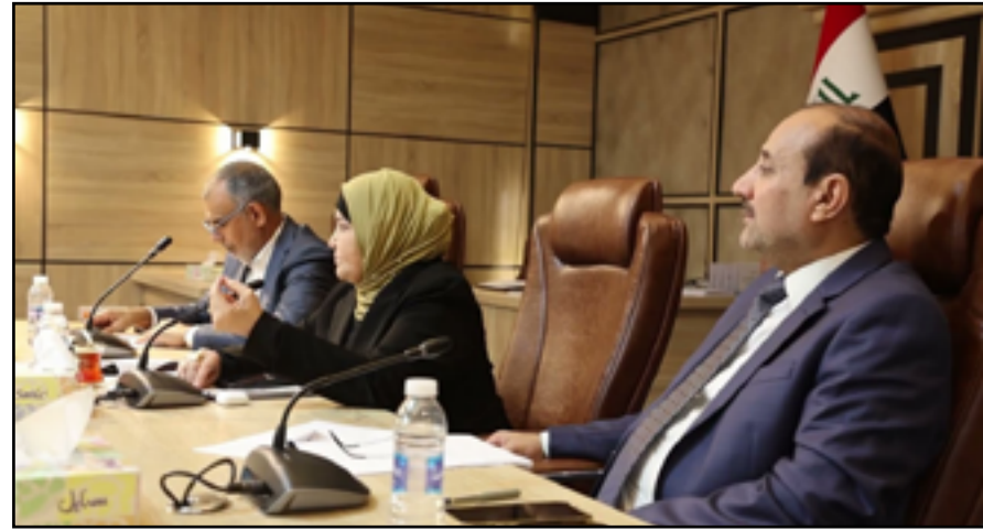
اللجنة المالية ما زالت تنتظر ورود قانون الموازنة من الحكومة