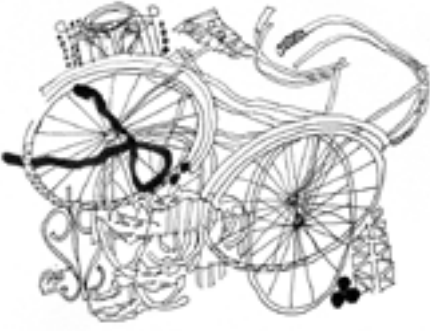
سيدني في 2022/11/5

- اللغة أكبر من وظيفتها التواصلية: حقيقة أخرى لايجب نسيانها أو التغافل عنها. اللغة لم تكن أبداً أداة تواصل بين البشر فحسب؛ لكن فضلاً عن وظيفتها التواصلية فإن اللغة تجعل كلاً منا يدرك الأشياء ذاتها ولكن بطريقته الخاصة المهوربة بخصته الشخصية. اللغة هيكل إطراري يشكل قاعدة لرؤيتنا المميزة للعالم: العربي مثلاً يرى العالم بطريقة تتمايز عن رؤية الإنكليزي أو الفرنسي أو الألماني أو الياباني أو الصيني،،،، اللغة بهذا المفهوم حاصل لهذه الرؤية، وكل لغة جديدة نتعلمها هي إعادة تشكيل رؤيتنا للعالم. هل ثمة من يريد خسران هذا التنوع الخلاق في رؤية العالم؟