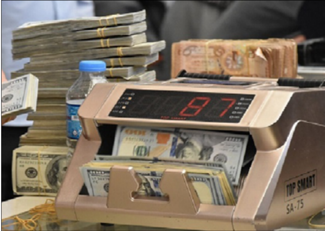
اسعار الدولار مستمرة في الارتفاع رغم الاجراءات الحكومية

وأشار، إلى أن "هذا الربح الفاحش والفساد الواضح كان ضحيته المواطن البسيط من خلال ارتفاع اسعار السلع