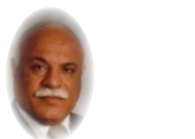
زهير كاظم عبيد

إن هذه التظاهرات السلمية تعبّر عن بروز حالة من الوعي لممارسة الحقوق السياسية لدى المواطن العراقي، وهي أيضاً تعكس حالة الخلل وانتشار الفساد في مفاصل الدولة مما يستوجب العمل بشكل مشترك من خلال الاستجابة إلى طلبات المواطنين المشروعة والمعقولة لمكافحة الفساد وإصلاح حال البلاد، وهي أيضاً تعبّر عن الممارسات العملية للحقوق التي ضمنها الدستور، وبالتالي فإن أي انتهاك لهذه الحقوق والحريات يجعل مركبيها تحت طائلة القانون والمحاسبة. والتظاهر تنفيس لصوت المواطن يطلقه في فضاء رحب، لذا فهو يحمي حق المواطن في التعبير والاحتجاج، ويمنحه حرية الكلام والموقف وجهة النظر، ويمكن النظر إلى تجارب دول حديثة لم تمنح المواطنين حرية التظاهر والتجمع فحسب، بل وفرت لهم المكان الذي يمكن للمواطن أن يمارس حريته في الكلام وإبداء وطرح أفكاره ومعتقداته بحرية تامة، بشرط أن لا يتعدى ولا يمس حقوق الآخرين، ومادامت التظاهرات سلمية وترفع شعارات مطلية مشروعة، فإن أي تدخل أو منع أو عقلة لها من قبل أي جهة تجعلها مخالفة للقانون يستوجب الأمر إحالتها على المحاكم القضائية ومحاسبتها حتى تكون عبء لغيرها ممن لم يؤمن أو يعتقد بالزامية نصوص الدستور والقوانين حتى اليوم.