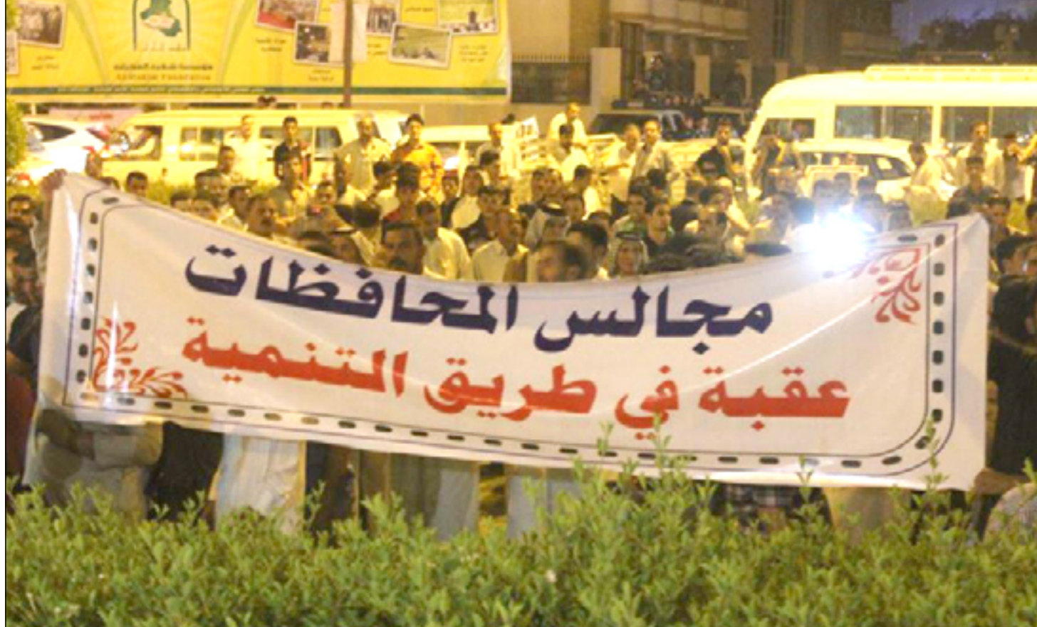
عراقيون يتظاهرون ضد مجالس المحافظات

من أجل عدم إجراء انتخابات عامة. وذكر تقرير لمعهد واشنطن للدراسات، ترجمته (المدى)، أن "نظام سلطة الحكم اللامركزي الذي اتبع في عراق ما بعد عام 2002 كان من الممكن ان يكون تريباقاً ضد الحكم السلطوي والفساد".