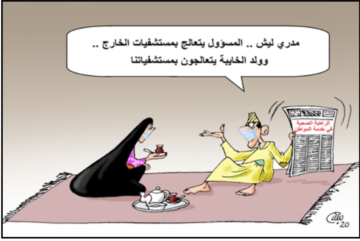
مدري ليش.. المسؤول يتعالج بمستشفيات الخارج.. وولد الخايبة يتعالجون بمستشفياتنا