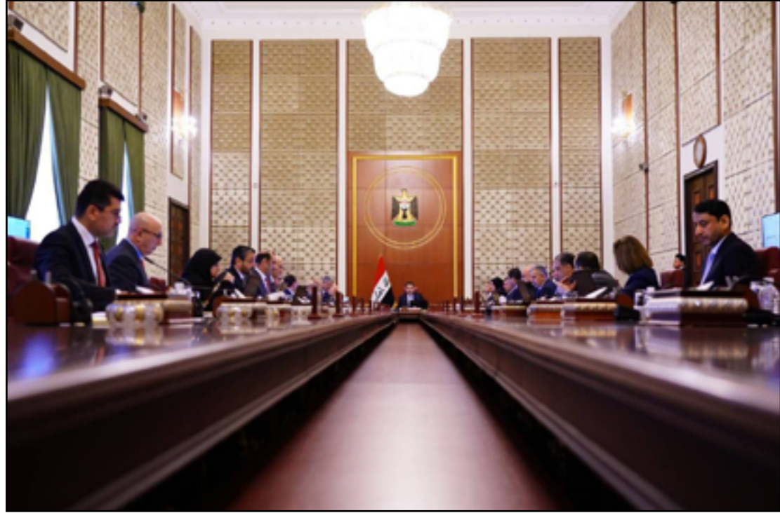
اجتماع مجلس الوزراء برئاسة السوداني أمس

وكان رئيس البرلمان قد اخرج شركاءه السنة والشيعية حين تحدث في مقابلة تلفزيونية قبل ايام، عن عدم قدرة اية جهة حتى لو كانت الإطار التنسيقي بخول منطقة جرف الصخر (جنوبي بغداد)، ورفضه الاستمرار بما وصفه بـ "تخليط مغدورين" وتغيير اسمهم الى "المغدورين" وفي تلك الاثناء كانت الحكومة توقع على البرنامج الوزاري الذي تضمن تخصيصات لأراضي للمواطنين وانشاء طرق ومستشفيات جديدة. وخلال اجتماع الحكومة، قرر السوداني اخضاع جميع الكادر الوظيفي العالي الى فترة تقييم، فيما لم ينكر ماهي الاجراءات التي سيتخذها بعد انتهاء التقييم او الجهة التي ستقوم بهذه المهمة. ووفق مصادر سياسية اعتبرت التقييم بانته سيطيح السوداني فرصة للتخلص من الضغط الذي يتعرض له في قضية استبدال الوزراء شهدت اقرار البرنامج الحكومي والتصويت عليه. وأكد السوداني بحسب البيان، أنه سيتم تقييم عمل الحكومة في ضوء برنامجها الحكومي المقر، وسيشمل التقييم الوزراء