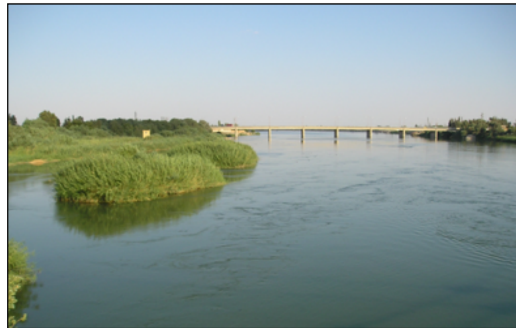
المخاوف مستمرة من موسم جاف يسهم في انحسار مياه الانهر العراقية

وفيما أقر، بأن "البلاد تعاني حالياً من فراغ خزني"، لكنه عاد ليحدث