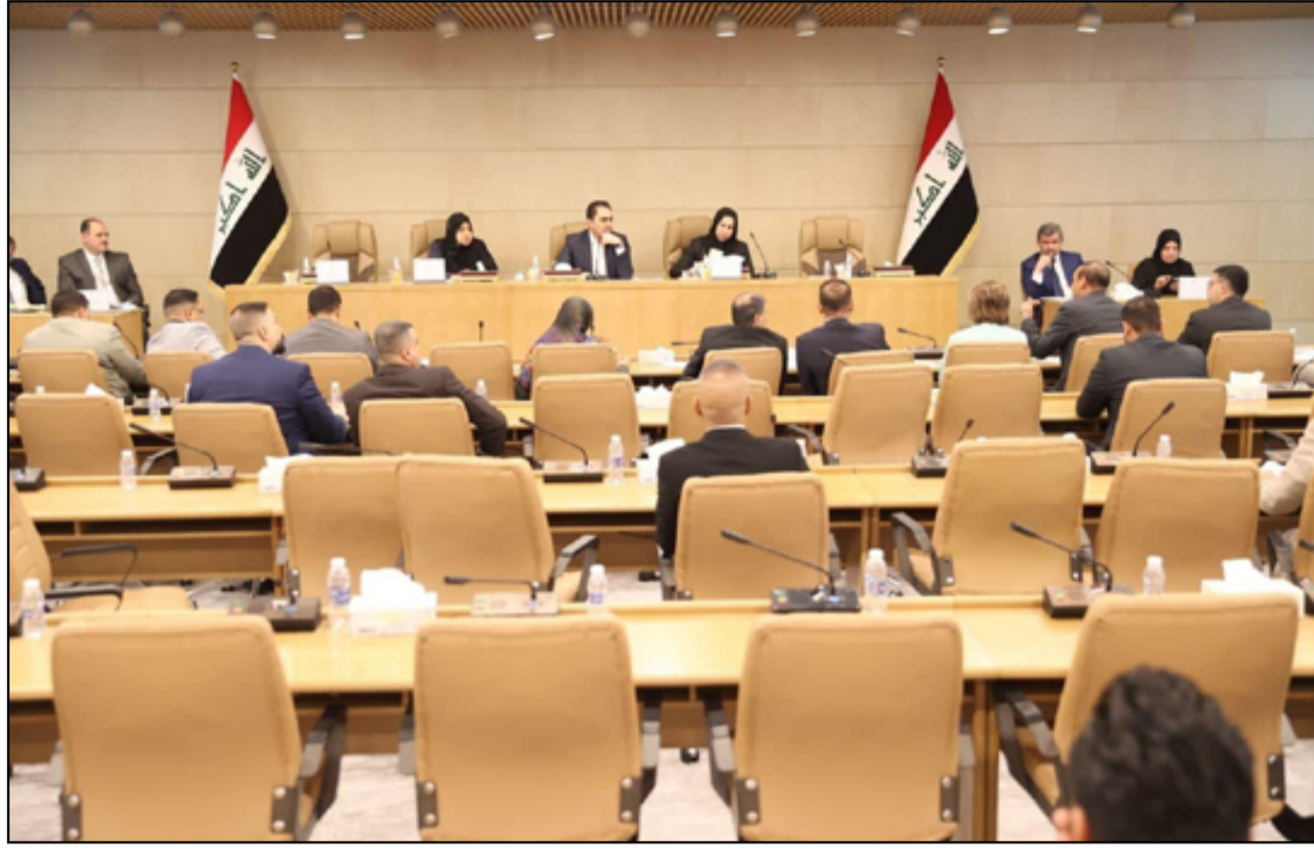
واحدة من الجلسات التي عقدت في البرلمان للتحقيق في سرقة القرن

وضع مؤتمر لندن لمعارضي صدام حسين نهاية عام 2002 الخطوط العريضة لعملية الانتقال من حكم الفرد الواحد والحزب الواحد واللون الواحد إلى حكم الشراكة والتوافق والقيادة الجماعية.. هكذا في الوثائق.. وفي خلفية هذا السيناريو ثمة موضوعات كان الخطاب المعارض قد روج لها في أكثر من وثيقة وتصريح بان العراق لا يمكن أن يحكم من جهة واحدة حين يطاح بنظام البعث.. وهذا ما حدث (برعاية امريكية) وتلك هي العملية السياسية التي جرى ويجري الحديث عنها كقاعدة تفاهم بين فرقاء الحكم الجديد، واعتماد مبدأ التضامن و"الموقف الموحد" وإدارة الأزمات عن طريق الحوار والديمقراطية.. وهكذا قيل.