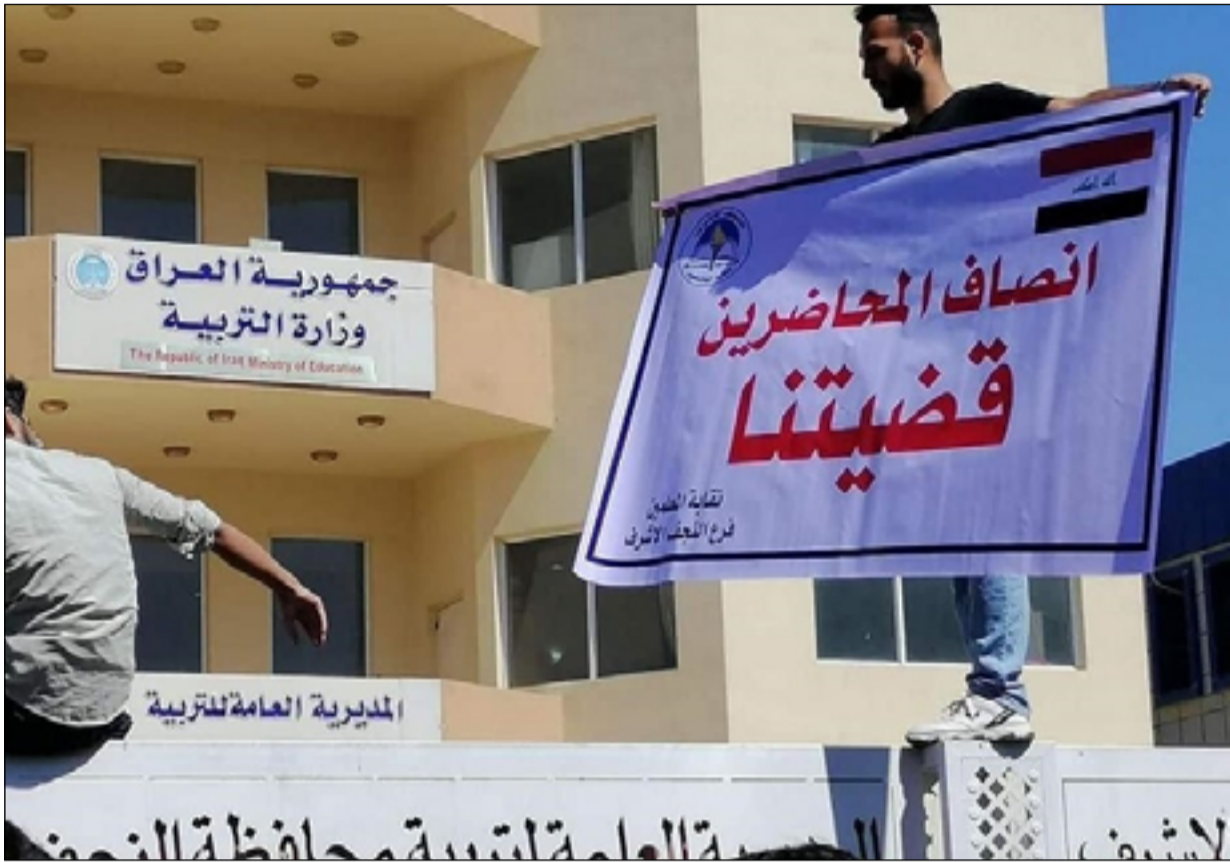
تظاهرات للمحاضرين المجانيين في النجف

واوضح انه بعد أن تنقل في مدارس عدة، وخلال استعداده لامتحانات نصف السنة طالبه مدير مدرسته بإعادة الصف الثاني المتوسط مرة أخرى؛ بحجة عدم وثيقة تثبت نجاحه فيه. ودعا القيسي، وزير التربية إبراهيم نامس الجبوري لـ "تشكيل لجنة تحقيقية للاطلاع على حثيات هذه القضية وكشفها، وبيان حقيقة الأمر، ومحاسبة المتسببين بهذه المشكلة كي لا تتكرر مجددا وتسيء إلى سمعة جهود وخبرات". وأشار، إلى أن "الكلف المالية