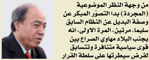
من وجهة النظر الموضوعية (المجردة) بدأ التصور المبكر عن وصفة البديل عن النظام السابق سليماً، مرتين، المرة الأولى، انه يجنب البلاد مهاوي الصراع بين قوى سياسية متنافرة وتتسابق لفرص سيطرتها على سلطة القرار

"الخيبة الأولى موجعة، أما البقية فهي دروس تقوية". مالكولم أكس