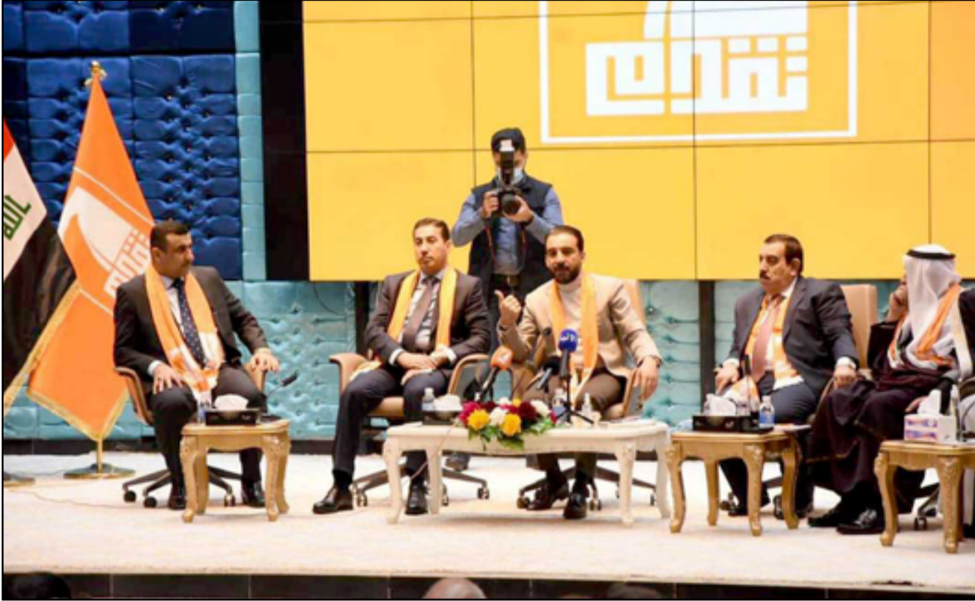
الحلبوسي اثناء حضوره في المؤتمر الأول لحزبه

الإطار والقوى السنية والكردية وهي تدعمه في البقاء بمنصبه". لكن بالمقابل لا ينبغي القيادي في تقدم وجود أطراف شيعية تحرض ضد محمد الحلبوسي، مبيّناً أن ذلك جاء بسبب نجاحات الأخير في الأنبار والموصل وإحراج الأحزاب الشيعية في الجنوب التي تعيّن سوء الخدمات". وكانت مصادر شيعية قد أشارت في وقت سابق بتصريح ل(المدى) إلى أن أغلب القوى الشيعية ترفض إقالة الحلبوسي، وأن الأخير مدعوم دولياً. وكان الحلبوسي قد حصل على ولاية جديدة بدعم من الإطار التنسيقي بعد أن قدم استقالته من المنصب في أيلول الماضي، وحصل على دعم 222 صوتاً لاستمراره برئاسة البرلمان.