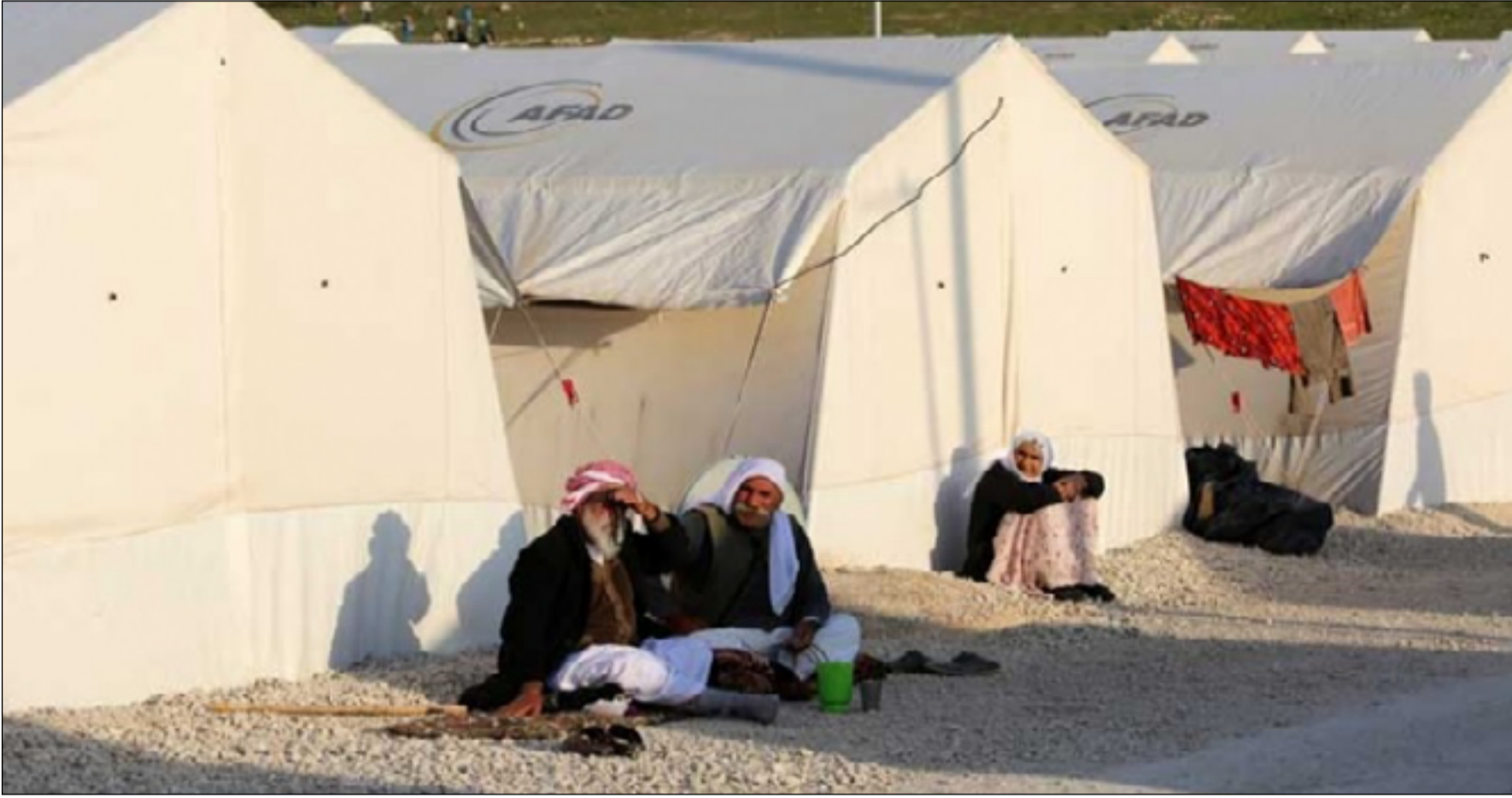
إيزيديون يجلسون أمام مخيماتهم في إقليم كردستان

يحتاجونها". وأشار تان، إلى أن "الخدمات الطبية تبقى هي الاحتياج الأولي لهؤلاء النازحين، ومع وجود الأطباء الأجانب هناك أطباء محلين أيضاً في المنظمة".