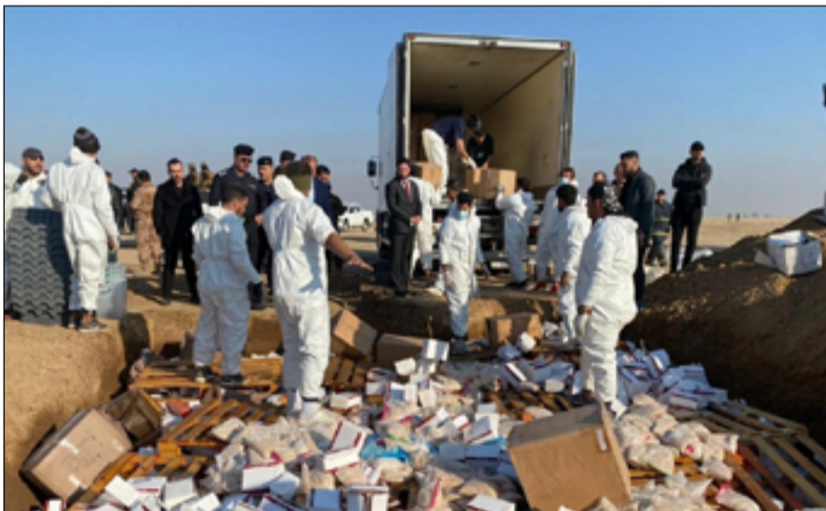
عمليات اتلاف المخدرات بحضور ممثلي جهات عدة

سياق مكافحة المخدرات". ومضى الحسنوي، إلى أن "الاتلاف سينعكس تأثيره الإيجابي ليس في العراق فحسب وإنما على مستوى الدول