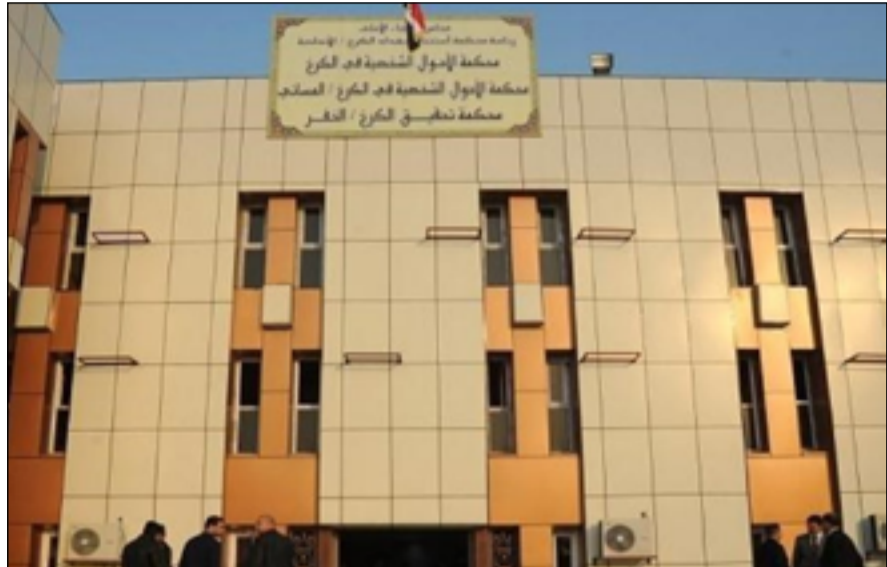
مبنى محكمة الأحوال الشخصية في الكرخ