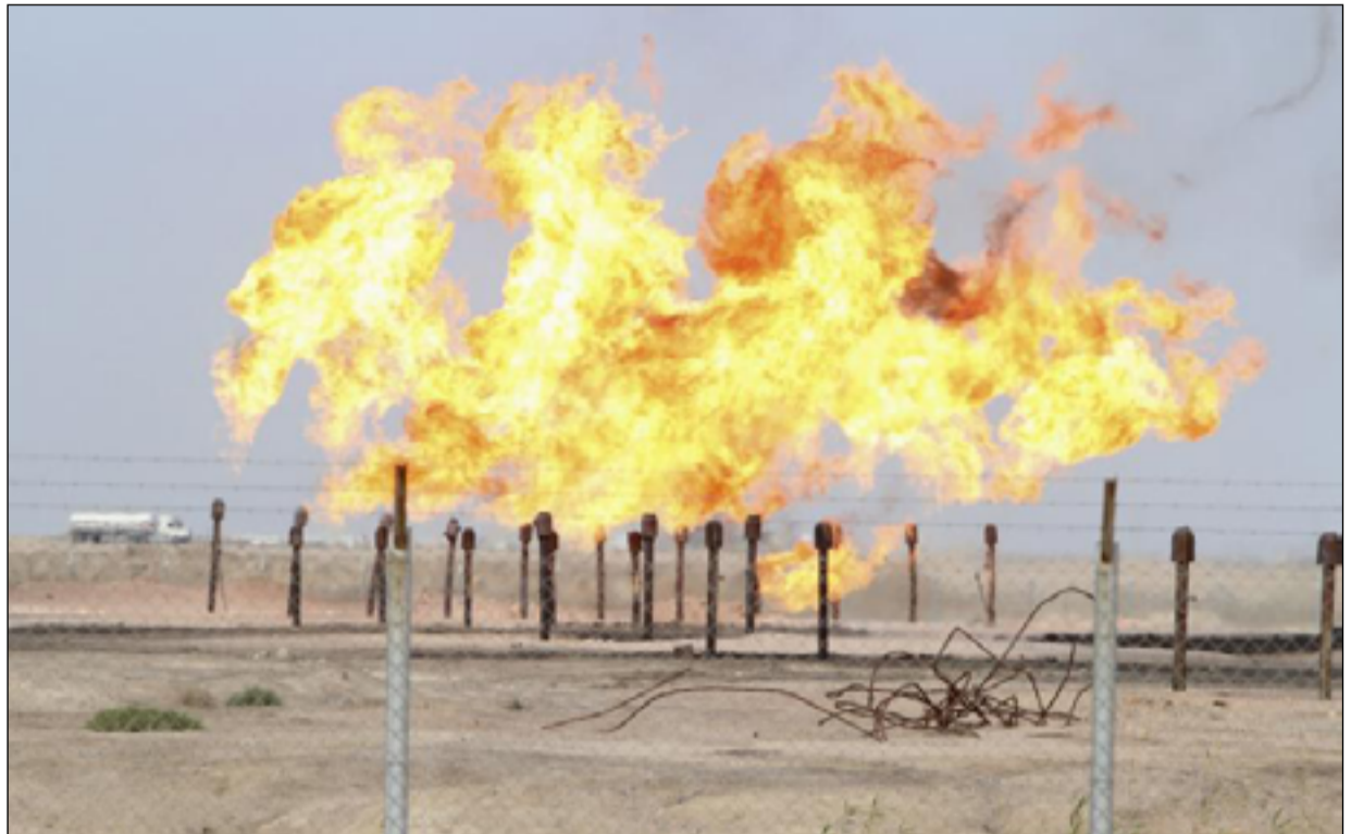
العراق ثاني بلد في العالم بحرق الغاز المصاحب بعد روسيا

كشف تقرير اقتصادي دولي عن حراك عراقي لاستغلال الغاز المصاحب وعدم هدره، لافتاً إلى أن هذا الإجراء سوف يساعد في حل الأزمة الكهربائية ويمكن أن يأتي بموارد مالية جديدة عبر تصدير الفائض منه. وذكر التقرير لواقع، (أويل برايس)، لأخبار النفط والغاز، أن "العراق ما زال يعتمد بنسبة 40% في تأمين احتياجاته من الطاقة الكهربائية والغاز المشغل لمحطات التوليد على إيران".