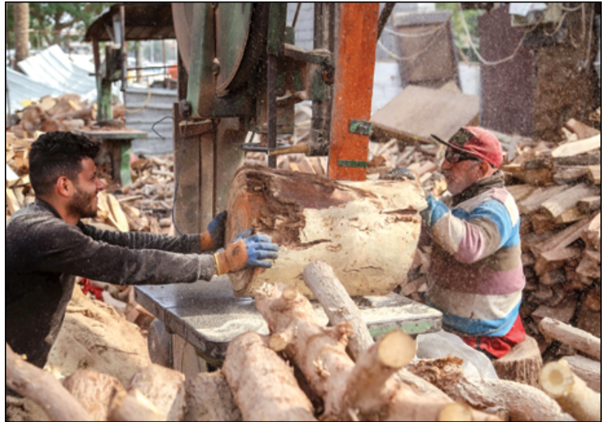
تقطيع الأخشاب مهنة لتخلو من المخاطر..

وقالت وزيرة الهجرة والمهجرين أيفان جابرو في تصريح للوكالة الرسمية للأنباء، إن "لجنة تم تشكيلها للحد من الانتحار لظهور أكثر من حالة في داخل