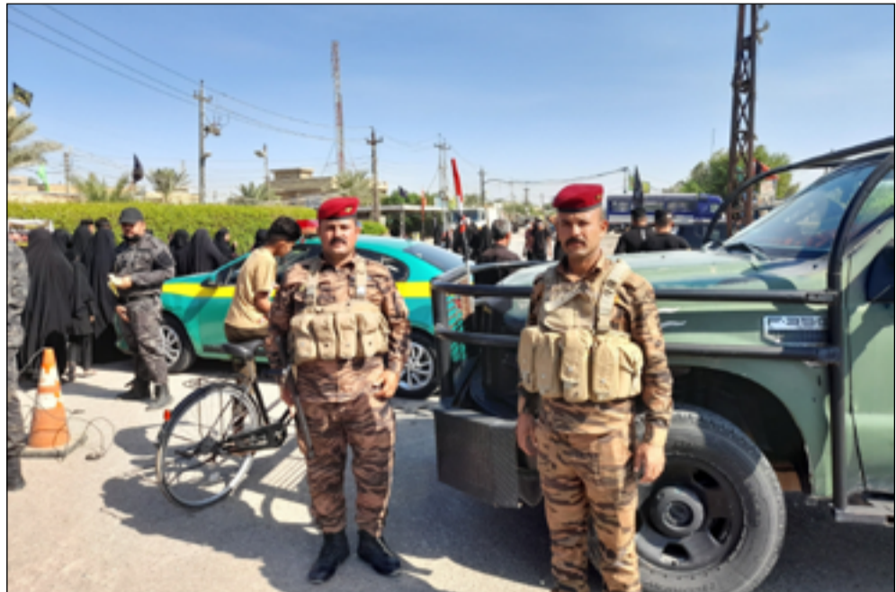
عنصران تابعان إلى وزارة الداخلية أثناء تنفيذ واجبات أمنية

وأضاف البيان، أن الضربة الجوية حصلت بناء على توجيه القائد العام للقوات المسلحة، وفقاً لمعلومات دقيقة من جهاز مكافحة الإرهاب.