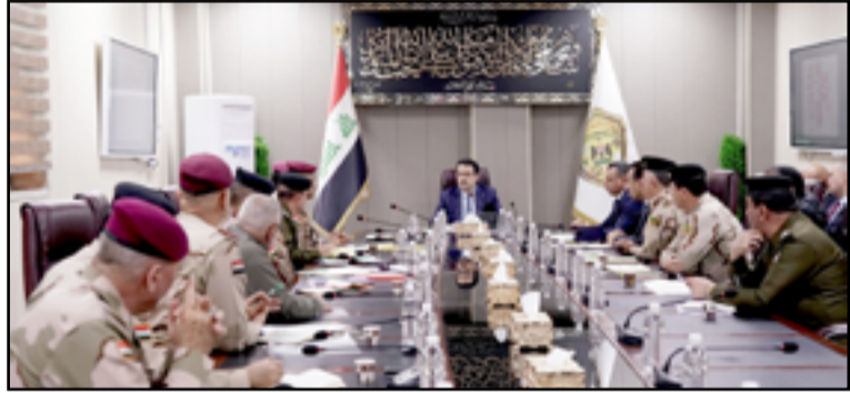
اجتماع السوداني مع القادة العسكريين أسس

الميداني في قواطع العمليات، وأن يكونوا قريبين من الضباط ومنتسبيهم، والعمل على رفع معنوياتهم العسكرية، والوقوف بشكل مباشر على الخطط والتنفيذ الميداني لها. ومضى الميداني، إلى أن «السوداني شدد على ضرورة التنسيق العالي بين الأجهزة الاستخباراتية، والتأهب العالي، والقيام بعمليات نوعية واستباقية ضد العدو أينما تواجد». من جانبه، ذكر المتحدث باسم مكتب القائد العام للقوات المسلحة يحيى رسول، في بيان تلقته (المدى)، أن «العمليات العسكرية المنفذة من قبل القطعات الأمنية في مختلف قواطع المسؤولية قصمت ظهر الإرهاب وقللت قيادته بضربات موجعة». وأضاف رسول، أن «هذه العمليات قابلتها أعمال جبانة من قبل عناصر عصابات داعش الإرهابية لن تمر من دون عقاب سريع من جانب الأجهزة الأمنية المعنية». وأشار، إلى «توجه وفد أممي رفيع المستوى إلى ديبالي لتابعة مجريات الاعتداء الغاشم الذي وقع منتصف الأسبوع الحالي». وأوضح رسول، أن «الوكالات والدوائر الاستخباراتية باشرت، بعمل مكثف للتوصل إلى العناصر الإرهابية التي أقدمت على ارتكاب هذا الحادث الإرهابي». ونوه، إلى «إعادة نشر القطعات الأمنية بحسب طلب أهالي المنطقة بعد زيارة الوفد الأمني لهم». ولفت رسول، إلى أن «تعزيزاً قد جرى للقاطع بكاميرات حرارية وأبراج مراقبة، ومسك مداخل ومخارج المنطقة». ومضى رسول، إلى أن «الأجهزة الأمنية المختصة تواصل تحقيقاتها في هذا الاعتداء، وأن الرد المناسب سيكون قريباً».