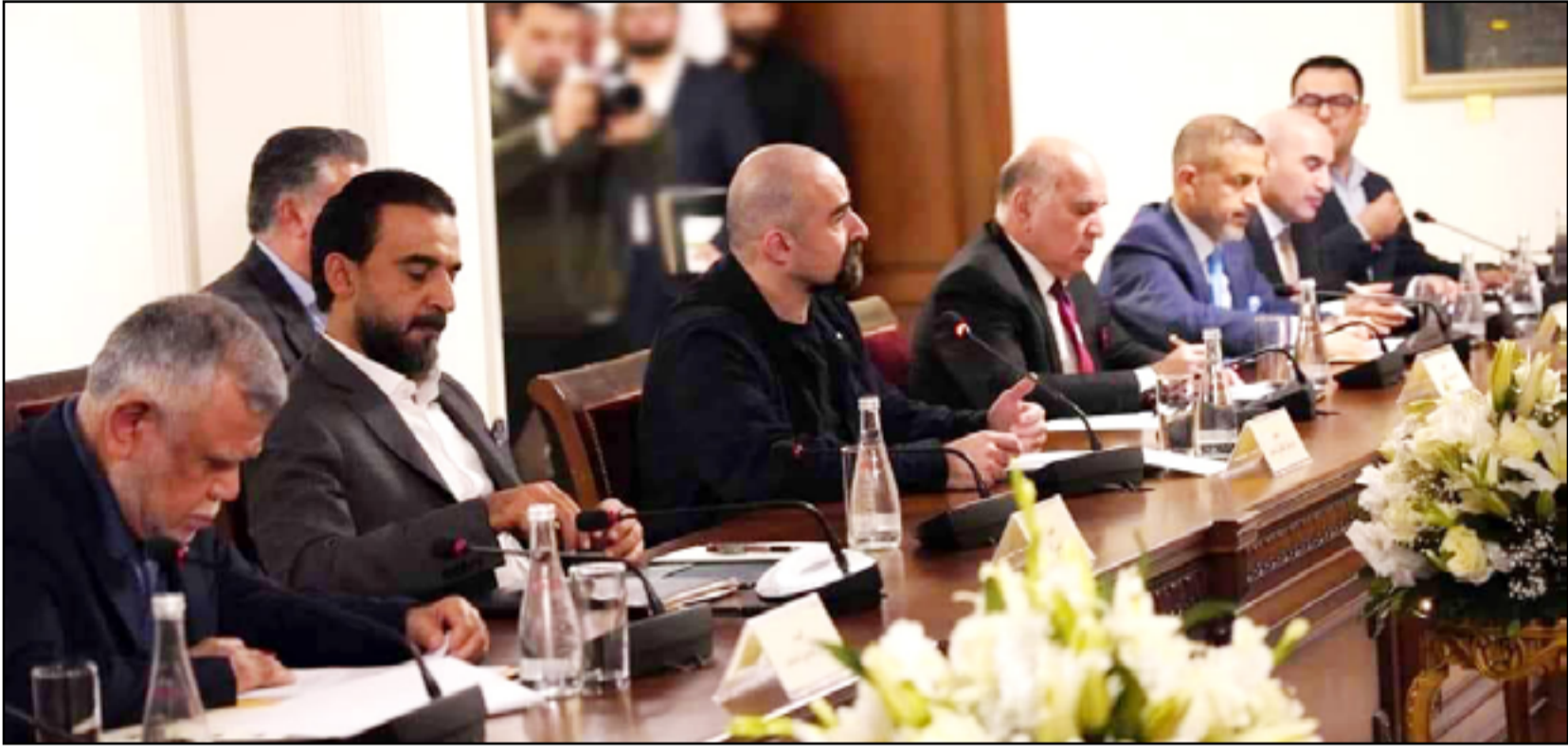
تحالف إدارة الدولة متفق على عدد من القضايا أبرزها تحول ملف الاجتثاث إلى القضاء

ووفق الكتاب المرسل من مكتب رئيس الوزراء إلى الهيئة، فإن الأخيرة عليها أن تقدم أسماء