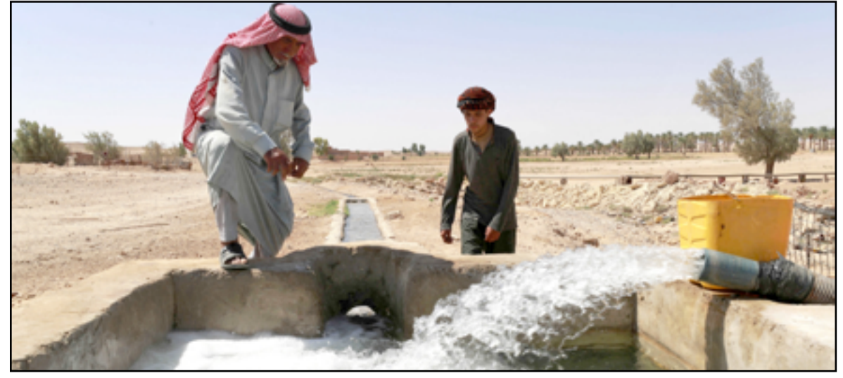
دعوات لتطوير وسائل الري للحفاظ على المياه

وأشار، إلى أن «الحكومات المتعاقبة لم تفعل شيئاً بشأن المياه، التي كانت في السابق بنحو متوسط وتكفي للحاجة في الزراعة ومساحات الأهوار».