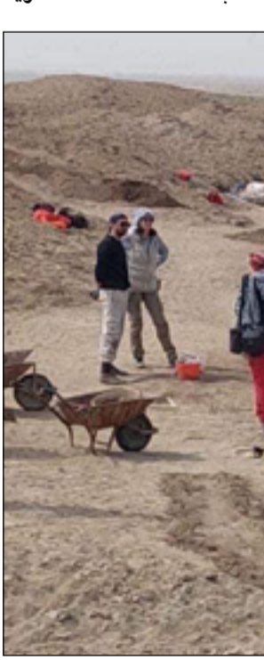
فيما أعلنت مفتشية آثار ذي قار في

وتحدث، عن اكتشاف قصر امارسي من العهد البابلي القديم في موقع لارسا خلال الموسم الفائت من قبل البعثة الفرنسية. وأفاد، ب اكتشاف 200 قطعة أثرية