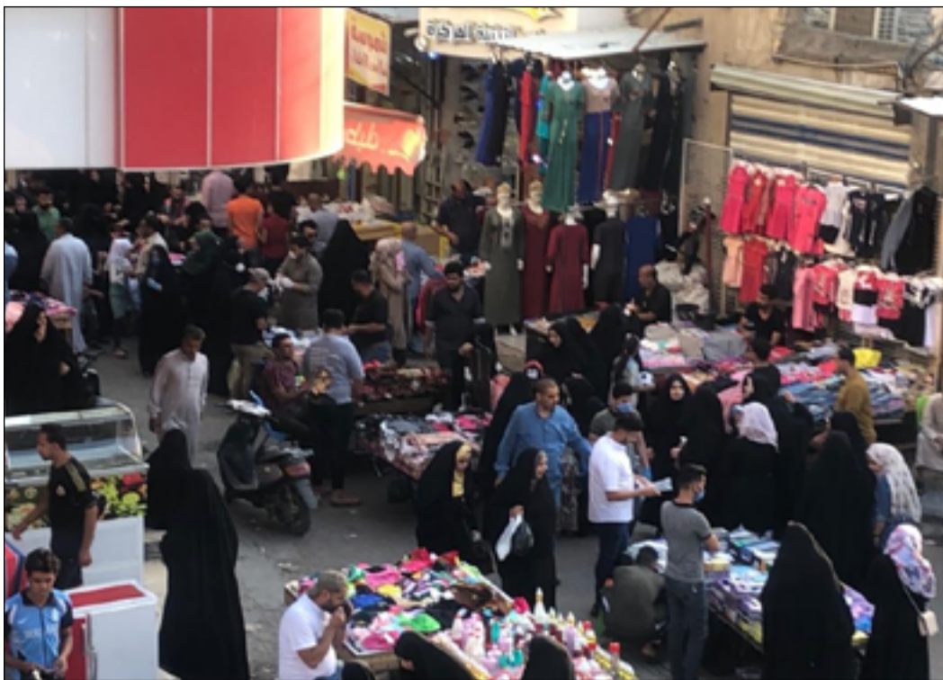
ركود في اسواق ذي قار بسبب غلاء الاسعار