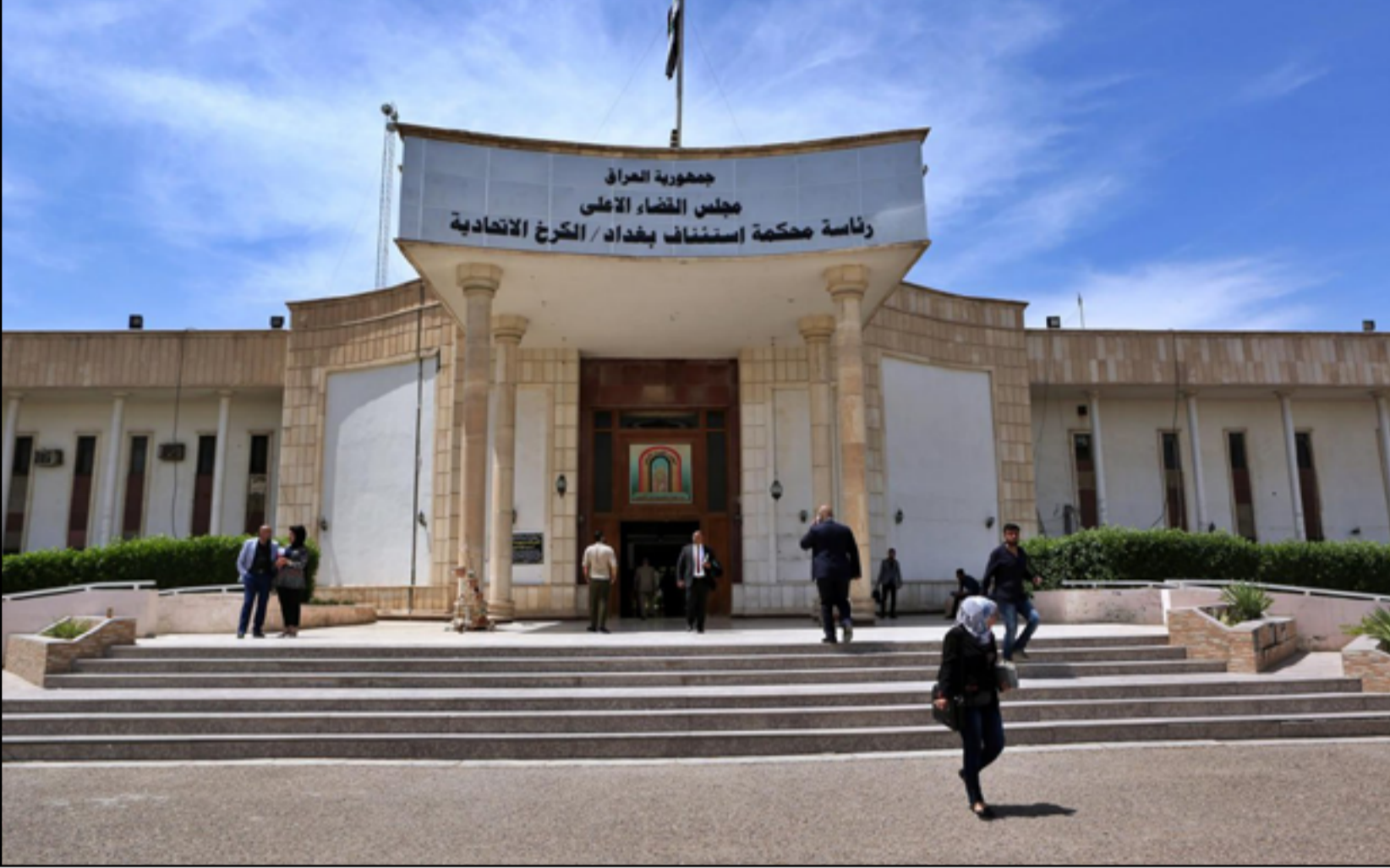
مبنى رئاسة محكمة استئناف الكرخ في بغداد

ويدخل في النظام الجديد الذي انشأه البنك الفيديري الامريكي داخل البنك المركزي نحو