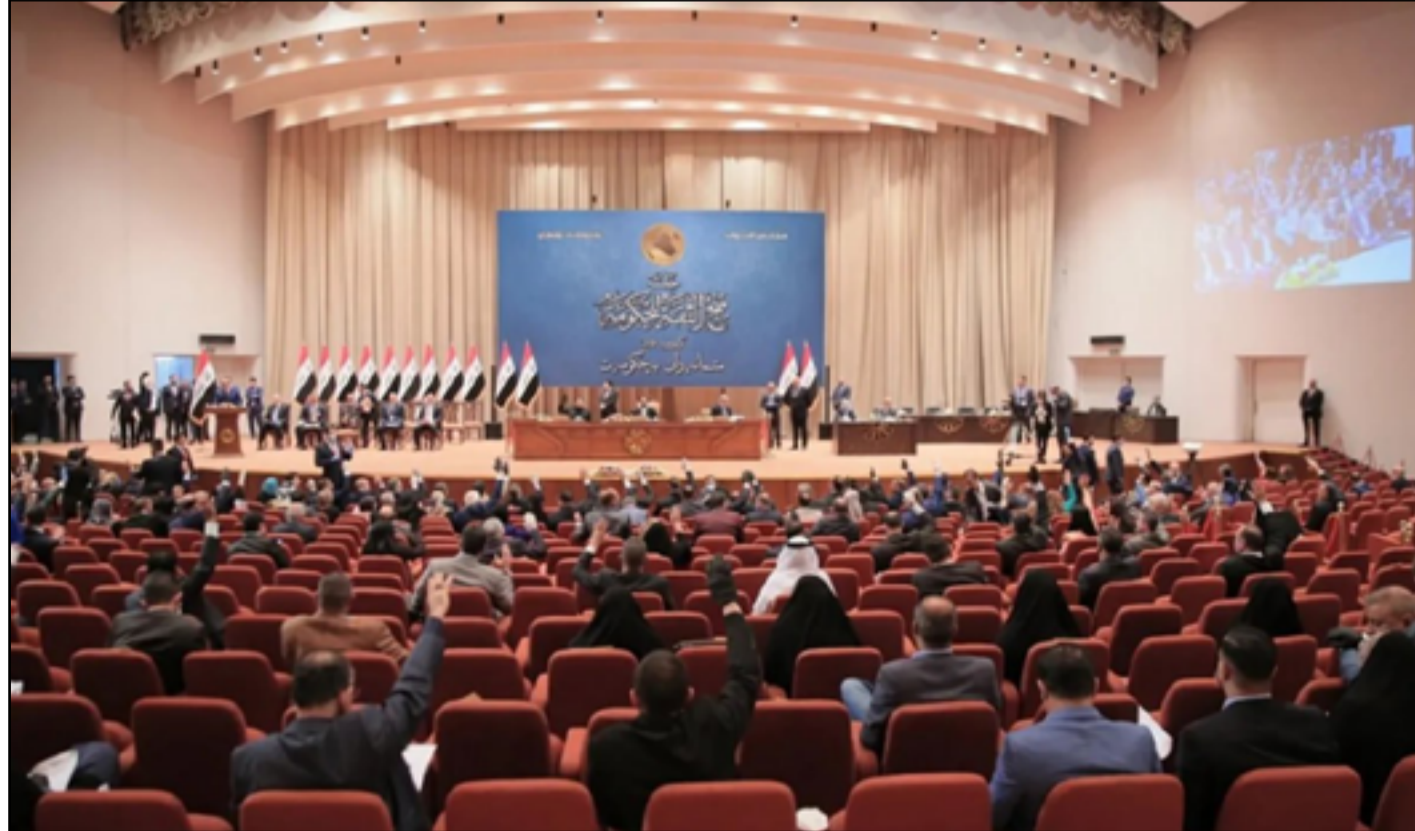
البرلمان يستأنف جلساته الاسبوع المقبل بمناقشة الموازنة

ويتفق مع الكاظمي، بأن «القانون سوف يتم التصويت عليه منتصف وتقديم الخدمات إلى العراقيين».