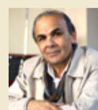
يرى المشتغلون في السينما أنّ صناعة الكتاب السينمائي تتطلب المأما نظرياً بهذه الفنون. لذا، لا غرابة أنّ ترى المنجز في هذا المضمار ضئيلاً، يقتصر على مجموعة محدودة من النقاد والباحثين السينمائيين.

أما عن إبحام على الكتاب السينمائي من دور النشر فإنّ القارئ يُمكن أن يتذكّر النقاد جميعهم، من دون أن ينسى أحدهم، لقلة عددهم وكثرة ظهورهم في الصفحات السينمائية في صحف ومجلات عراقية وعربية. أما الباحثون السينمائيون فهم أكثر عدداً وأقل ظهوراً. النقاد ينتجون كتباً سينمائية مقروءة، لأنها خفيفة الظل، وهي عموماً مراجعات وتحليلات لأفلام وظواهر سينمائية سهلة الهضم، بينما ينتج الباحثون كتباً سينمائية نظيرية، تستجيب لمتطلبات البحث العلمي، لكنها تستعصي على القارئ العادي الذي يبحث عن أشياء يسيرة وقابلة للفهم والإستيعاب. ولعلنا هنا نشير الى الدور الذي قامت به «المؤسسة العامة للسينما»، التابعة لوزارة الثقافة السورية، التي أصدرت عدداً من المصائر السينمائية التي أثرت المكتبة، ورضت الدرس الأكاديمي، وغيّرت من مسارات التفكير البحثي. كما أنه لا يُمكن تناسي الدور الكبير لجهود «المركز القومي للترجمة» في مصر، الذي قدم أهم الموسوعات السينمائية، التي جعلت الباحث العربي يفتّح على إعادة قراءة تاريخ السينما، ونظرياتها واتجاهاتها وأساليبها الفنية، بوعي معاصر.