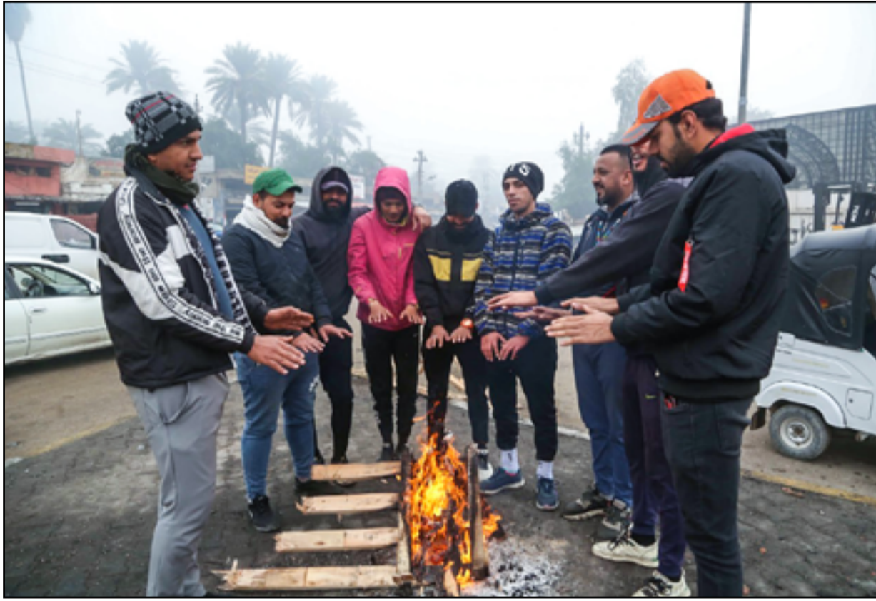
سانقو عجلات تكثك يتجمعون حول شعلة للنار بسبب انخفاض درجات الحرارة في بغداد