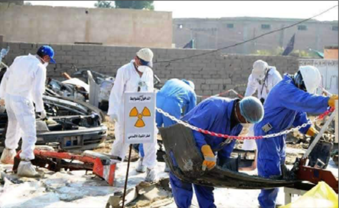
عناصر من فرق ازالة الانغام في ذي قار

وفي ذات السياق أعلنت شرطة ذي قار عن إصابة امرأة وطفلة بجروح إثر انفجار لغم أرضي من المخلفات الحربية في مناطق البادية الجنوبية. وقال مصدر في الشرطة في تصريح لوسائل الإعلام المحلية تابعته (المدى)، إن "لغماً أرضياً من مخلفات الجيش السابق، انفجر في منطقة ابو غار جنوبي الناصرية واصاب امرأة وطفلة بجروح مختلفة". وأكد المصدر، "نقل المصابين الى المستشفى لتلقي العلاج، ومباشرة الجهات الامنية المختصة بالتحقيق في الحادث".