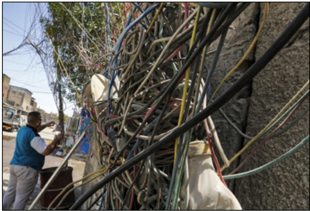
العراقيون يعتمدون على المولدات الأهلية في سد أغلب احتياجاتهم من الكهرباء