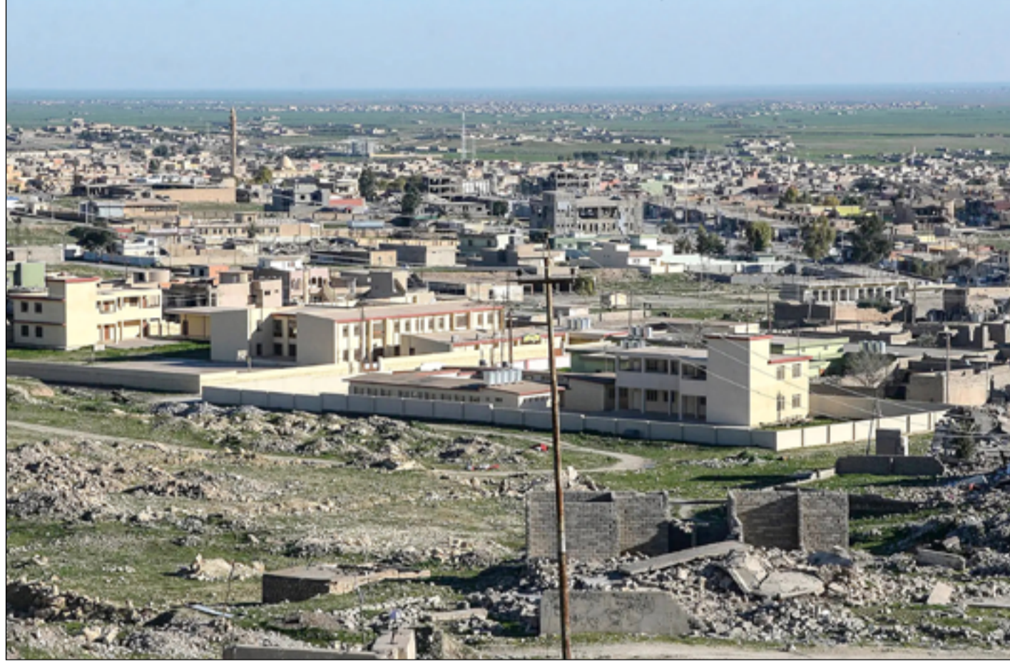
اهالي سنجار ينتظرون العودة إلى منازلهم رغم مرور سنوات على هزيمة داعش

دعمهم المستقبلي نحو رئيس الوزراء الجديد محمد شياع السوداني". وبين، أن الولايات المتحدة، باعتبارها شريكا استراتيجيا لها دور أيضا تلعبه لتشجيع العراق على الإسراع بتكثيف جهوده لتحسين الحريات الدينية لجميع الطوائف من الأقليات الدينية لا سيما الإيزيديين. "هناك القانون حظي باهتمام عالمي كونه أول قانون يوفر تعويضات ودعم لضحايا الحرب والاستعباد الجنسي في العراق والذي