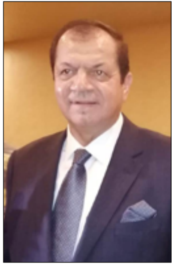
بغداد / المدى

لم نر اللمسة الإسبانية بعد.. ودعوتي للبصرة جاءت متأخرة!