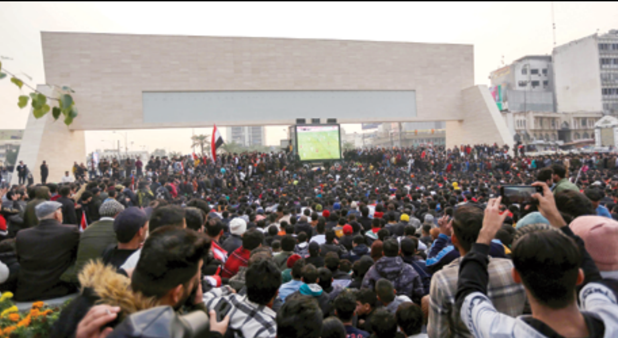
جمهير غفيرة تتابع المباراة في حديقة الامة..