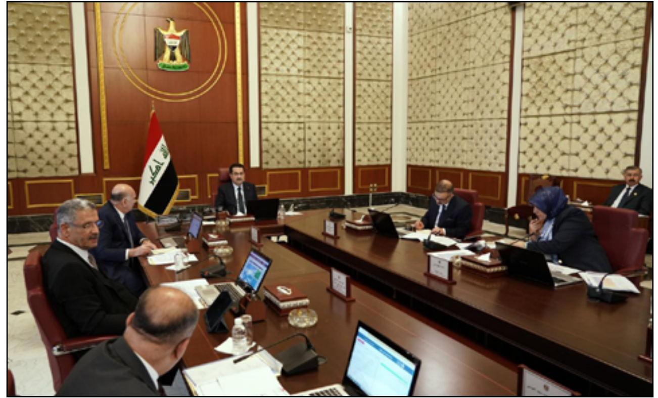
اجتماع سابق لمجلس الوزراء

وانتهى البيان إلى أن "هذا القرار ينفذ بدءاً من 1 حزيران 2023".