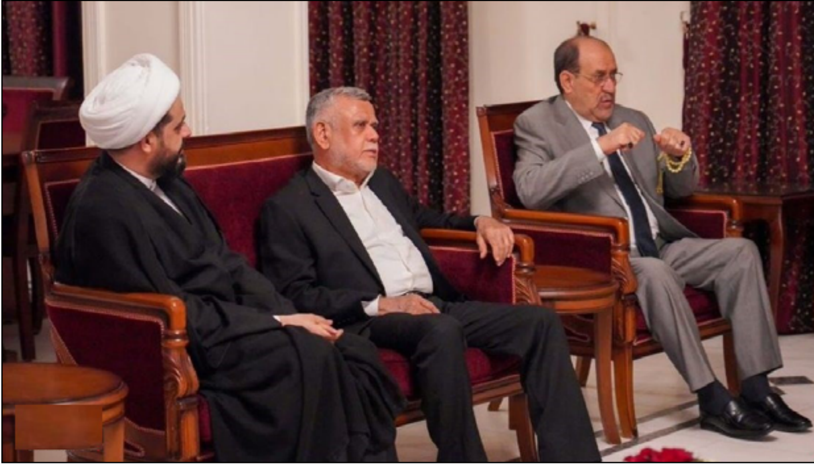
خلافات كبيرة بين قادة الأطر التنسيقي

وبين المسؤول ان "فرنسا تريد ان يساعد العراق في دفع طهران للحوار بشأن الأوضاع في سوريا وعن الأزمة الأوكرانية باعتبار