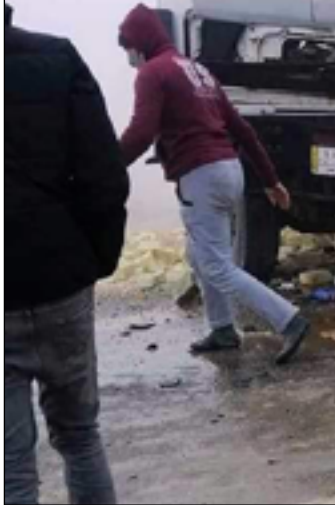
اثار حادث مروري على الطريق الخارجي في ذي قار قبل يومين