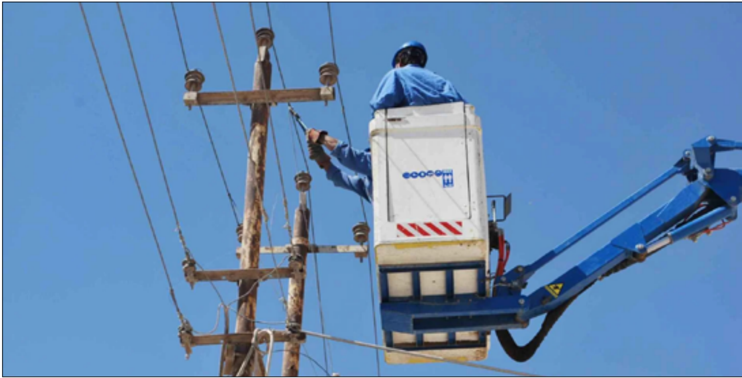
من أعمال الصيانة على شبكات التوزيع

وزاد، أن "الربط مع الخليج بلغ مراحل مهمة، بإنجاز خط (فاو - فلوس) رقم (١) وخطوط المعلمين ومحطة الفاو