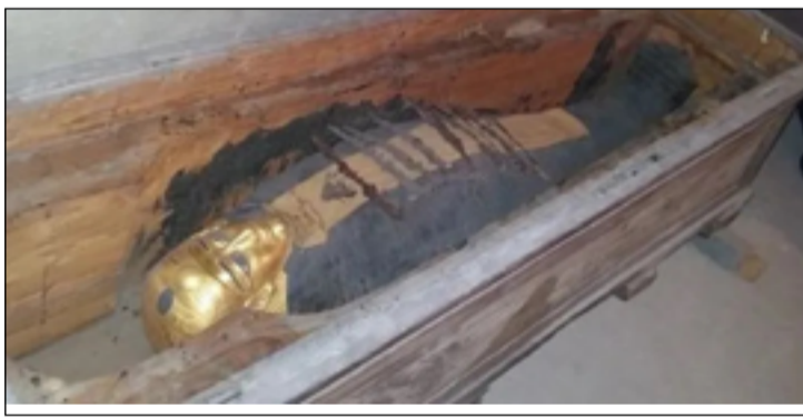
المقطعية للسماح لهم بفحص الموميوات من الداخل دون فك غلافها. حلقة ولسانا ذهبيا داخل فمه. واستخدمت سليم ورفيقها الأشعة

وقدرت الدراسة أن الصبي كان يبلغ من العمر حوالي ١٤ أو ١٥ عاماً، بناءً على درجة الالتحام العظمي وغياب ضرس العقل في فمه. ووضعت المومياء داخل تابوتين، أحدهما خارجي عليه نقش يوناني، وتابوت آخر خشبي داخلي، بينما كان يرتدي الفتى قناع رأس مذهبا، وعلبة كرتونية صديرة تغطي الجزء الأمامي من الجذع، تمت إزالة الأحشاء، بينما تم استئصال الدماغ عبر شق الأنف، وتمثل هذه المومياء صورة حية لما كانت عليه المعتقدات المصرية حول الموت والعالم الآخر خلال العصر البطلمي.