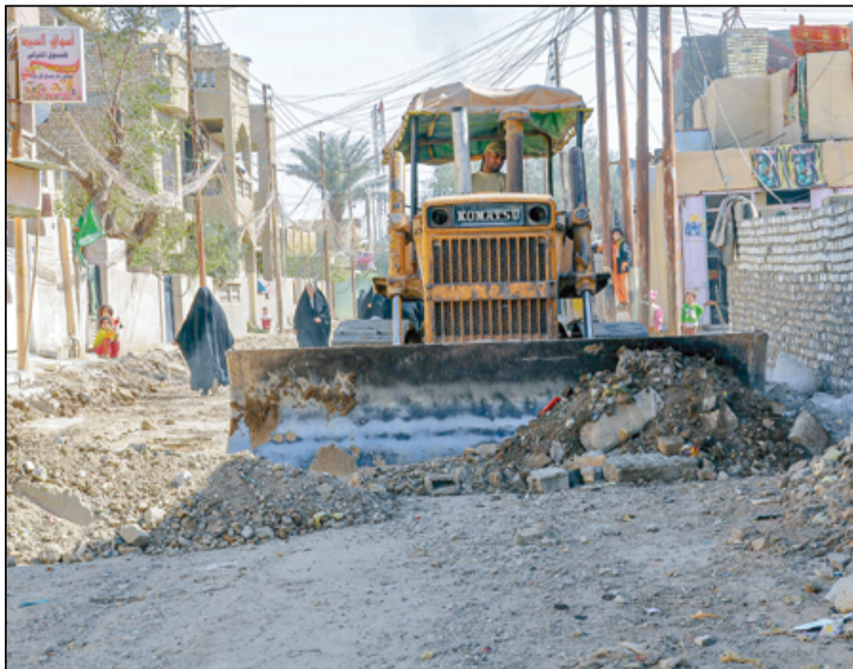
محلات اكساء الشوارع مستمرة في أطراف العاصمة..

تحويلات الدولار من العراق، في وقت نفت فيه سفيرة الأخيرة في بغداد 'إلينا رومانوسكي' مسؤولية بلادها عن تحديد أسعار صرف الدولار. في غضون ذلك بحث الائتلاف الحاكم 'إدارة الدولة'، الإجراءات التي اتخذتها الحكومة مؤخرا لمواجهة أزمة ارتفاع سعر صرف الدولار. وذكر بيان للائتلاف أن الأخير: 'عقد اجتماعا مساء اليوم (الاثنين الماضي) في مكتب