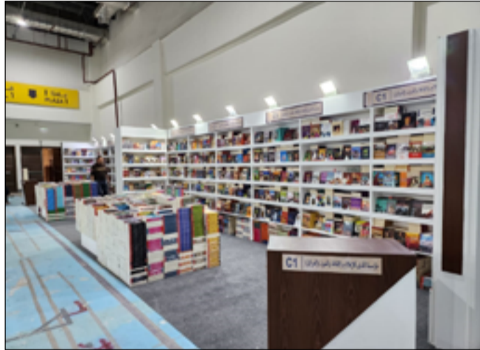
التجمع الخامس في القاهرة، ويستمر لغاية السادس من شباط القادم. وكانت اللجنة العليا المنظمة لمعرض الكتاب، قد اختارت الشاعر صلاح

وعن سعر الكتاب وعلاقته بمدى إقبال الزوار على الشراء، أوضح أن سعر الكتاب غالبا ما يميل إشكالية كبيرة لدى العارضين في ظل الظروف الاقتصادية الصعبة، مؤكداً أنه رغم قيام دار المدى بعمل تخفيضات كبيرة جداً تصل إلى سعر التكلفة، إلا أن الملاحظ جداً هو أن القارئ لا يزال يعاني كثيراً عند شراء الكتاب. وحول مدى تعاون الجهات المصرية مع العارضين أشار مسؤول الجناح إلى أن الجميع في مصر متعاونون في كل شيء سواء ما يتعلق بتوفير التاشيرات أو تأمين الأجنحة والصالات. وكان المعرض قد افتتح أمس في مقر مركز مصر للمعارض الدولية في