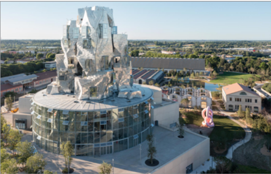
برج لوما أرال (2021)، أرال / فرنسا، المعمار: "فرنك غيهرى"، منظر عام.

ينحو فرنك غيهرى نحو ا واضحا في صياغة لغة مبناه التصميمية، عن طريق تأكيد خصائص مقاربته المعمارية التي عرف بها، فهو، هنا في "مركز لوما"، يميل الى استخدام "التضاد" بين مفردات التصميم التي اجترحها مع البحث في اصطفاء "فورم معماري ليس فقد مثيرا في هيئته وإنما فريدا في شكله وغير تقليدي في اسلوب إكساء واجهاته لتحقيق حضور الأنشءاه" لدى متلقي مبناه وإبهارهم. في مركز لوما تتبدى تلك الخصائص التصميمية جليا، فنرى تناقض حضور هيكـل "طلبة" الكتلة الاسطوانية الزجاجية مع كتلة السالام والمصاعد ذات الشكل الهندسي المنتظم مع جسم كتلة المركز الرئيسية المجدعة لتضيف بعدا مثيرا زائدا لغورم ذلك الجسم المذهل والفريد الذي اجترحه المعمار عبر استخداماته الواسعة لتقنيات البرامج الحاسوبية المعاصرة.