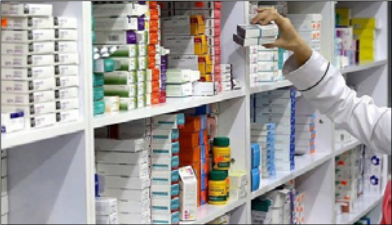
اهتمام حكومي كبير بملف الادوية

وأشار، إلى أن "من سياسات وزارة الصحة الجهات المعنية وأهمها نقابة الصيادلة".