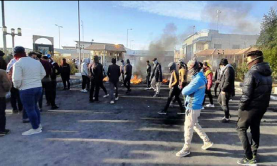
متظاهرون في الناصرية

وكان تجار ومواطنون كشفا عن نداعات خطيرة على قوت وحياة الشرائح الفقيرة ومحدودي الدخل ناجمة عن ارتفاع سعر