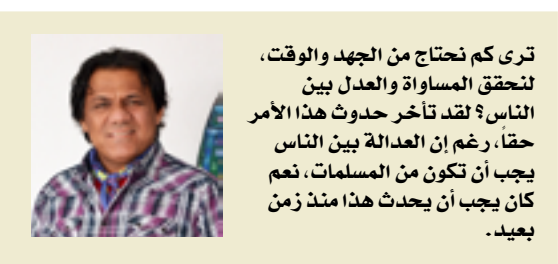
تري كم نحتاج من الجهد والوقت، لتحقيق المساواة والعدل بين الناس؛ لقد تأخر حدوث هذا الأمر حقاً، رغم إن العدالة بين الناس يجب أن تكون من المسلمات. نعم كأن يجب أن يحدث هذا منذ زمن بعيد.

لكن وسط كل هذا، لا يمكننا إغفال بعض التقارير التي أخذت طريقتي الى قلوب الكثيرين، وهذا ما نراه الآن في سعي الكثيرين للإختلاط بأعداء غير مسبوقة مقارنة بالماضي، الذي كانت فيه كل طائفة تنزوي مع بعضها، وكل عرق ينطوي على نفسه وكان بذلك خلاصهم الأكيد. نعم لقد ظهرت الآن أجيال من الناس، يتنمون الى بلدان وقارات مختلفة، وهؤلاء سيتكاثرون بالتأكد. وربما سنرى بعد سنوات طويلة جدا طبعاً، إن الناس بدأوا يتقاربون من جديد، بعد أن خرجوا من أفريقيا قبل ٢٠٠ ألف سنة، وطالت ملامحهم وألوانهم التغيرات بسبب الظروف أو بعض الطفرات الجينية. نعم ينبغي على الناس العودة الى بعضهم، وربما ينحتم علينا الإنتظار طويلاً لنرى الناس يتقاربون أكثر وأكثر، ويكادوا أن يكونوا عرقاً واحداً هو الإنسان، في عالم لا عد فيه ولا سيد، دون فوارق أو طبقات. أمضي بتأملاتي أكثر، وأتخيل الناس بعد قرون وهم يشكلون مع بعضهم لوحة فسيفساء مذهلة ومتكاملة وباهرة الجمال.