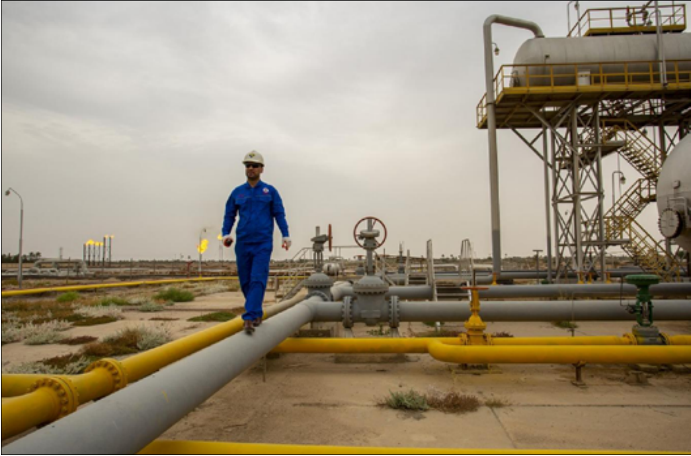
تحذيرات من الاعتماد على النفط فقط في الإيرادات العامة للموازنة

ذلك تتراجع نسبة التضخم أكثر خلال العام ٢٠٢٤ عند ٢,٥٪". وأكد، أن "الاقتصاد العراقي مر بمرحلة تعافي على نحو تدريجي وكان ذلك مدعوما بعوائد نفطية عالية وسياسات ملائمة وان التطلعات