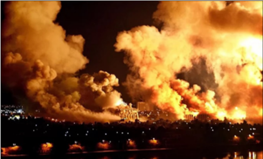
القصف الأميركي للقصر الجمهوري في بغداد