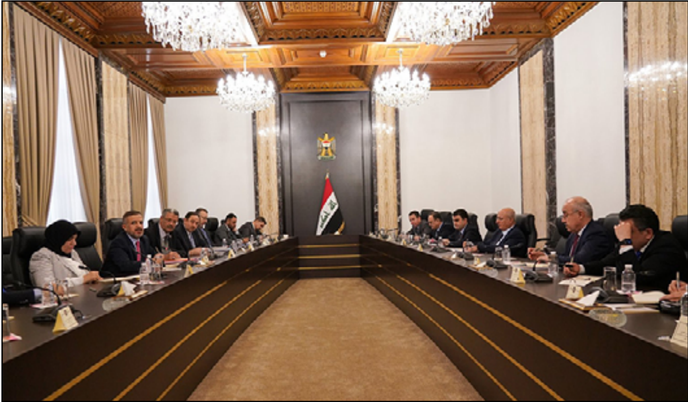
لقاء سابق بين مسؤولي الحكومة الاتحادية وحكومة إقليم كردستان