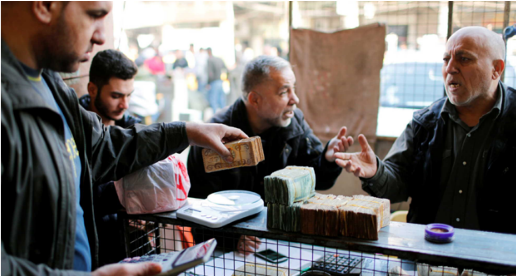
أزمة الدولار في العراق تأخذ أبعاداً دولية

وشدد على أن السلاح الذي حصل العراق عليه بعد إتمام الصفقة بالشكل المناسب «أسهم بشكل كبير في الانتصار على داعش في وقت بقي العالم متفرجا على ما حصل» وفقا لبيان للمالكي.