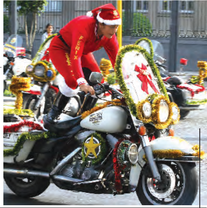
شروطية مرور من البرو توندي زي بابا نويل على دراجتها في احد شوارع العاصمة كيما