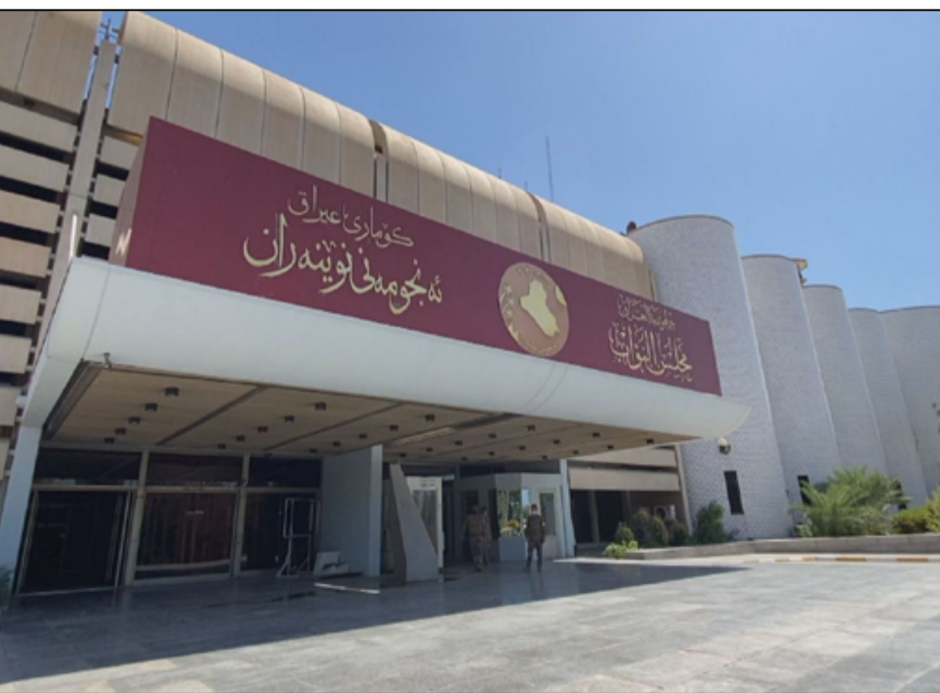
مبنى مجلس النواب في المنطقة الخضراء

اقليم كردستان ينبغي حلها من خلال الشفافية المطلوبة من خلال الاطلاع على صාරات والنفط والاموال المستحصلة وهو ما تطلبه وزارة النفط والحكومة الاتحادية باعتبار أن تصدير النفط العراقي ينبغي ان يحصل تحت اشراف السلطات الاتحادية». ويرى، أن «عدم هذا الخلاف يعني