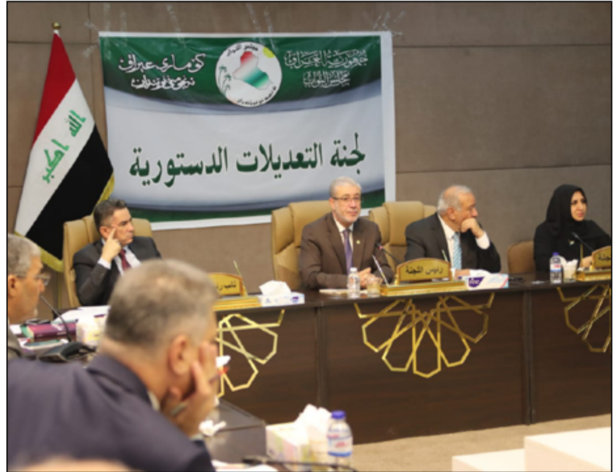
من اجتماعات لجنة التعديلات الدستورية في البرلمان السابق

وبحسب ما يتم تداوله ان التعديلات الجديدة ستشمل مواد تسببت فيما عرف بـ "الانسداد السياسي" عقب الانتخابات التشريعية الاخيرة. وأبرز المواد ستكون تلك المتعلقة بالكتلة الفائزة، وانتخاب رئيس الوزراء، واخرى بالحكومات المحلية. وعرض مستشار رئيس الوزراء للشؤون الدستورية حسن الياسري، على رئيس الجمهورية قبل ايام، مشروع رئيس الوزراء محمد شياع السوداني لتعديل الدستور. وقال المكتب الاعلامي لرئيس الجمهورية الاسبوع الماضي ان الاخير: "استقبل مستشار رئيس الوزراء للشؤون الدستورية حسن الياسري، وخلال اللقاء عرض الياسري مشروع رئيس الوزراء لتعديل الدستور على الرئيس بغية التنسيق والتعاون بين الرئاستين لتبني المشروع".