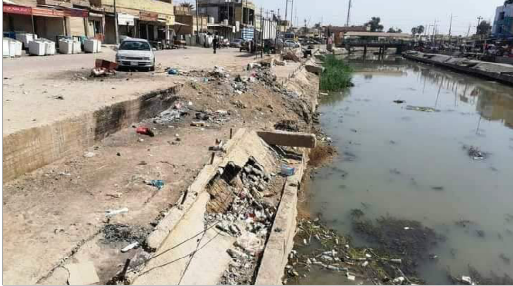
نقص كبير في الخدمات يعاني منه قضاء الغراف في ذي قار

رصينة مع عدم وجود المراقبة من قبل دائرة المهندس المشرف على التنفيذ او المهندس المقيم". ويأمل البيان، بأن "يتم النظر بعين المسؤولية والالتفات الى تقديم الخدمات من خلال المتابعة او إجراء الزيارات الميدانية لأحيائها البائسة التي تعاني الحرمان من ابسط مقومات التحضر والمدنية". وحذر، من "لجوء الأهالي الى المطالبات العلنية من خلال التظاهرات التي كفلها الدستور والتشديد الإعلامي لما له من