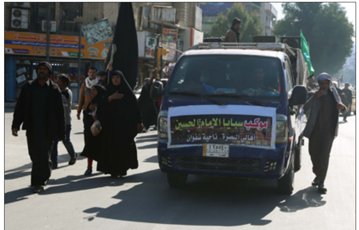
زوار من البصرة في طريقهم الى الكاظمية

وتابع أنه "بلغ عدد الدرجات المصادق عليها لهذا اليوم بالإجمال (١٠٤٠) درجة وظيفية، ليكون عدد المتعيينين لغاية الآن (٧٤٢٤) متعييناً ومتعينة،