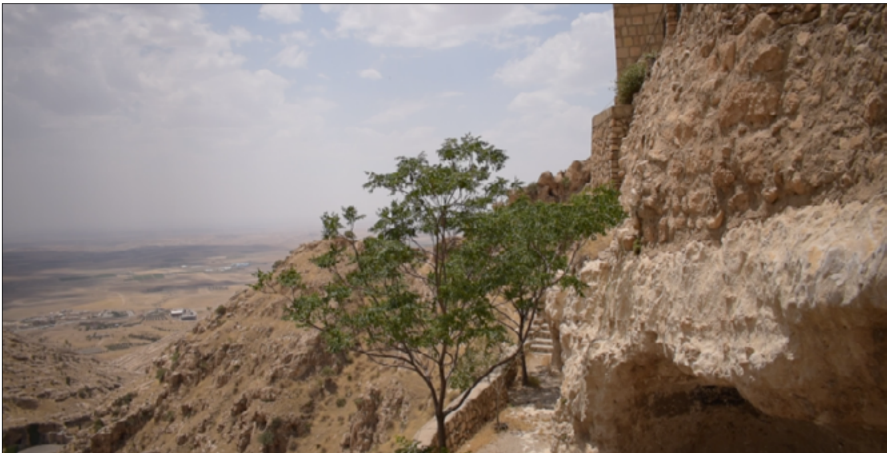
مناطق سهل نينوى تعاني من تصحر واضح بسبب الجفاف

من أجل الحصول على مصدر عيش في الوقت الذي تركت اغلب تلك العوائل أراضيها متوجهة لمراكز المدن بحثاً عن عمل في قطاعات أخرى". وتحدث، عن "أثار التغير المناخي على القلق النفسي ومخاوف الأهالي من المستقبل والذي يجب عدم تجاهله".