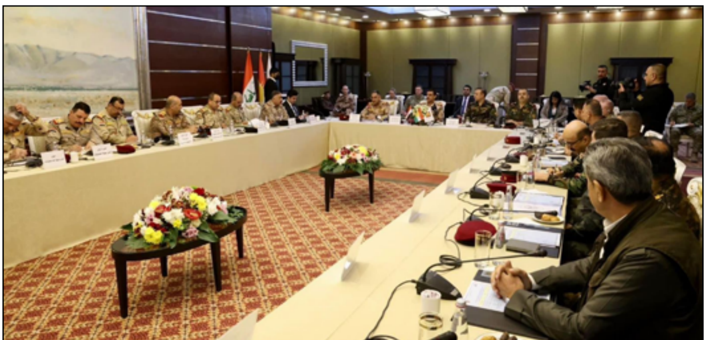
اللقاء بين العمليات المشتركة والبشمركة في أربيل أمس الأول

وتحدثت المصادر المطلعة إلى (المدى)، أن «وقداً أميناً برئاسة رئيس أركان الجيش الفريق أول ركن عبد الأمير يارالله ونائب قائد العمليات المشتركة الفريق الركن قيس المحمداوي وقائد القوات البرية الفريق الركن قاسم الحمدي وصل إلى أربيل أمس الأول». وأضافت المصادر، أن «الوفد عقد اجتماعاً يناقش فيه مستوى التنسيق الأمني والاستخباري بين قوات الحكومة الاتحادية وقوات البشمركة الأولى لقيادة قوات حرس الحدود كما أنها تعمل في الجانب الآخر مع البشمركة من خلال تشييد أبراج مراقبة ونصب كاميرات في الخط الصفري بحسب التوجيهات الصادرة من القائد العام للقوات المسلحة محمد شياع السوداني».