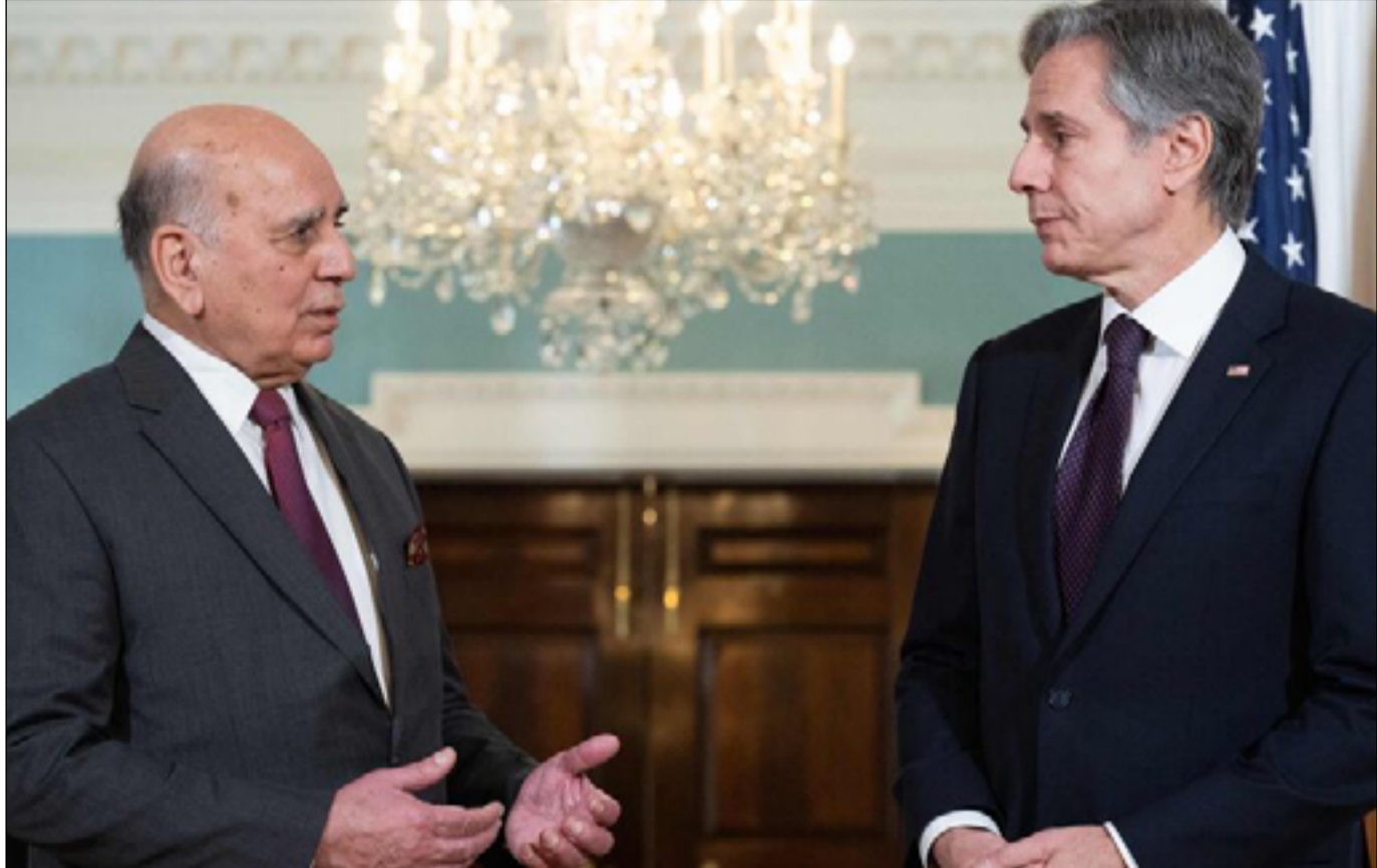
وزير الخارجية فؤاد حسين مع نظيره الاميركي

حسين في واشنطن على رأس وفد عراقي للولايات المتحدة يضم محافظ البنك المركزي بالوكالة علي العلق وذلك في اول لقاء من نوعه للجنة التنسيق العليا لاتفاقية الاطار الاستراتيجية المشترك بين الولايات المتحدة والعراق التي ستركز على الجانب الاقتصادي. وليس مستغربا ان تكون ايران مدرجة ضمن ورقة الاعمال.