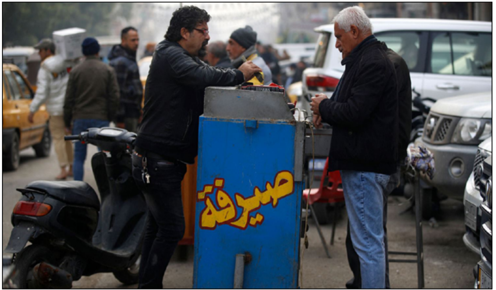
الحلول ما زالت غير كافية لاحتواء ارتفاع سعر الدولار في السوق الموازي

مع الولايات المتحدة. وقال النجار في تصريح للتلفزيون الرسمي ان زيارة الوفد الاخيرة الى واشنطن "تهدف لوضع أسس جديدة للتعاون مع الولايات المتحدة"، مبيئة ان "جزءاً واحداً من الاتفاقية