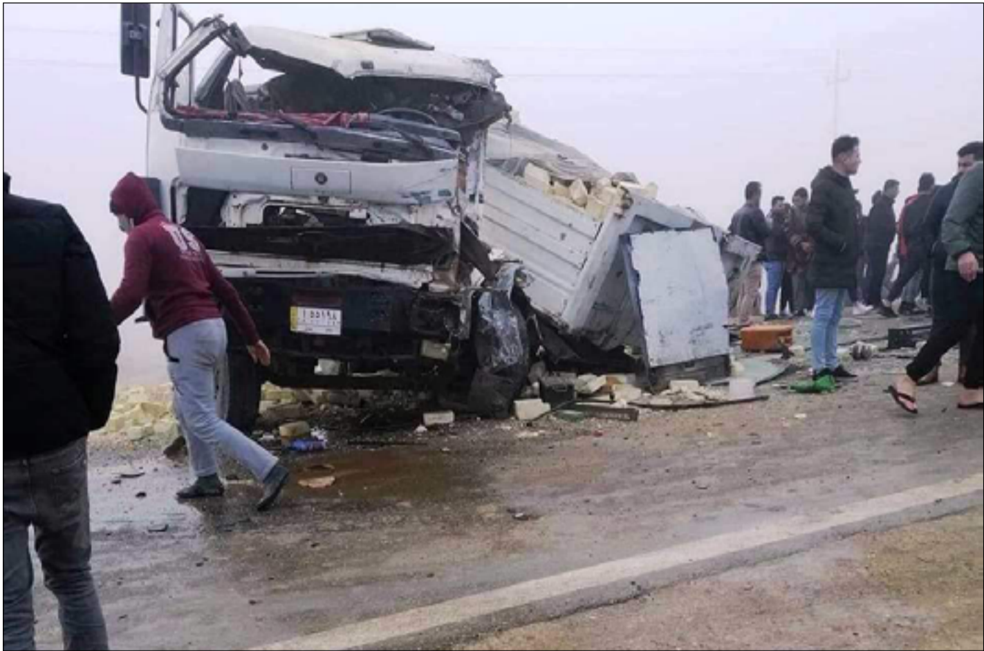
إحدى حوادث السير في الناصرية

كشفت البيانات الرسمية عن تسجيل 900 حالة وفاة واصابة ناجمة عن الحوادث المرورية خلال عام 2022 تتوزع بواقع 217 حالة وفاة و683 اصابة، وفيما عزت مصادر مرورية اسباب الحوادث الى السرعة الشديدة وعدم الانتباه والاجتياز الخاطى وعدم توفر شروط المتانة والامان، دعت الى اعادة العمل بمنظومة مراقبة الطرق الخارجية التي تعطلت منذ عام 2018.