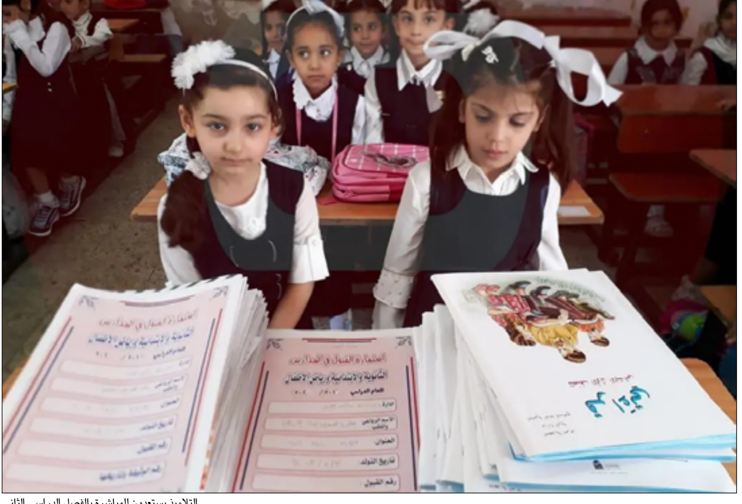
التلاميذ يستعدون للمباشرة بالفصل الدراسي الثاني

تحمل معالجات وحلولاً، عبر صندوق العراق للتنمية وبمشاركة القطاع الخاص". وأشار، إلى "عزم الحكومة على مواجهة الفقر متعدد الأبعاد، من خلال تنفيذ قانون منحة التلاميذ للعوائل الفقيرة المشمولة بالحماية الاجتماعية". ومضى السوداني، إلى "إمكانية معالجة جميع المشاكل الحالية، بالتنسيق والتعاون الوثيق بين السلطتين التنفيذية والتشريعية". أعلنت رئاسة مجلس النواب في وقت سابق عن انتخاب النائب سعاد الوائلي رئيسا للجنة التربية النيابية والنائب محمود القيسي نائبا اول والنائب نادية العويدي نائبا ثانيا. وكان وزير التربية إبراهيم نامس الجبوري، قد تحدث في وقت سابق عن إعادة العمل في بناء المدارس ضمن مشروع القرض الكويتي. وقالت الوزارة في بيان ان "وزير التربية إبراهيم نامس الجبوري عقد اجتماعا موسعا ضمّ الفريق الهندسي المشرف على مدارس القرض الكويتي لمناقشة أسباب توقف بناء 34 مدرسة ضمن الصندوق الكويتي للتنمية". وقال الجبوري ان "هذا المشروع الاستراتيجي يُعد من الركائز الأساسية التي تسهم في حلحلة مشاكل الأبنية المدرسية، لذا نحن اليوم نضع الانطلاقة الأولى في إعادة بناء 12 مدرسة، تمت معالجة المعوقات التي تعترض إنجازها". وشدد، على ضرورة "تقليل المدة الزمنية المخصصة لعملية البناء بمضاعفة الوقت وتكثيف الجهود لتصعيد وتيرة العمل في إكمال الصروح التربوية من أجل رفع الضغط عن المدارس التي تتضمن دواما مزدوجا". ومضى الجبوري، إلى "متابعة سير العمل خطوة بخطوة، وستشهد الأيام القليلة المقبلة المباشرة في المرحلة التالية من أجل إكمال 22 مدرسة جديدة أخرى".