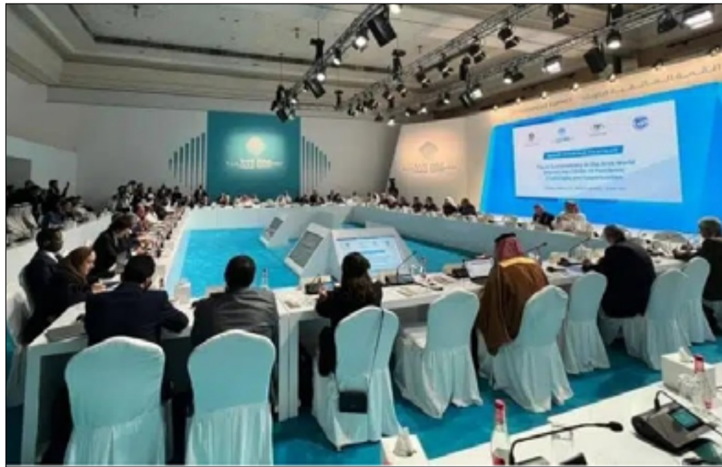
منتدى المالية العربية السابع في الامارات