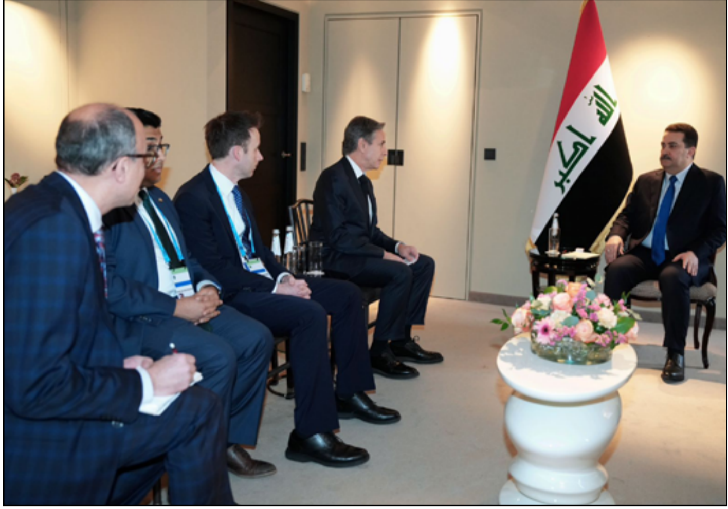
لقاء السوداني مع وزير الخارجية الاميركي

وبشكل مفاجئ استدار العراق نحو الولايات المتحدة ووقع مذكرة تفاهم مع شركة «جنرال إلكتريك» الأمريكية التي كانت متهمة من الإضرار بالتنسيقي الذي يقود الحكومة، بالهيمنة على قطاع الطاقة في البلاد، فيما قالت الخارجية العراقية أن من أولويات الحكومة «ترسيخ العلاقة الصحيحة مع واشنطن». وحتى الآن لم يبرز محمد السوداني رئيس الوزراء الولايات المتحدة وسط ترجيحات بوجود تحفظ من واشنطن على بعض القيادات المشاركة في والسوداني الذي يزور ألمانيا للمرة الثانية منذ تسلمه السلطة قبل 3 أشهر، استقبل وفدا من الكونغرس الأمريكي. وقال مكتب السوداني ان الأخير التقى السيناتور الأمريكي كريس فان هولدين، وذلك على هامش مشاركته في مؤتمر ميونخ للأمن.