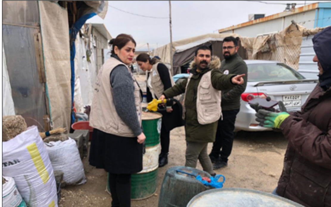
تجهيز عائلات نازحة بالنظف الأبيض

ونوه التقرير، إلى أن "مخيم عامرية الفلوجة تمت إعادة تقييمه في تشرين الثاني ٢٠٢١ على أنه موقع غير رسمي، وبذلك أصبحت أعداد مخيمات النزوح الرسمية بنهاية عام ٢٠٢٢ هو ٢٦ مخيماً". وتابع، أن "٤٨% من تعداد النازحين في العراق هم دون الثامنة عشر من العمر، أما الذين تبلغ أعمارهم فوق الـ ٦٠ من العمر، فشكل نسبتهم ٣% فقط".