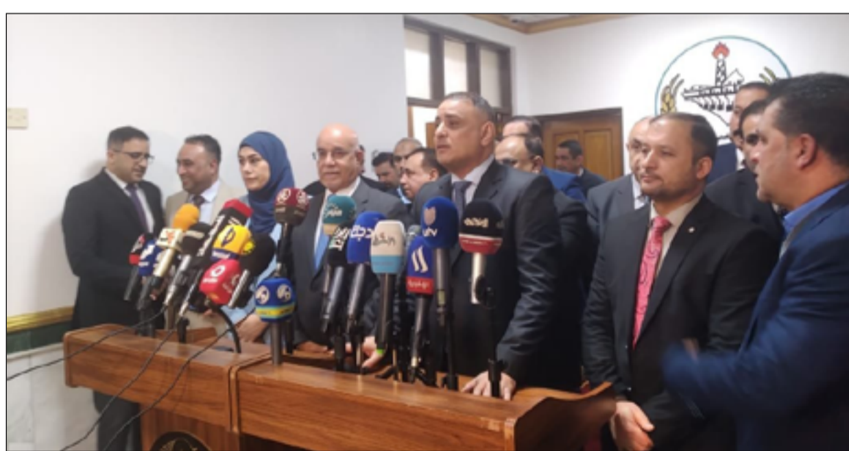
مؤتمر صحفي لوزير الصحة مع محافظ واسط أمس

وأشار، الى أهمية إنجاز هذا المشروع وتجهيزه بأحدث الاجهزة والمستلزمات الطبية ليقدم أفضل الخدمات الصحية لأهالي المحافظة. وذكر البيان، أن وزير الصحة افتتح ردهة الأمراض الانتقالية سعة (٢٠) سريراً في مستشفى الزهراء التعليمي. وقال الحسنواوي، إن افتتاح الردهة يعد اضافة نوعية للمستشفى وتم انشاؤها بدعم من برنامج الامم المتحدة الإنمائي.