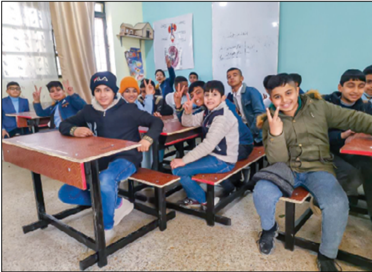
عودة طلاب المدارس للدراس بعد انتهاء العطلة الربيعية..