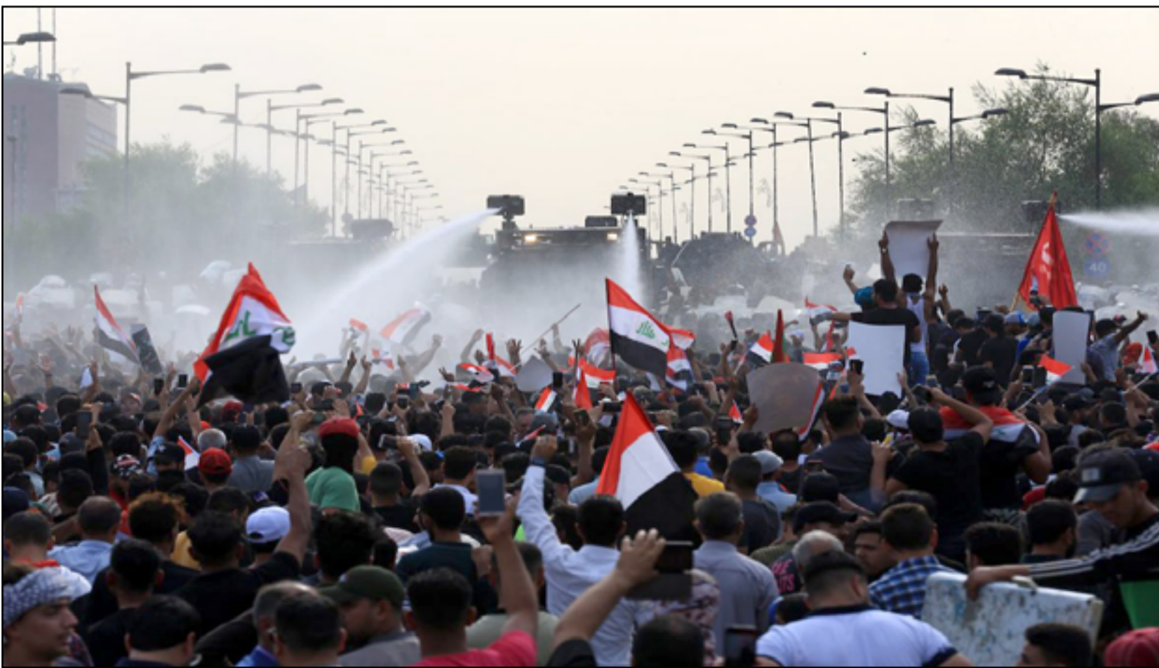
النظام الانتخابي كان من أبرز أسباب اندلاع انتفاضة تشرين

ورأى التقرير، أن «الجانب المثير للجدل في التعديل الجديد هو تبني نظام، سانت ليغو، في تخصيص المقاعد بين الأحزاب السياسية وفقاً لنسبة تمثيل القائمة الحزبية».