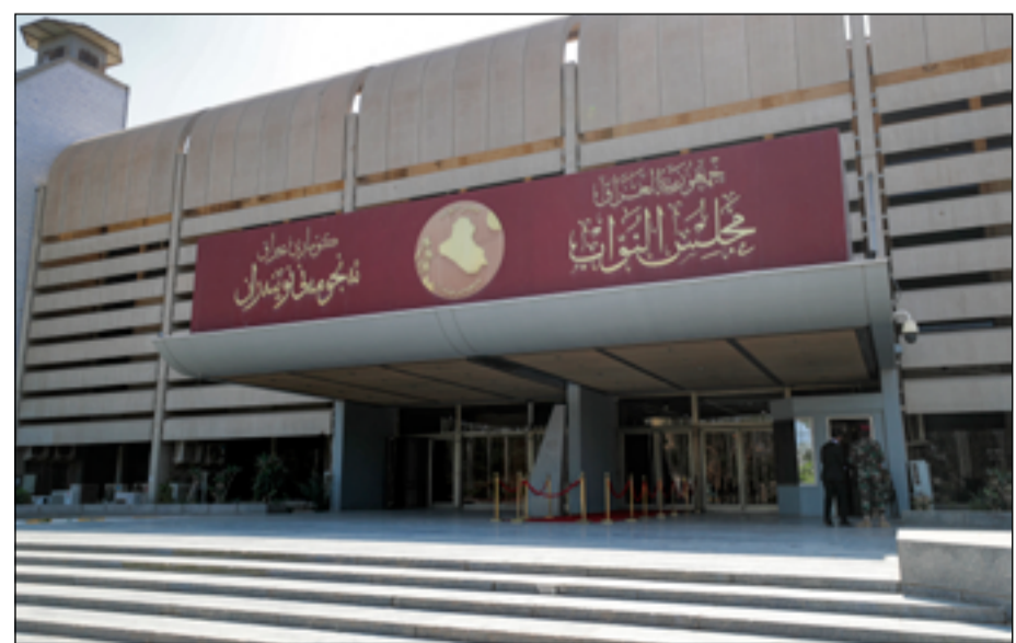
مبنى مجلس النواب