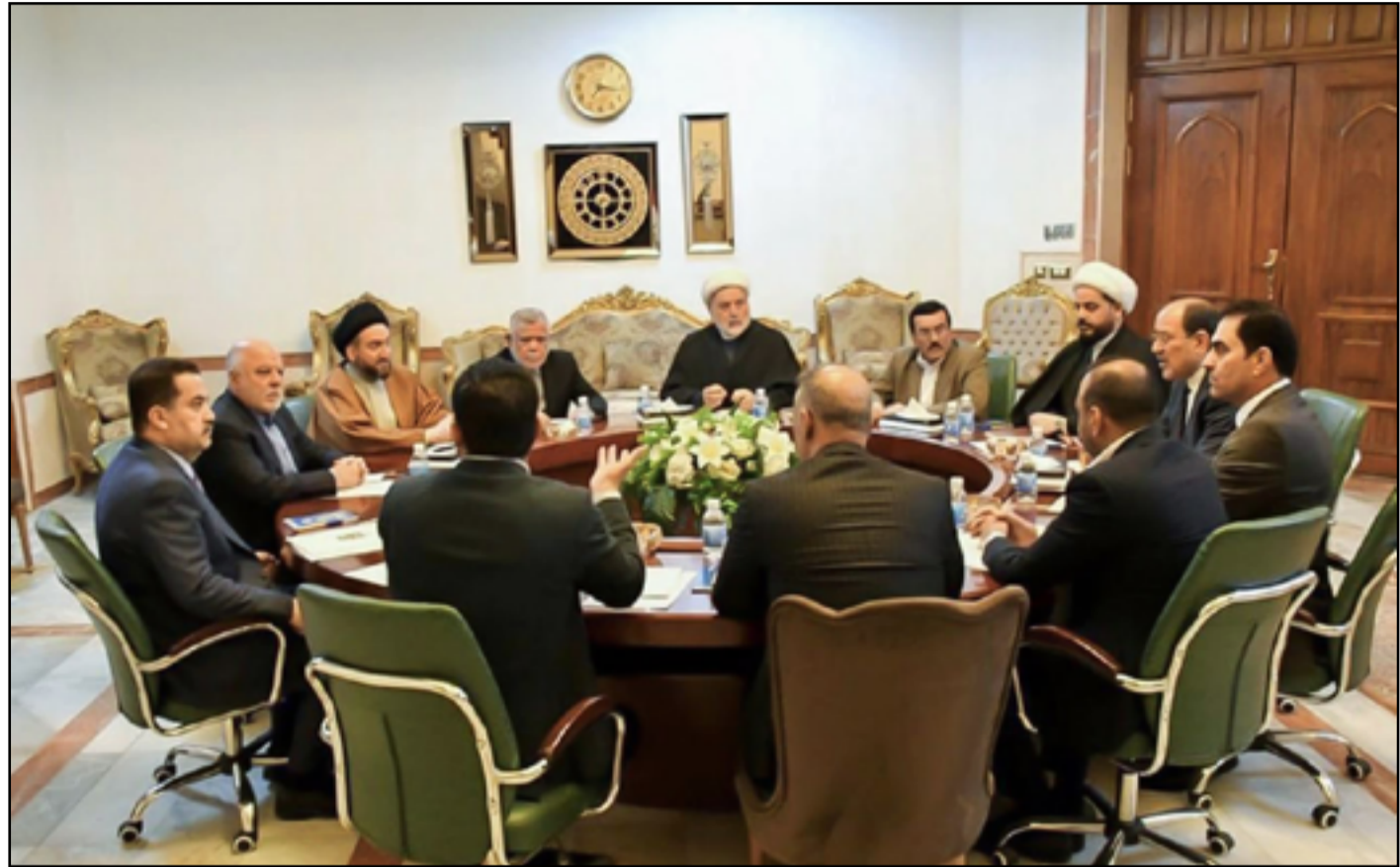
الإطار التسيقي يحاول أن يفرض رؤيته على العملية الانتخابية

ويحسب السياسي الذي كان في اجتماع «الإطار» أن التحالف الشيعي «يسمع أنباء عن تحركات للصدريين في آذار المقبل... ربما فيه شيء من الجالغات لكن لن ننظر المفاجآت».