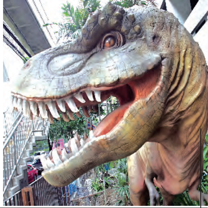
صوره لتمثال ديناصور عملاق عرض أمام متحف الموارد المعدنية في بانكوك. ويذكر أن أول اكتشاف لمتحجرات ديناصور في تايلند كان عام ١٩٧٦

امرأة تقلم طويات النوغا، وهي طويات تقليدية خاصة باعياد الميلاد، في مصنع صغير في قرية قرب فالنسيا الإسبانية.