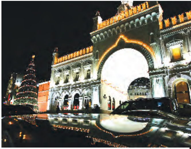
بناية مزينة بانوار واشجار عيد الميلاد في قلب العاصمة موسكو، الأنوار تنعكس على سطوح السيارات المارة.