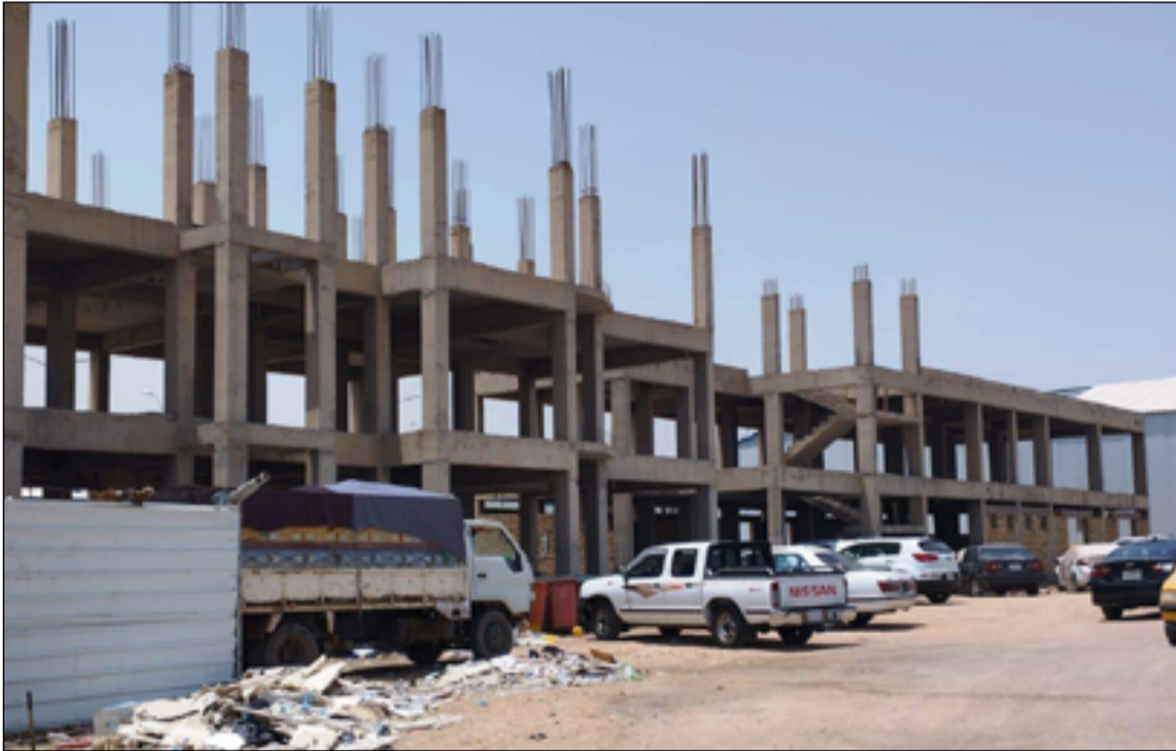
من المشاريع المتلكنة في محافظة ذي قار

وتواجه المشاريع الاستثمارية في ذي قار جملة من التحديات أبرزها الروتين والفساد الإداري والمالي والاعتراضات العشائرية، إذ تعد الاعتراضات والنزاعات العشائرية في محافظة ذي قار التي يشكل ابناء العشائر أكثر من نصف سكانها