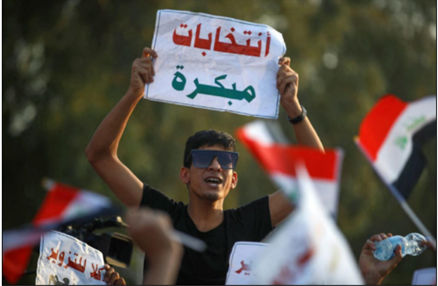
شاب عراقي يرفع لافتة تطالب بالانتخابات المبكرة اثناء مشاركته في انتفاضة تشرين

واول أمس أعلنت اللجنة المركزية للمحافظات المنتفضة عزمها الخروج