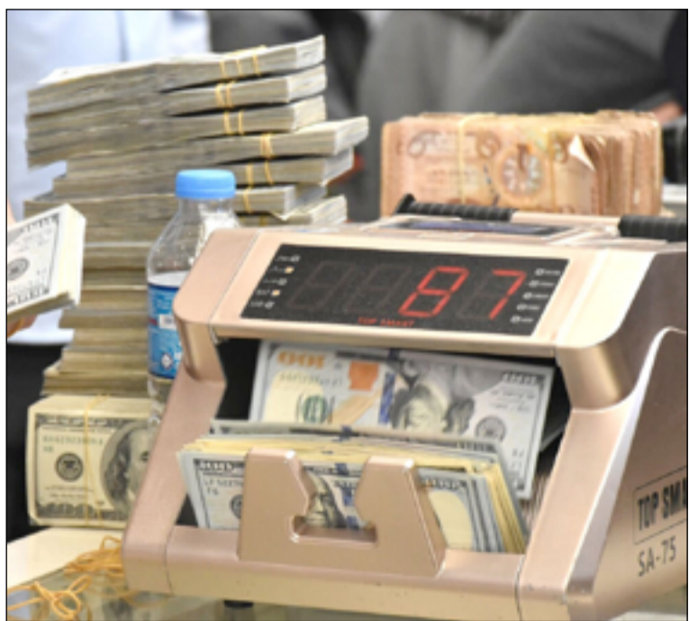
دعوات لاستثمار الفائض المالي والاحتياطي بالنحو الامثل

ونكرت الخزنة الأميركية في احصائية على موقعها الرسمي، أمس الاول السبت، وتابعتها (المدى)، ان "العراق اشترى سندات امريكية خلال العام الماضي 2022 وابتداء من كانون الثاني ولغاية كانون الأول بمقدار 18,31 مليار دولار، وبنسبة نمو بلغت 81,38% ولتبلغ حيازته 40,814 مليار دولار، وليحتل المرتبة الأولى بين الدول العربية التي كانت الأكثر شراءً السندات الامريكية خلال العام الماضي". واضافت، ان الإمارات جاءت ثانية من خلال شرائها سندات خلال عام واحد بمقدار 13,7 مليار دولار وينمو بلغ 30,51%، تليها الكويت من خلال شرائها 2,1 مليار دولار وينمو بلغ 4,53%، تليها السعودية بلغ 0,59%.