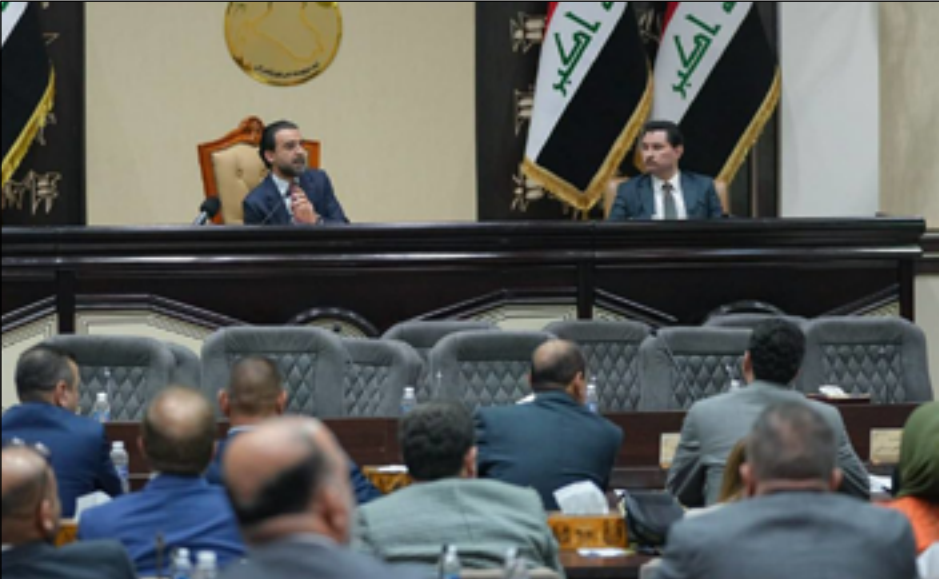
جلسة البرلمان ليوم أمس