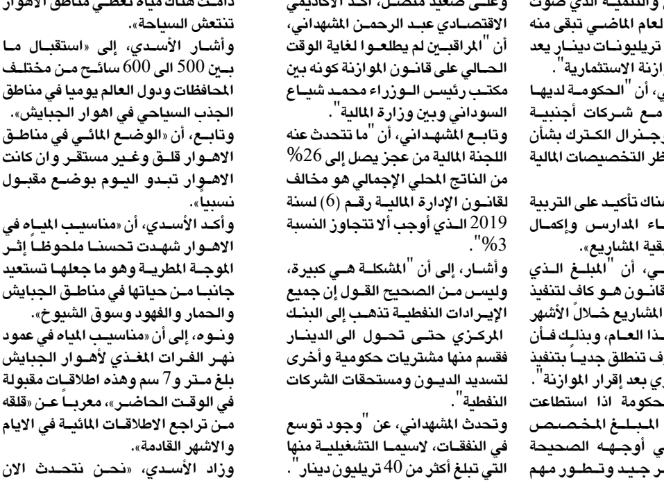
اجتماع اللجنة المالية النيابية أمس

تشريع موازنة مختلفة أبرزها أن العام الماضي لم يشهد اقرار الموازنة إضافة إلى انعكاسات الوضع الحالي». وأشار، إلى أن «الازمة الاقتصادية التي راقت جائحة كورونا خلال عامي 2020 و 2021 وتوقف التعيينات أديا إلى مشكلات كبيرة». وبين العطاوي، أن «الحكومة أجرت عدداً كبيراً من التعديلات على القانون، بعد أن كان في البداية بمبلغ 220 تريليون دينار في ضوء سعر صرف 1450 ديناراً عراقياً لكل دولار». وأوضح، أن «اللجنة المالية كان لها رأي بأن هذا المبلغ كبير جداً وتواصلت مع الجهات الحكومية ذات العلاقة لاسيما وأنه بعجز يقدر بـ 70 تريليون دينار عراقي». استطرد العطاوي، أن «قرار تخفيض