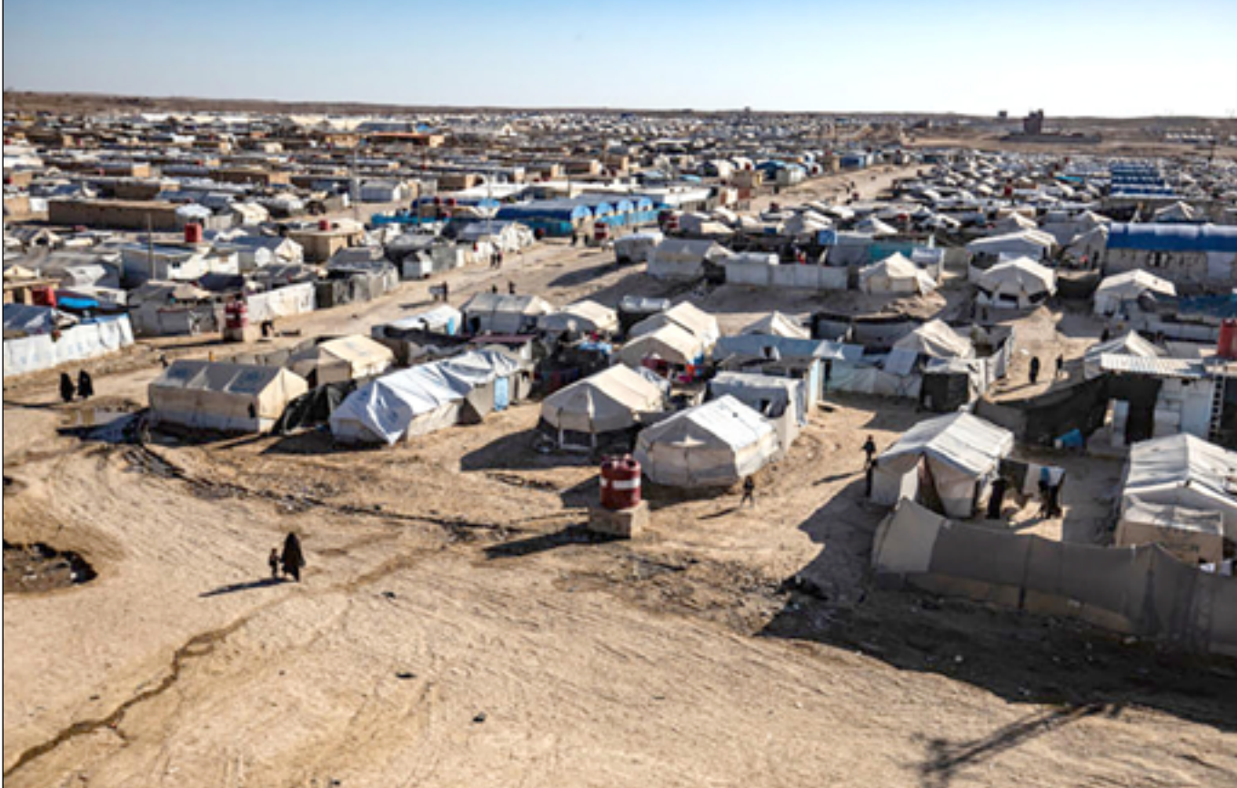
مخيم الهول في سوريا يشكل التهديد الأمني الأكبر للمنطقة

وذكر بيان لوزارة الهجرة نهاية العام الماضي، أن وزيرة الهجرة ايفان فائق وجهت خلال ترؤسها اجتماع اللجنة العليا لاغاثة ودعم النازحين، بتعليق عمليات إعادة النازحين العراقيين من مخيم الهول السوري إلى مركز الجدة لحين وضع آلية جديدة ونهية جميع الظروف المناسبة لإعادتهم". وازعرت فائق بحسب البيان في حينها لقيام وزارة الهجرة بمسؤولية ادارة مخيمات جعدة ١ وجعدة ه فؤاد حسين العام الماضي تأكيده على دعوات الاعرجي عندما قال إن بغداد مصرة على استعادة جميع العوائل المقيمة في مخيم سوريا بعد استكمال التفتيحات الأمنية عليهم. يذكر انه في وقت سابق من هذا الشهر استعادت حكومة كازاخستان ١٨ امرأة و٤١ طفلاً من مخيم الهول، وهي خطوة رحبت بها الولايات المتحدة وقيادة