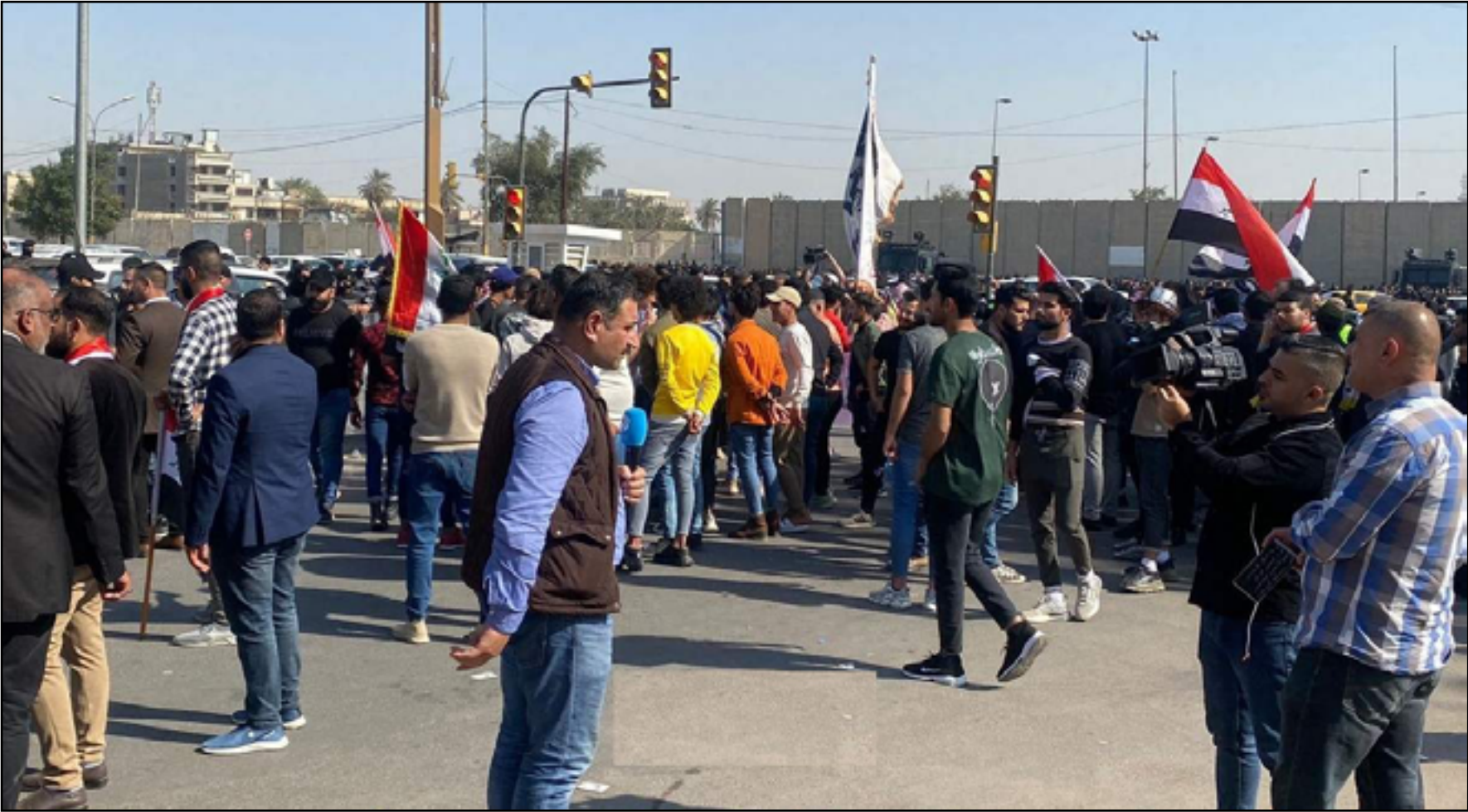
تظاهرات قرب مبنى البرلمان أمس رفضاً لاعتماد نظام سانت ليغو