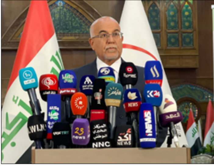
المؤتمر الصحفي لوزير الصحة