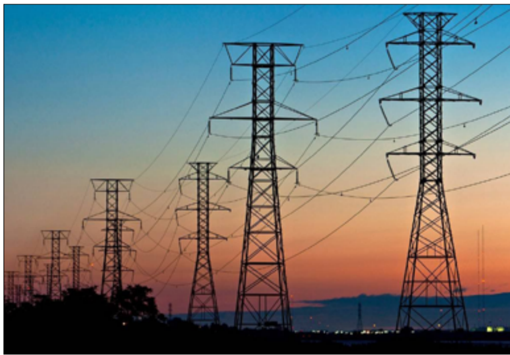
العراق يعول على الربط الكهربائي مع دول الجوار في تحسين وضع المنظومة الوطنية

والتقدم والتنمية في المجالات الاقتصادية والاجتماعية، وأعرب السوداني عن تقديره لجهود مصر بدعم العراق على جميع الأصعدة. ونظيره المصري، مصطفى مديولي، على تكليف الوزراء المعنيين في كلا الحكومتين بالعمل خلال الشهرين القادمين على تفعيل مذكرات التفاهم التي تم توقيعها بين البلدين. واتفق المسؤولين على ضرورة ان يتزامن ذلك مع الاستعدادات لإجتماعات