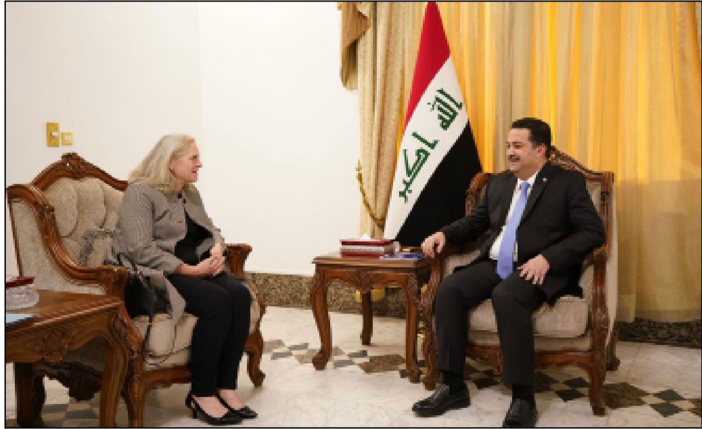
لقاء سابق بين السوداني والسفيرة الأميركية في بغداد

لكن دبلوماسيا سابقا، اشار الى ان دور السفارة المتميز هو بسبب "شخصيتها المؤثرة"، ولقاءاتها لا تخرج عن إطار الاتفاقية بين واشنطن وبغداد. وتقوم رومانوسكي بنشر كل لقاءاتها بالحكومة وبالشخصيات السياسية والعامية على موقع السفارة الالكتروني ومنصات اخرى. وتجاوزت لقاءات السفارة مع الحكومة والوزراء منذ استلام محمد