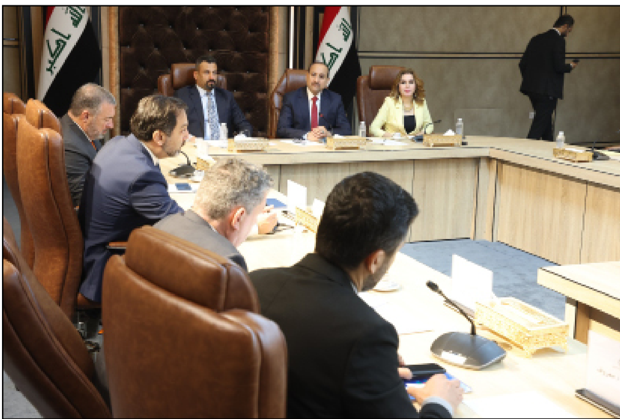
اجتماع للجنة المالية النيابية يوم أمس

وتابع العنبيكي، أن "إنجاز النقاشات على القانون يمكن أن يحصل خلال الشهر الحالي، حتى يمكن اقراره في موعد اقصاه مطلع نيسان".