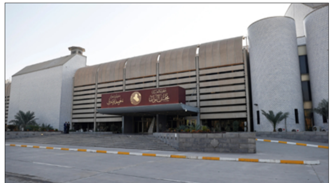
مبنى البرلمان وسط بغداد

يذكر أن مجلس النواب مرّر في حزيران 2022، مشروع قانون الدعم الطارئ للأمن الغذائي والتنمية، في خطوة سمحت للحكومة بالإنفاق على بعض المشاريع وتسيير شؤون الدولة بشكل مؤقت رغم الخلافات السياسية التي راقت عملية تمرير القانون.