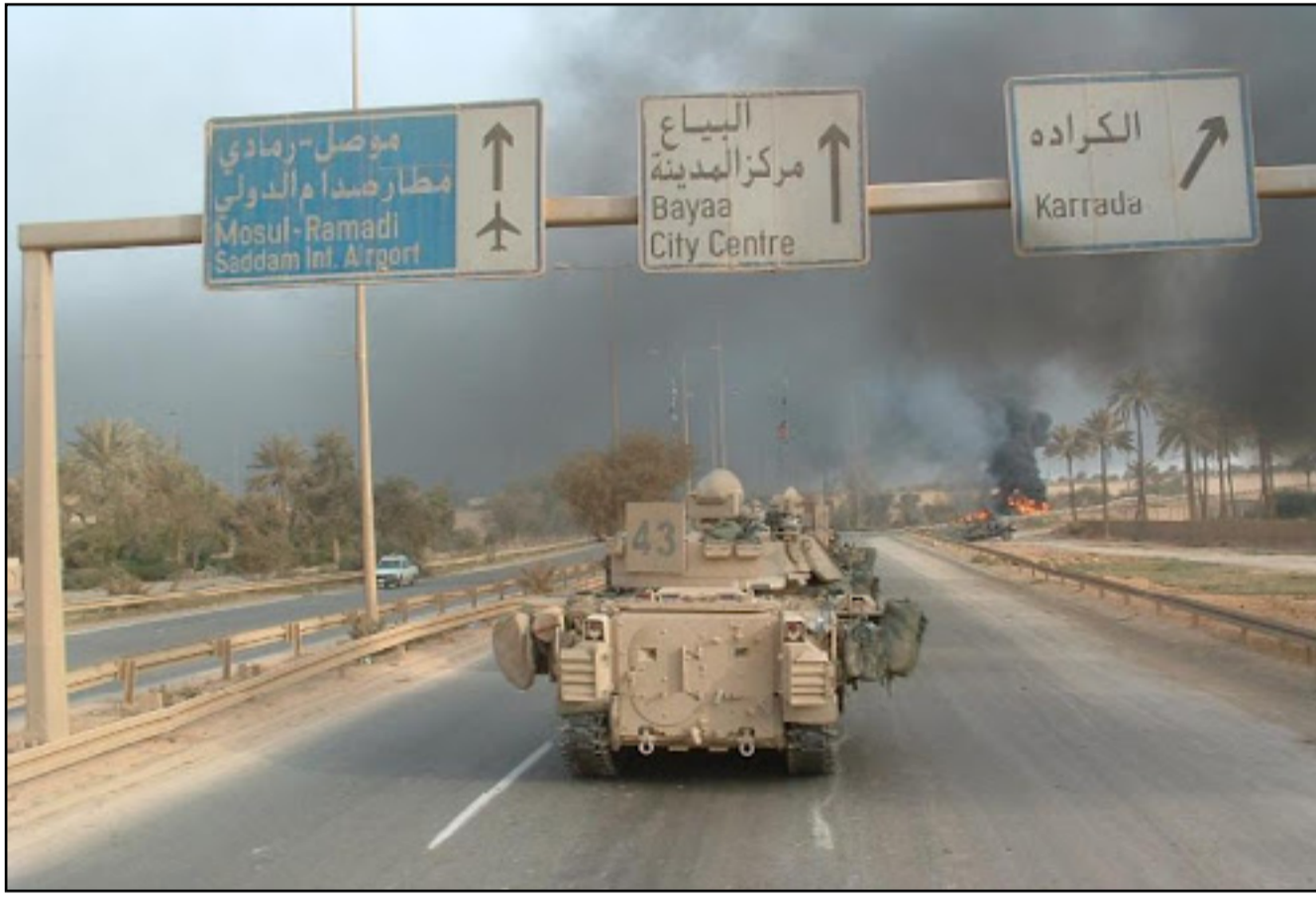
الذكرى العشرون لبدء اسقاط نظام صدام