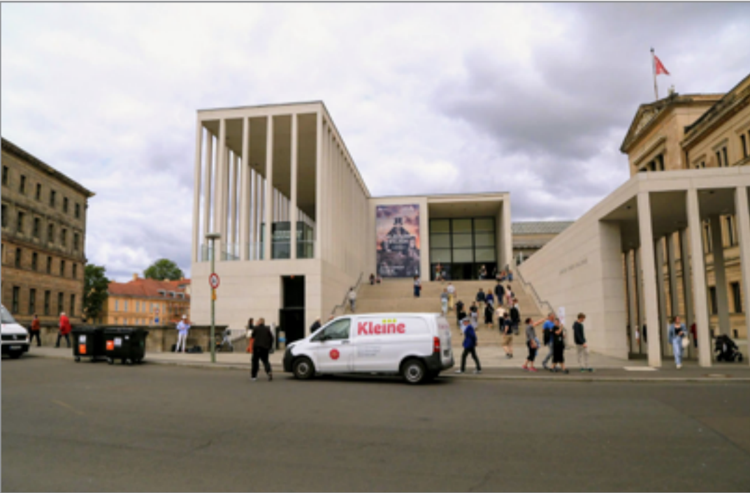
"غاليري جيمس - سيمون" (2018)، برلين/ المانيا، المعمار: "دافيد تشيرفيلد معماريون"، منظر عام

من ضمن مبانيه العديدة والمهمة يعتبر مشروع تجديد "غاليري جيمس - سيمون" (2018) James - Simon Galerie في برلين المانيا، احد ابرز مشاريعه في السنين الاخيرة والذي اولت اليه هيئة تحكيم جائزة بريتزكر اهتماما خاصا. شخصيا، زرت موقعا الجائزة المرموقة، كان مصيبا جدا و.. عادلا ايضا في اختيارها للفائز لهذا العام.