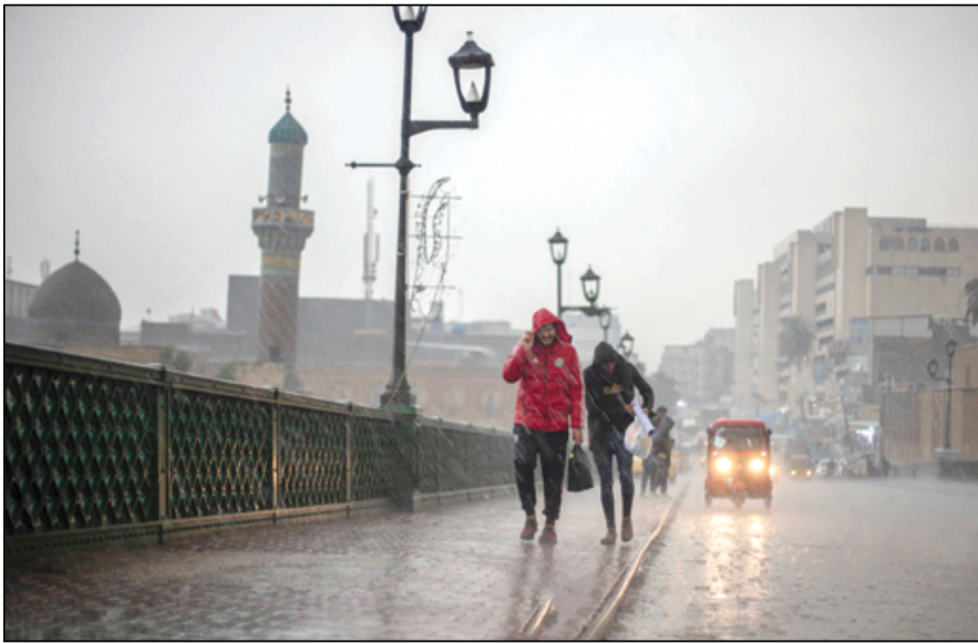
موجة أمطار شديدة شهدت بغداد وعدد من المحافظات أمس.. عسة محمود رؤوف