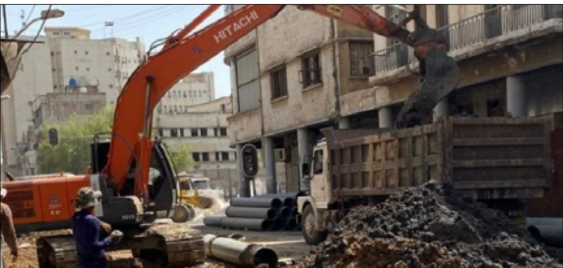
العديد من المشاريع الخدمية متوقفة بسبب عدم إقرار الموازنة

وقد كان مجلس الوزراء في وقت سابق كصوت على مشروع قانون الموازنة لثلاث سنوات، وقام بإحالتها إلى البرلمان للتصويت عليه.