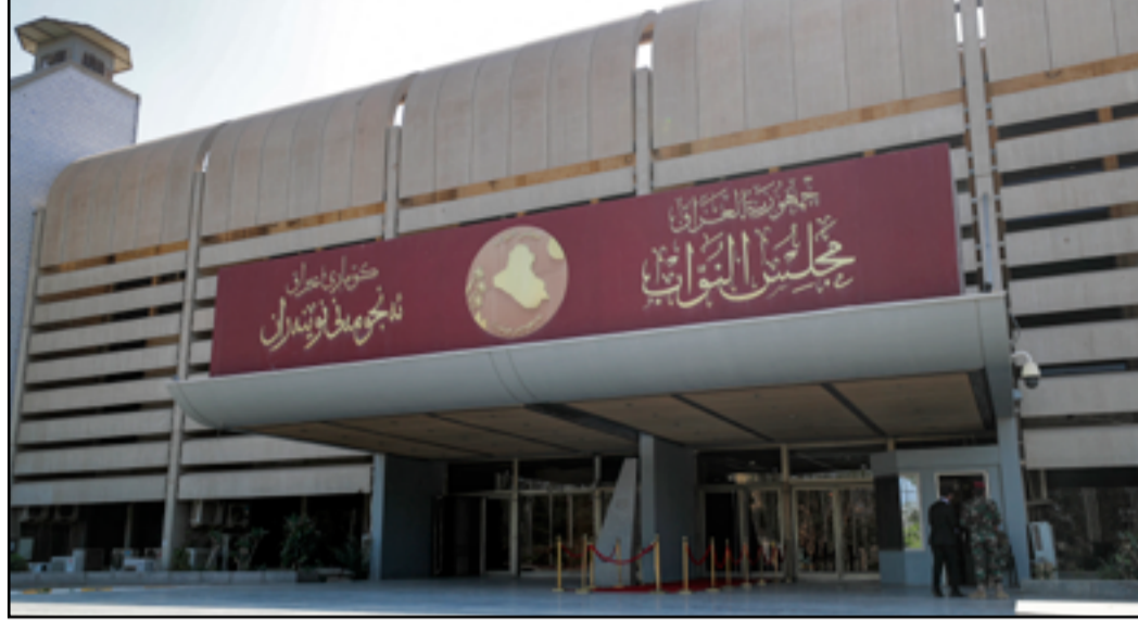
مدخل مبنى مجلس النواب العراقي

وحققت الكتل الكبيرة (في جلسة السبت) اسوأ نصاب منذ بدء مناقشة نسخة القانون المقدمة من الإطار التنسيقي قبل اسبوعين، يأقل من ثلث