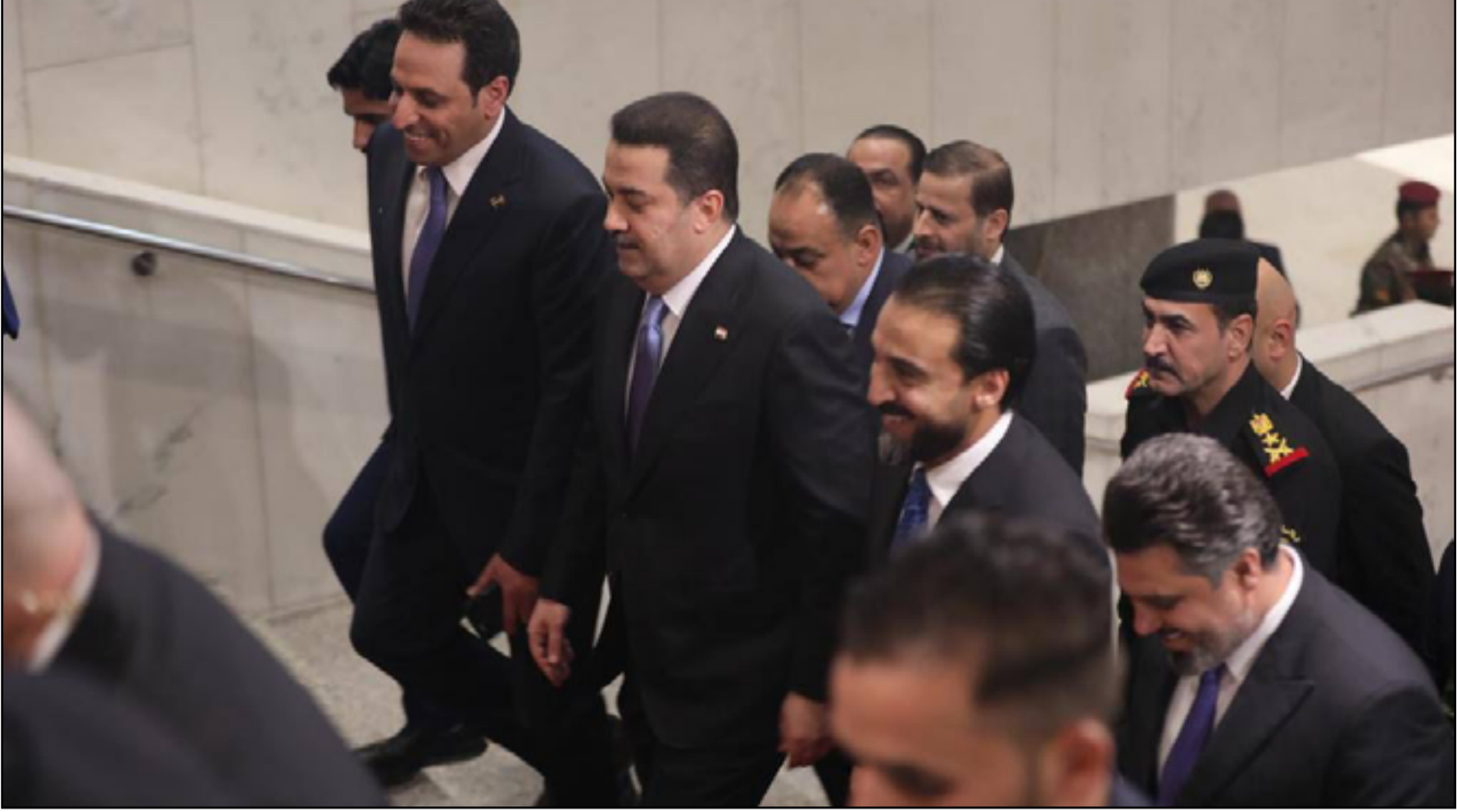
العلاقة بين السودانى والحلبوسى تدخل في مرحلة جديدة من الخلافات

وتابع النجيفي: «هذه الدائرة المغلقة تزيد من يأس المجتمع السني بالعملية السياسية وهذا خطر يدركه عقلاء الشيعة ولكن الاغلبية من سياسيين الشيعة لا يكتفون بثل هذه الاخطار بل يفتنون بان بإمكانهم فرض نموذجهم في ادارة الدولة حتى النهاية».