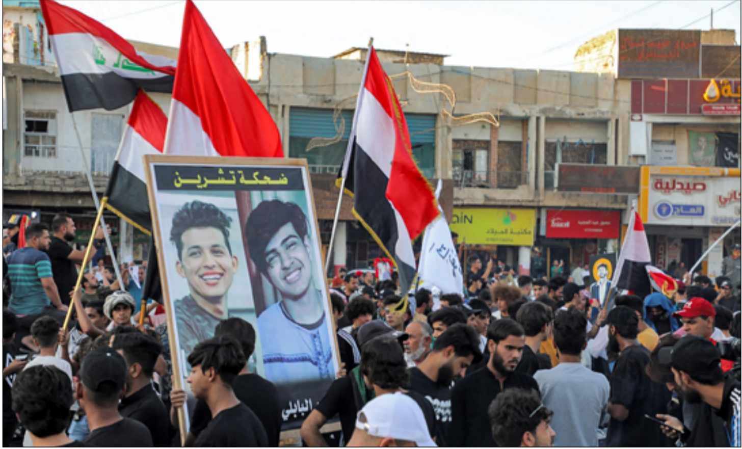
شباب عراقيون يرفعون صورة لاثنتين من شهداء انتفاضة تشرين

ورأى التقرير، أن "فشل حركة احتجاجات تشرين في تحقيق تغيير ملموس هو مؤشر على مدى الصعوبة التي يواجهها الشباب بتحقيق طموحاتهم