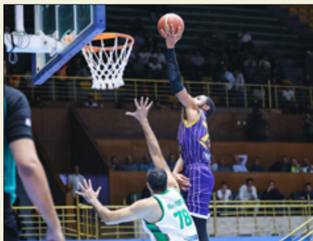
جمهور الشرطة يتسبب بمعاينة فريقه في الممتاز

يُعدّ الفريق خاسراً (إذا حال بأفعاله دون لعب المباراة) وهذا لم يحدث إطلاقاً مضيغاً فريقنا بقي متقدّماً