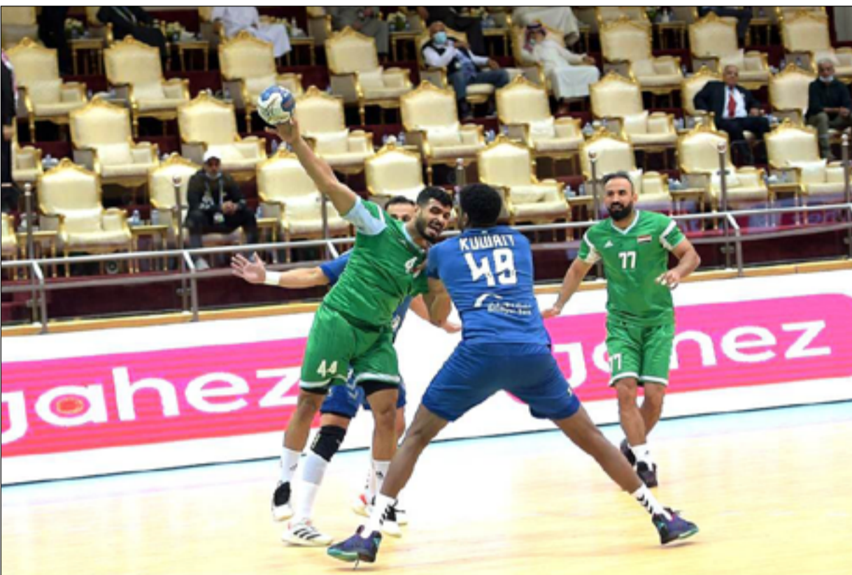
منتخبنا الوطني يعاود التدريب من جديد

واستطرد في قوله "من خلال الاستعدادات هذه سنبحث عن منتخبات صديقة تربطنا معها اتفاقيات تعاون من أجل تأمين خوض مباريات ودية خلال المرحلة اللاحقة مع تركيا والأردن وسوريا مثلاً وبقيّة الدول الشقيقة، وستشهد التدريبات تصاعد بإعدادات للبطولات