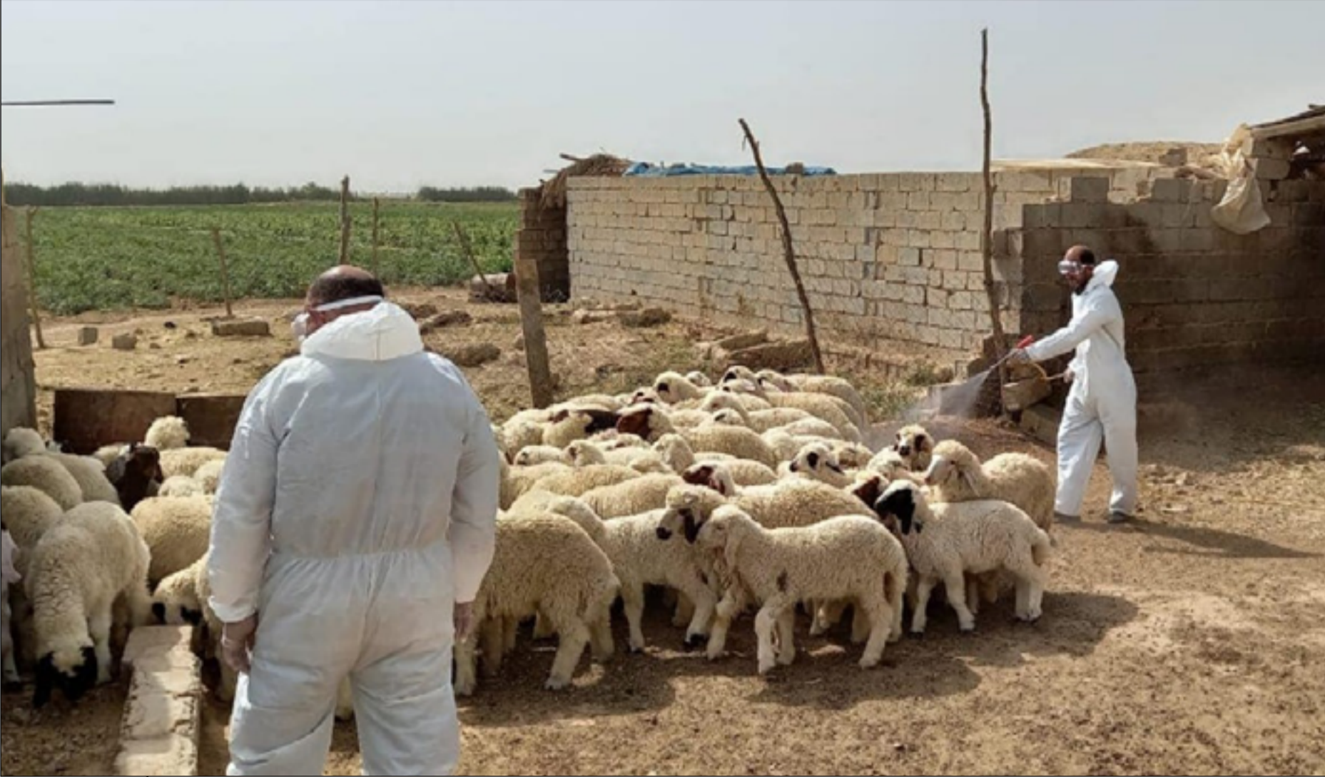
إجراءات تعقيم المواشي خوفاً من انتشار الحمى النزفية

الفرق البيطرية بتنفيذ مفردات هذه الحملة. وتصدر محافظة ذي قار ومنذ عامين المحافظات العراقية في ارتفاع معدلات الإصابة بالحمى النزفية واعداد الوفيات بالمرض، إذ سجلت ١٦ إصابة بينها ٧ وفيات في النصف الثاني من عام ٢٠٢١، فيما سجلت في النصف الاول من عام ٢٠٢٢ (٤٣) إصابة بينها ٨ وفيات، وأكثر المصابين من مربي المواشي والقصابين.