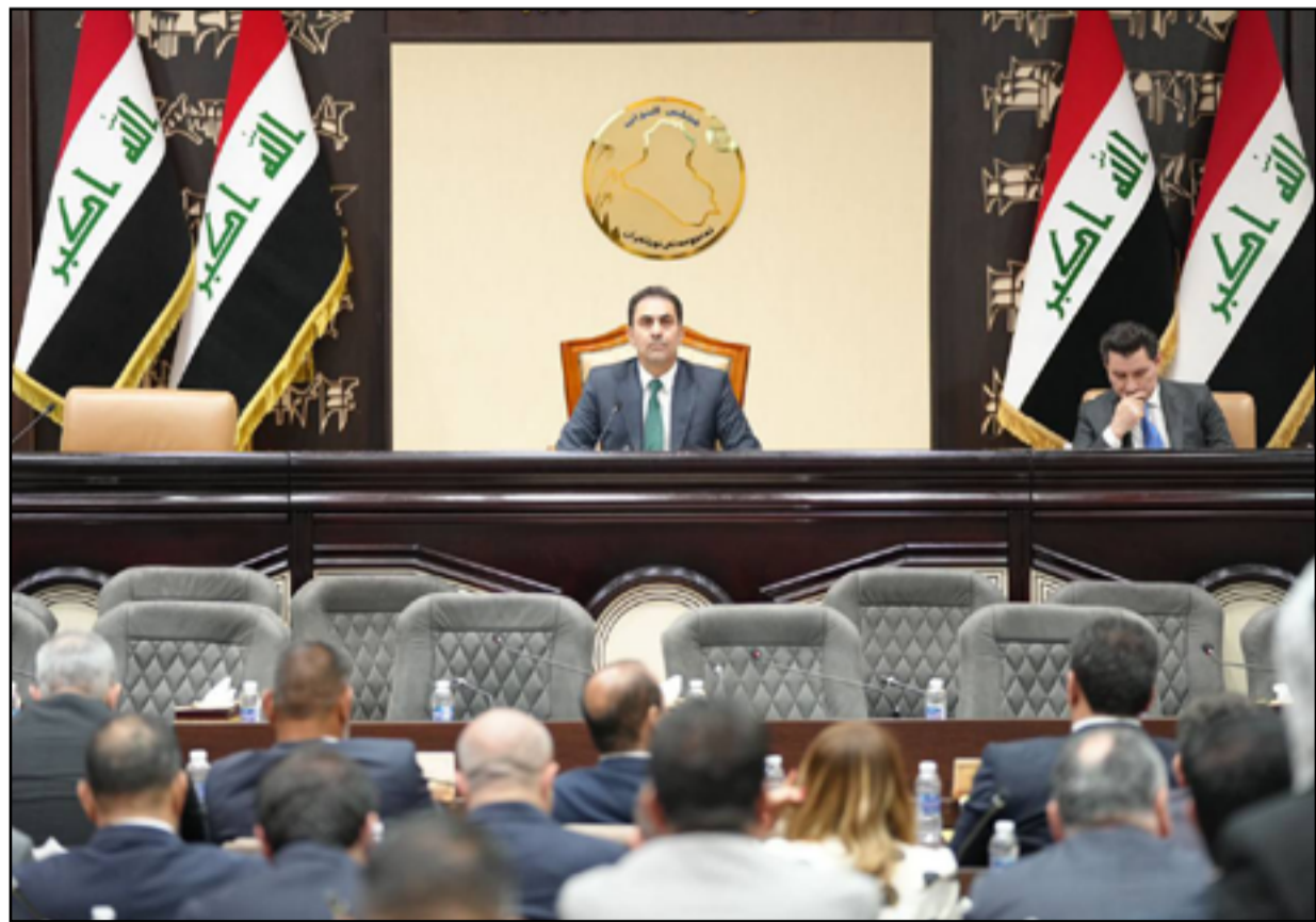
جلسة القراءة الأولى لمشروع قانون الموازنة المنعقدة نهاية الاسبوع الماضي

ونوه، إلى أن «القانون سيكون بعدها جاهزا للتصويت، ونحن نتطلع لأن ننجز هذا الملف بأقرب فرصة بما لا يتجاوز الشهر المقبل».