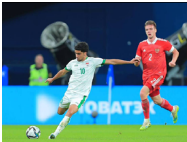
لقاء روسيا عزز من تصنيف منتخبنا الدولي

منتخب العراق يطل نسخة عام ٢٠٠٧، والإمارات التي ضيّفت النسخة الماضية عام ٢٠١٩، وعمّان، وأوزبكستان التي بلغت قبل نهائي نسخة عام ٢٠١١، والصين التي نالت اللوصافة مرّتين، والأردن.