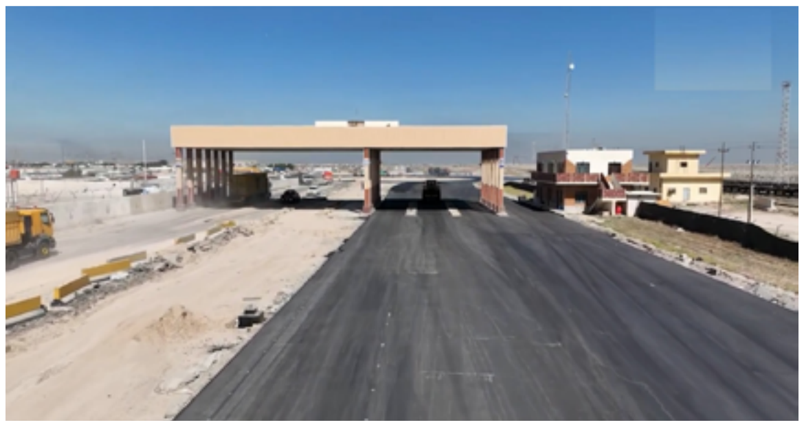
من اعمال تشييد ساحة الترحيب الكبرى

ومضى البيان، إلى أن "الطاقة الإنتاجية الابتدائية لمشروع ميناء الفاو الكبير تتراوح بما بين (٢٠-٤٠) مليون طن سنوياً وبكلفة كلية تزيد على (٤) مليارات (٧٧٧) مليون دولار".