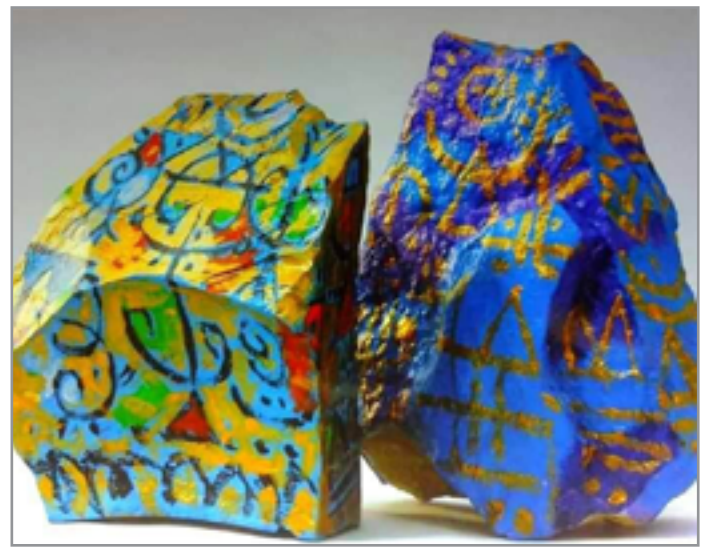
من أعمال الفنان