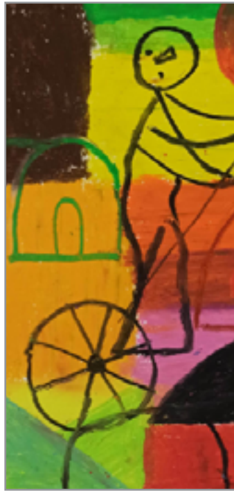
من أعمال الفنان

يجهدوا كلاً على وفق قدراته في ترميم الانهيار النقدي، لكن حضورهم وسط زحام الأسماء المتواضعة يضعف من وهج آراءهم ووجههم النقدي، شخصياً لا أقي بالاكثير مما يكتب، فقراءة اسطر قليلة كافية لتبيان ضحالة ما يكتب وفقر الخلفية المفاهيمية والثقافية، وركاكة البناء اللغوي.