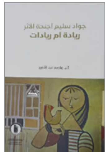
غلاف أحد مؤلفات الفنان