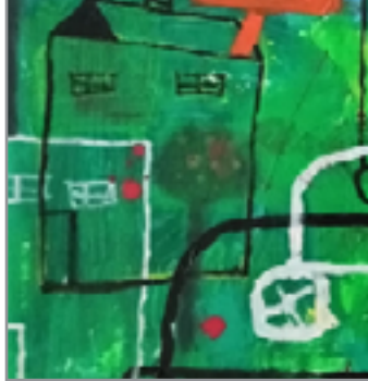
من أعمال الفنان

تأثرت برسوم جواد سليم، والروح السرية في رسوم آل سعيد، وأحببت تجارب بول كلي، والفن المحيبي الشعبي، لكن ملامح هذه المثيرات لا تقوى على زحزة أصالة الرسوم التي أعمل على إنجازها جاهداً لجعل إحياءه محض صدى بعيد.