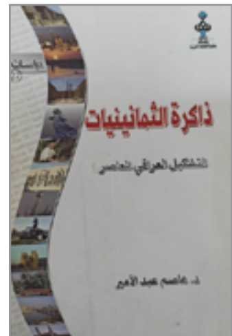
غلاف أحد مؤلفات الفنان

التأثير برسوم جواد سليم، والروح السرية في رسوم آل سعيد، وأحببت تجارب بول كلي، والفن المحيبي الشعبي، لكن ملامح هذه المثيرات لا تقوى على زحزة أصالة الرسوم التي أعمل على إنجازها جاهداً لجعل إحياءه محض صدى بعيد.