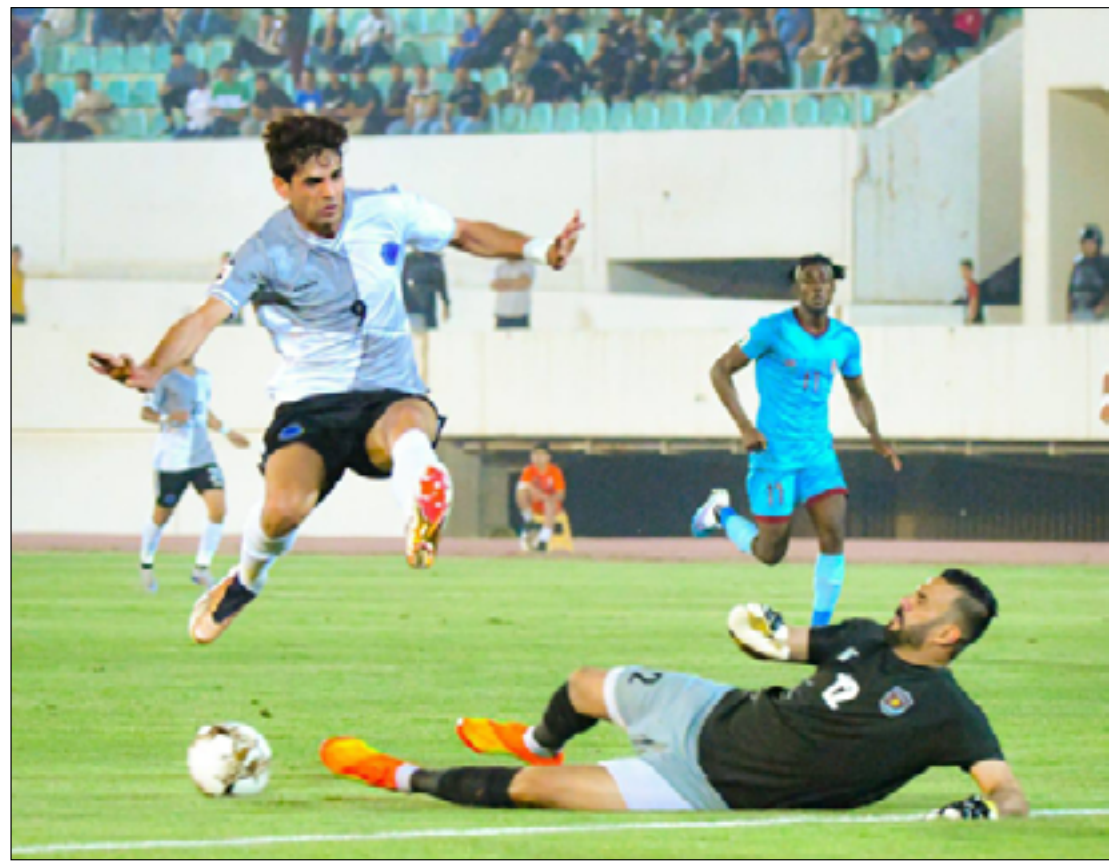
نفط ميسان يخطف ثلاث نقاط مستحقة من الطلبة

وخلص الشيخلي إلى القول "تتمنّى أن تسير مباريات المسابقة الأولى في العراق نحو خواتمها بسلام من دون تعرّض أي مساهم في نجاحها إلى الإساءة أو الأذى، وأن يتم انصاف الجهود التي بذلها الحكّام ولجنتهم خلال الموسم كونهم العمود الأساس للعبة".