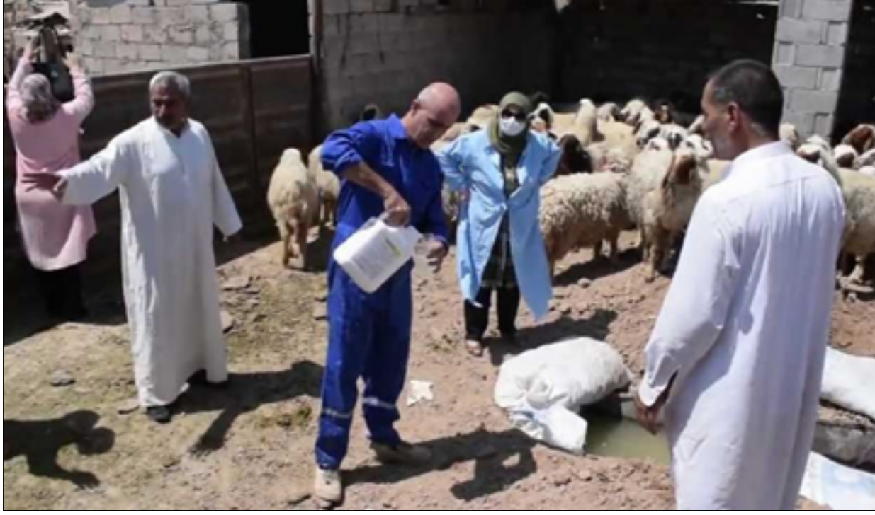
جانب من عمليات التعقيم لمكافحة مرض الحمى النزفية

واكتشف الفايروس المسبب للحمى النزفية للمرة الأولى عام ١٩٧٩ في العراق، وبحسب منظمة الصحة العالمية، ينتقل الفايروس من إنسان إلى آخر نتيجة الاتصال المباشر بدم الشخص المصاب أو إفرازاته أو أعضائه أو سوائل جسمه الأخرى.