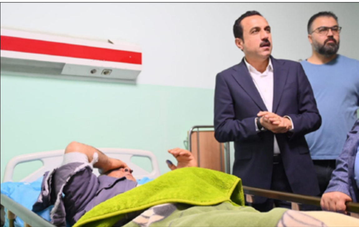
محافظ أربيل يتابع الوضع الصحي للضحية