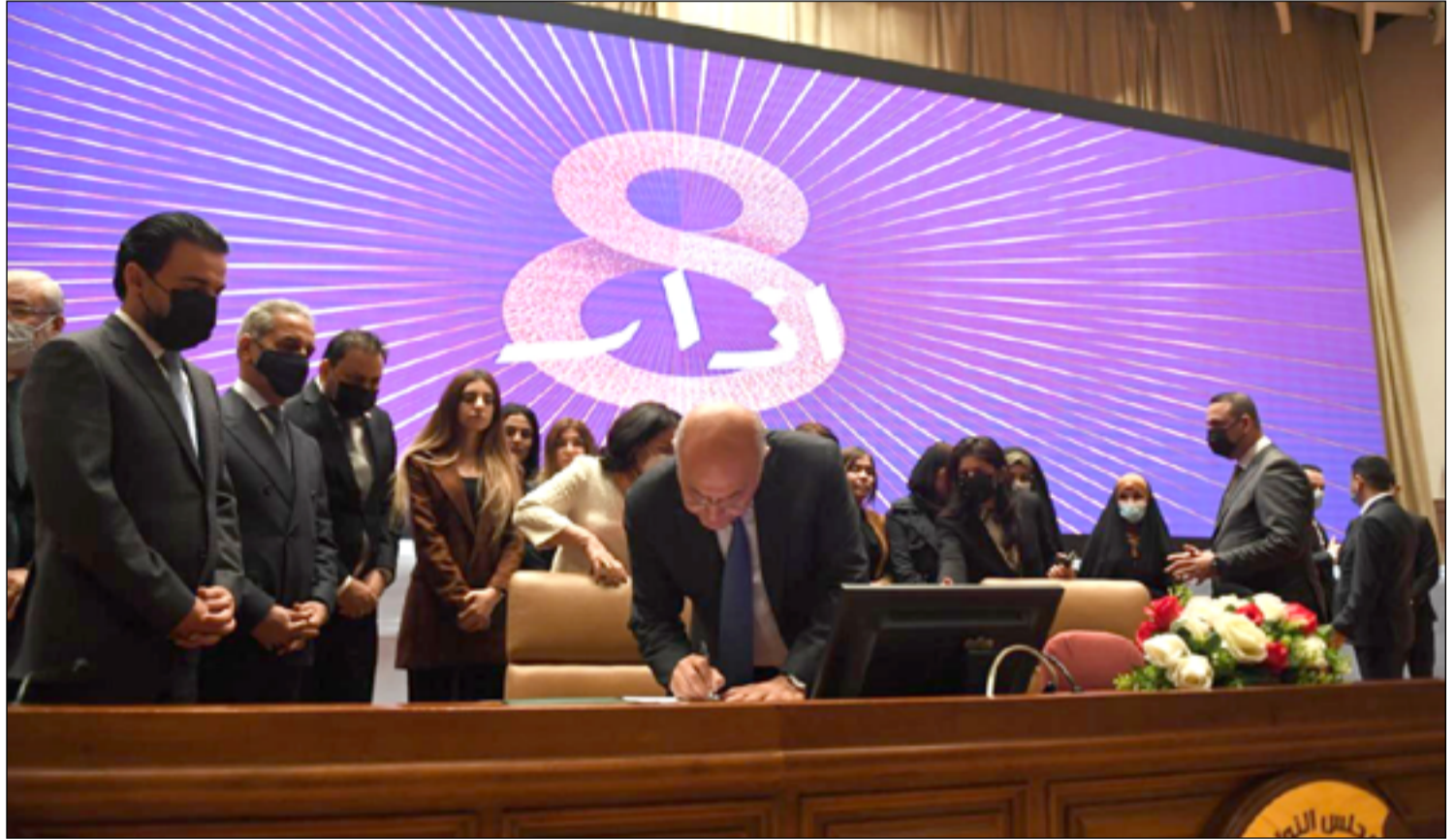
رئيس الجمهورية السابق برهم صالح أثناء المصادقة على قانون الناجيات الايزيدييات

جنائية ليكونوا مؤهلين للحصول على تعويض. وذكر البيان ان هذا سيتعارض مع العرف الدولي والحق بإجراء فعال وفق قانون حقوق الإنسان الدولي.