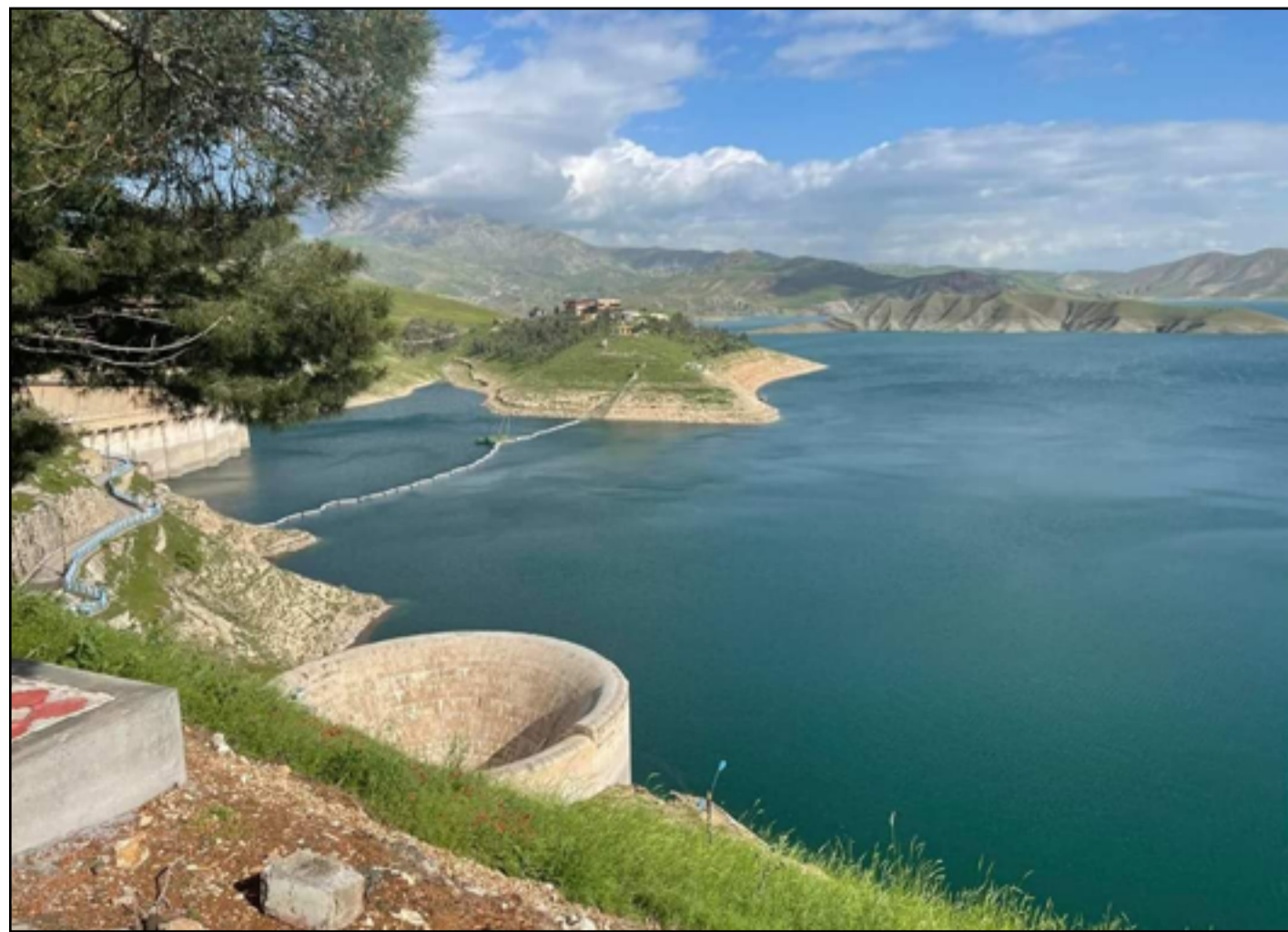
ارتفاع ملحوظ في سدود اقليم كردستان بسبب موجات الامطار الاخيرة

وأكد شمال، أن "الأمطار التي تسقط بعيدا عن مجاري الأنهر تساعد في إنعاش المناطق الرعوية وزيادة المساحات الخضراء".