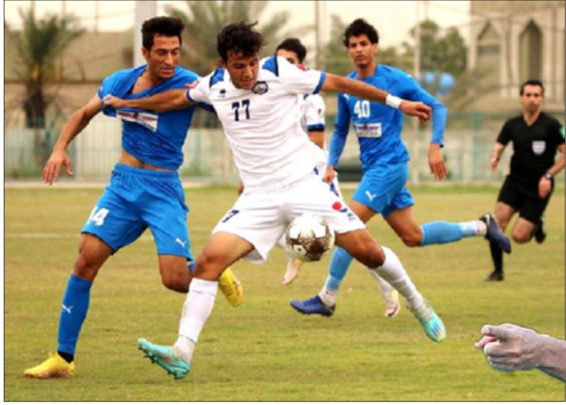
فريق الصناعة يسعى للإبعاد عن منطقة الخطر

شهد الدوري الممتاز لكرة القدم للموسم الحالي استفحال ظاهرة إقالة وتدوير المدربين في أغلب الأندية، وأقدمت إدارات ١٣ نادياً على تغيير مدربيها، ما أعطى انطباعاً بأن هذه الإدارات تريد أن تبعد عن نفسها ثيمة تراجع مستوى الفريق وربما تتعرض للمساءلة من هيئاتها العامة لذلك تحمّل التصدير على عاتق الملاكات التدريبية "الضحية" في أغلب الأحيان لأنها الحلقة