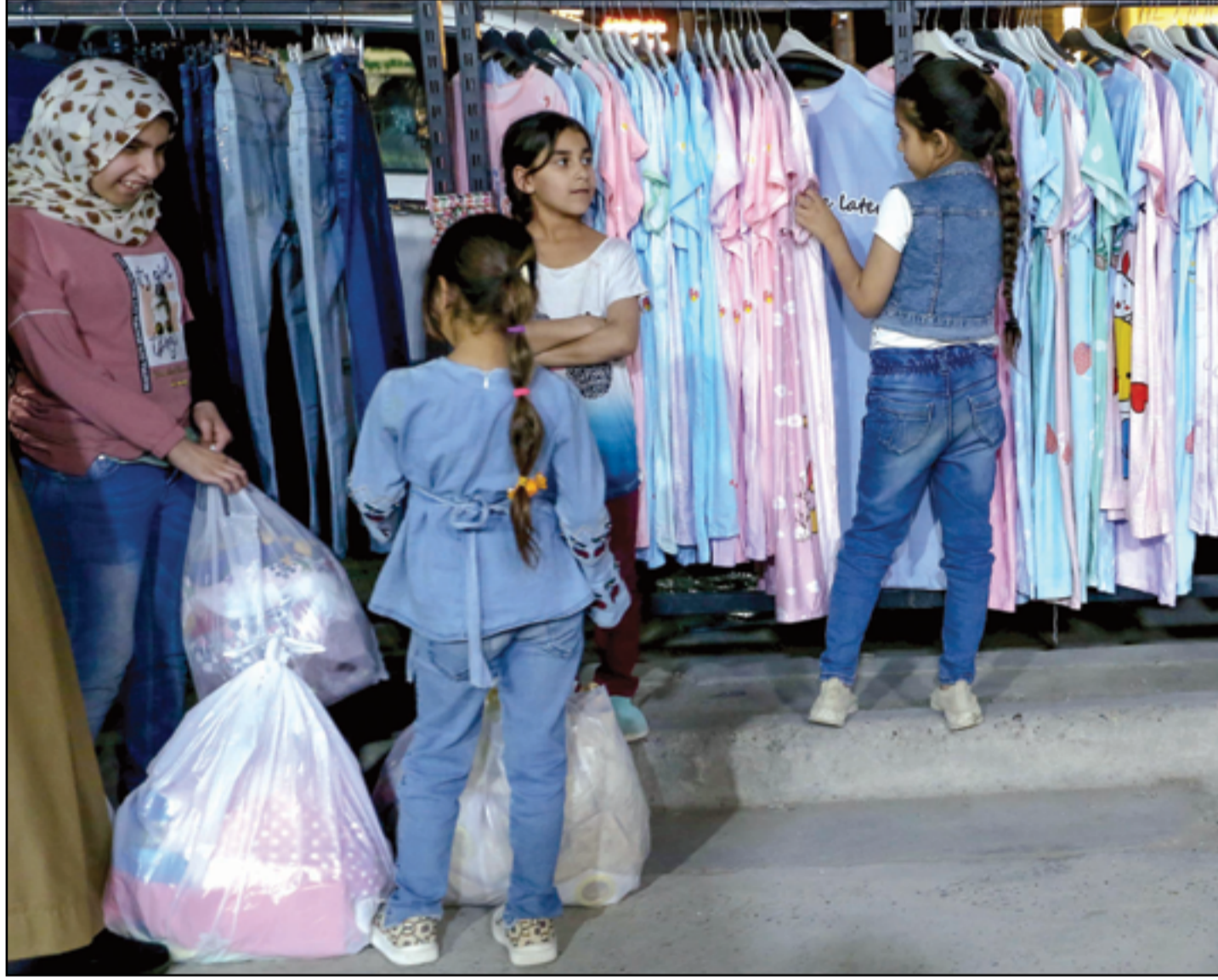
مع اقتراب عيد الفطر أقبال على الأسواق...

وأكد البيان، "الاتفاق مبدئياً على المباشرة بتزويد السفارات داخل العراق بالمعلومات الخاصة بالأطفال والنساء العائدين لها، ليتم إكمال الإجراءات الإدارية والقانونية والمباشرة بنقلهم من العراق إلى دولهم".