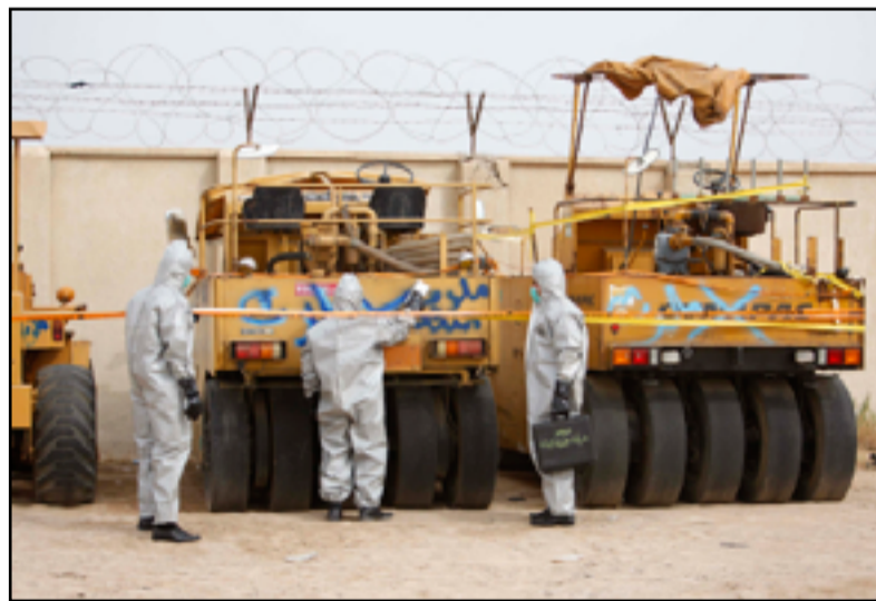
ثلاثة من عناصر فرق إزالة التلوث الإشعاعي

كشف مسؤول أمني عن رفع 18 دعوى قضائية لملاحقة الدوائر الحكومية وغير الحكومية المخالفة للضوابط والشروط والمحددات البيئية خلال الأشهر الثلاثة الماضية في ذي قار. وقال مسؤول مركز شرطة حماية البيئة في محافظة ذي قار العميد رشيد عبيد جاسم، إن «عدد الدعاوى التي تم تسجيلها خلال الأشهر الأولى من العام الحالي بلغت 18 دعوى تتعلق بمخالفات بيئية مختلفة». وأكد جاسم في تصريحه إلى (المدى)، «تسجيل أكثر من 1500 دعوى قضائية منذ عام 2009 ولغاية الوقت الحاضر». وأشار، إلى أن «هذه الدعاوى تشمل جميع أنواع التلوث المتعلقة بالهواء والتربة والمياه والتلوث الإشعاعي والضوضاء فضلاً عن المخالفات التي تخص أبراج الهاتف النقال وأبراج الإنترنت». ونوه جاسم، إلى أن «معظم الدعاوى والقضايا المرفوعة أمام القاضي البيئي تم حسمها وفق القانون واتخاذ الإجراءات القانونية المناسبة بحق المخالفين». وأكد، أن «المبني من الدعاوى المذكورة هو محدود ما زال في طور التحقيق والحسم في المحكمة المختصة».