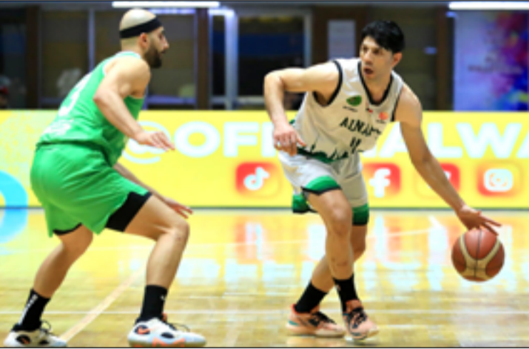
سلة النفط تطمح لمواصلة المشوار في البلي أوف