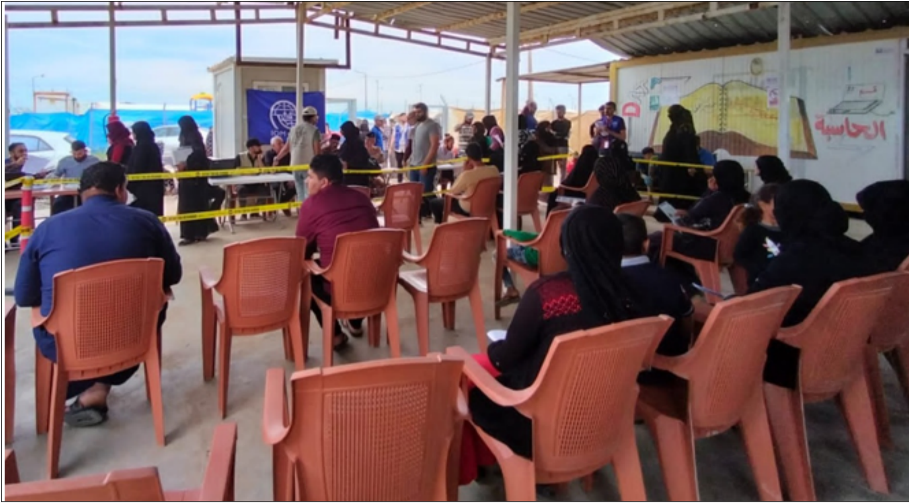
عودة 368 نازحاً من مخيم الجدة في نيوى إلى مناطق سكناهم أمس

ونكر تقرير ترجمته (المدى)، أن الدراسة شملت عينات من 2803 عائلات عائدة موزعة على 14 منطقة ومدينة في بيجي وبلد والفلوجة والحمدانية والحويجة وهيت وخانقين وكركوك والموصل والرمادي والشرقاط وسنجار وتلعفر وتكريت، بمقارنة أوضاعهم في الوقت الحالي مع ما كانت عليه قبل غزو تنظيم داعش الارهابي لمناطقهم بسنتين وذلك في العام 2012. وأضاف التقرير، أن الدراسة ركزت على جانب الامن والسلامة ومستوى المعيشة والامكانية الاقتصادية واسترجاع ملكية البيت والارض وعودة انسجام العائلة مع المجتمع المحيط والمشاركة في الأنشطة العامة وكذلك المعالجات القانونية وانصافهم وتحقيق العدالة لهم. وأشار، إلى تحسن إيجابي معتدل بالسلامة والامن، حيث شعر العائدون