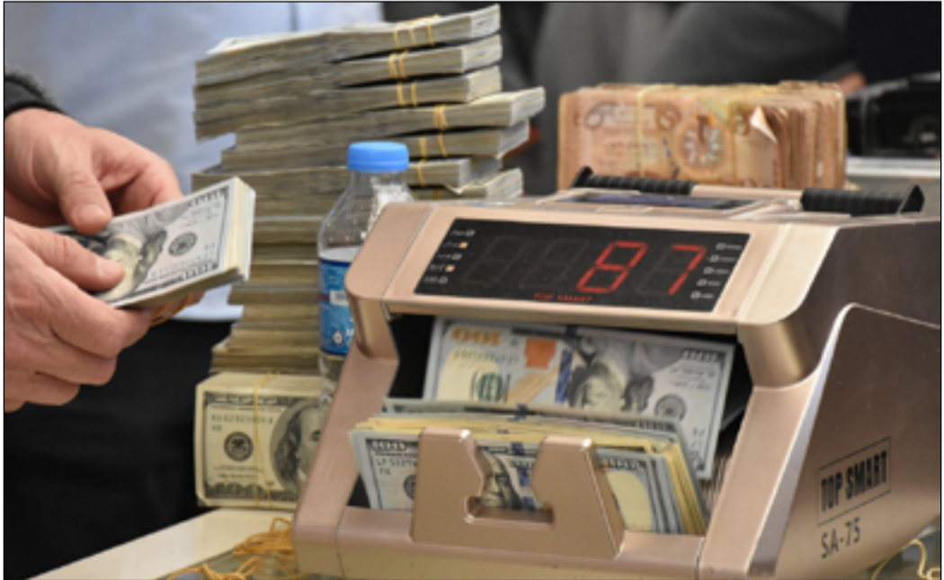
استقرار نسبي في سعر صرف الدولار في الأسواق المحلية

وبيّن كوجر، أن استبعاد بعض المصارف والتأكد على صحة الفواتير ضيق الخناق على العمليات غير المشروعة. وأكد، أن هذه الإجراءات أدت إلى شحة في الدولر داخل الأسواق، وأصبحت أمام نقص، مبيناً أن السيطرة الكاملة على سعر صرف الدولار في السوق الموازي لا يكون إلا من خلال إلزام