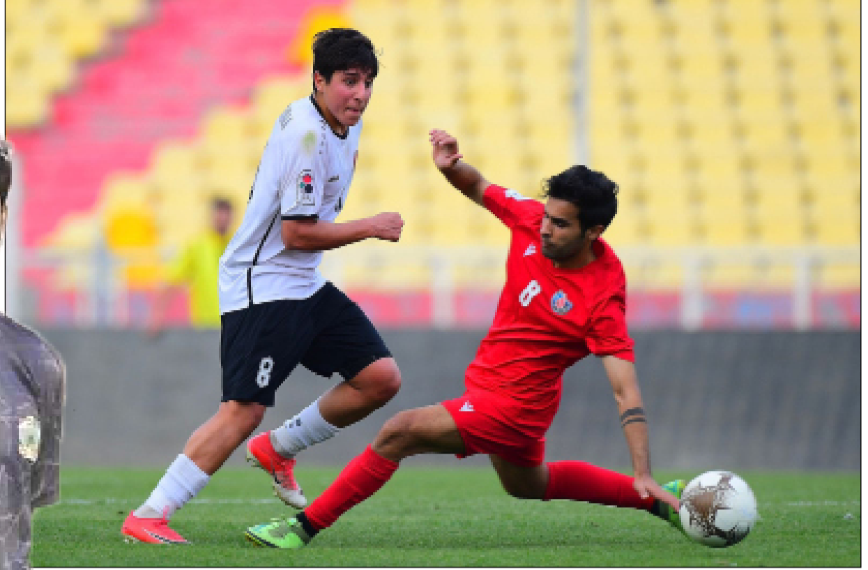
الكهرباء فقد نقاط الفوز أمام نطق البصرة في الجولة الماضية