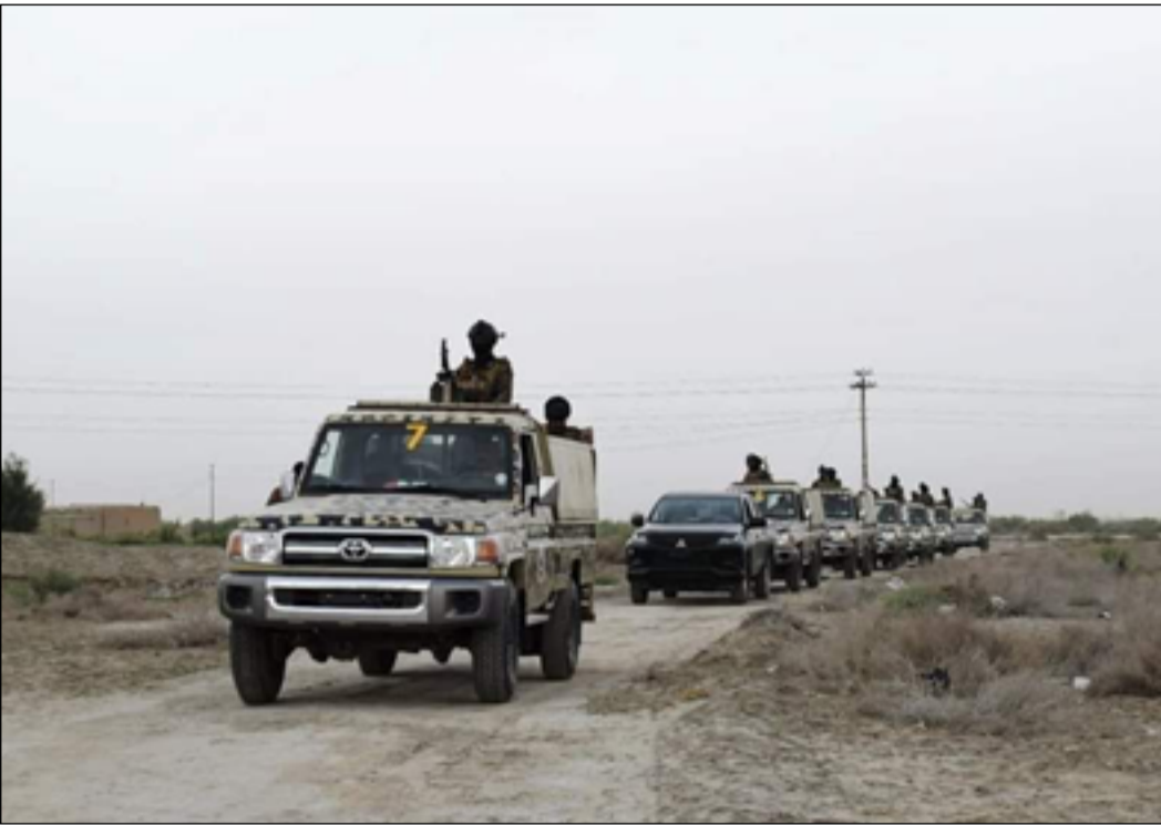
انتشار امني لملاحقة مثيري النزاعات العشائرية في ذي قار

وأشار البيان الأمني، إلى "وصول قوة أمنية من العاصمة بغداد قوامها فوج واحد من قوات الجيش العراقي للمساهمة بفرض القانون في قضاء النصر". بحسب شهود عيان. وأثار الزحف العشائري المسلح