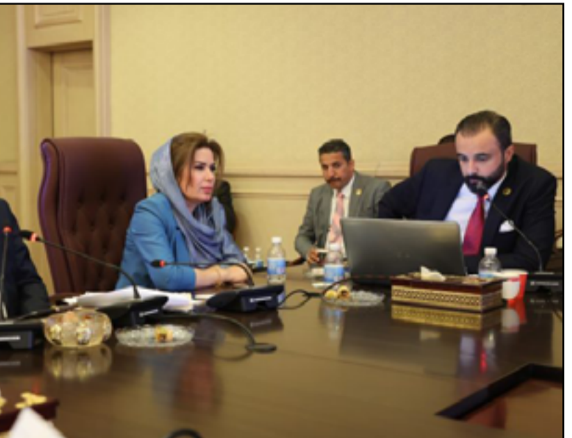
اللجنة المالية تعاد اجتماعاتها بشأن الموازنة الأسبوع الحالي

بالنسبة للحكومة التي تريد أن تعضي في منهاجها الوزاري الذي يعتمد على تقديم الخدمات من خلال المشاريع المهمة". وتابع الكاظمي، أن "ملاحظات النواب على قانون الموازنة قد تلخصت في ثلاثة محاور مهمة". وأن هذه الموازنة قد رسمت لثلاث سنوات. وشدد، على "ضرورة العمل لتخفيض الديون الخارجية التي بلغت 9 تريليونات جديدة للعام الحالي، وما يترتب عليها من فوائد كثيرة، وهذا هو المحور الثاني".