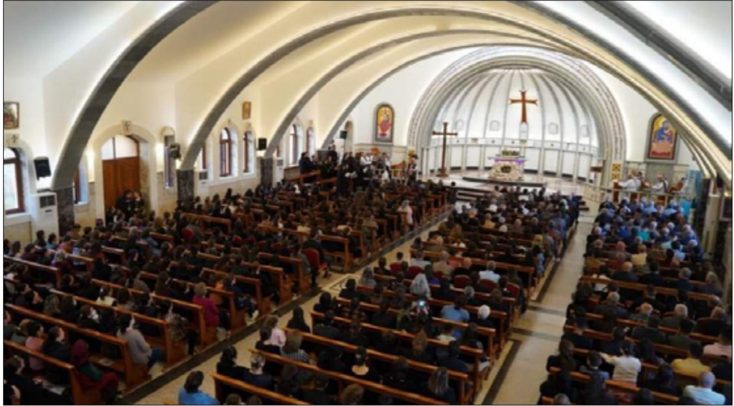
لحد كنائس نينوى

عن تعرضها بين حين وآخر لضربات جوية تركية. أما شخصياً أشارك أهالي سنجار مخاوفهم.