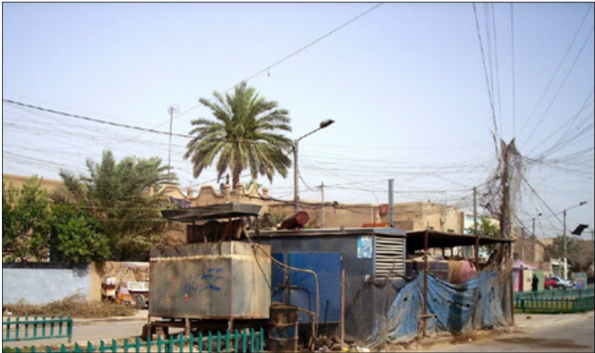
العراقيون على موعد مع ارتفاع أسعار اشتراك المولدات الاهلية مع حلول الصيف

عند نهاية كل شهر، لاستنزاف جيوب المشتركين وتهديدهم بالإطفاء" أورد، أن "هذا الموضوع مشخص وسبق ان تمت مخاطبة الدوائر المعنية لكن دون ان تكون هناك معالجة حقيقية للموضوع