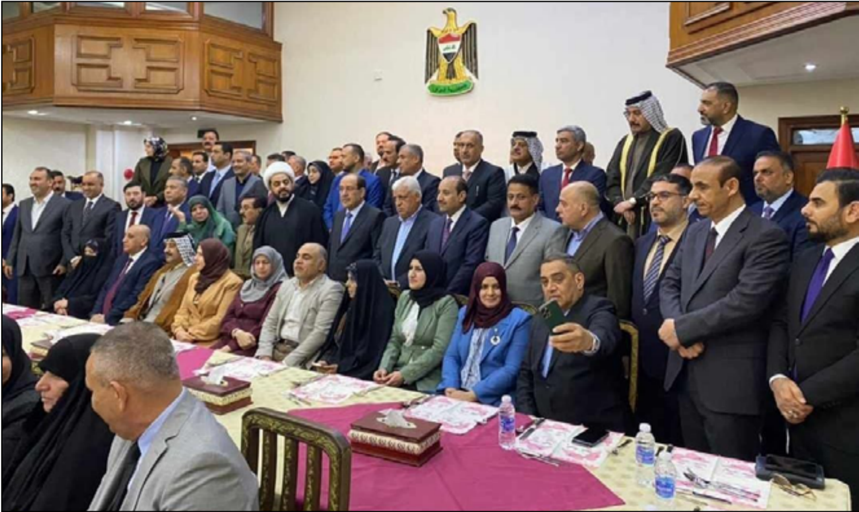
الإطار التسيقي يستعد للدخول في جولة الاستحواذ على أغلب المناصب العليا في الدولة