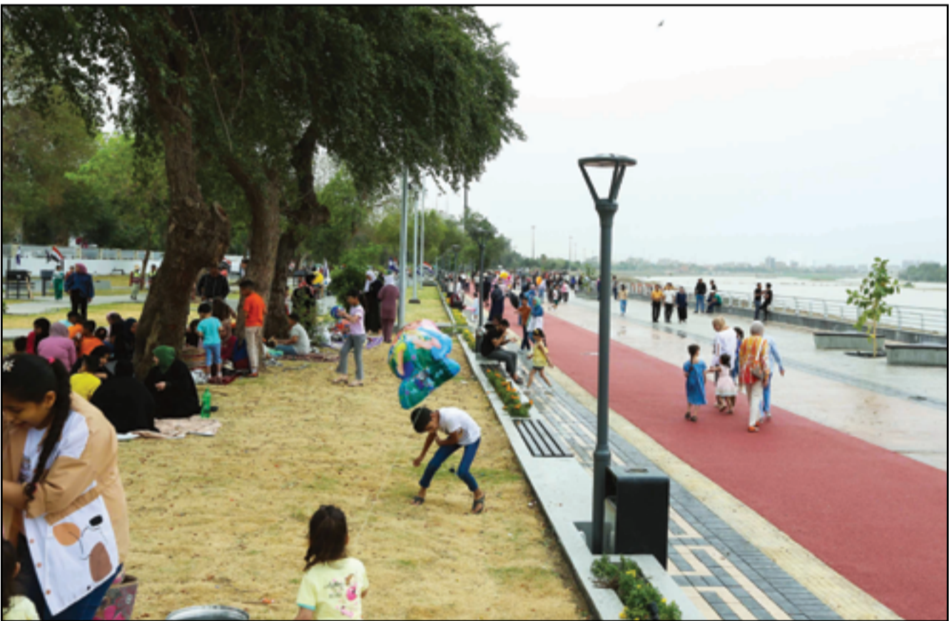
بطة جديدة... حدائق أبو نواس تستقبل العائلات رغم الأمطار..