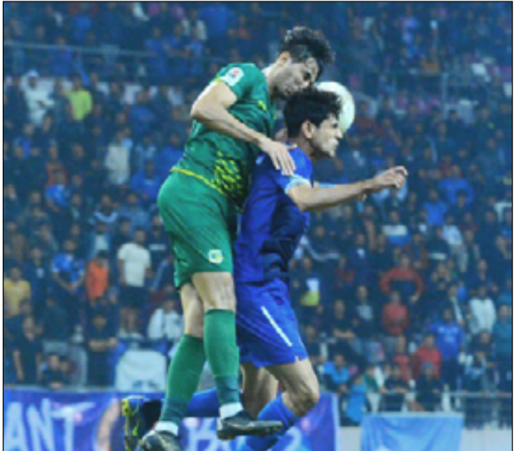
الشرطة يسعى لنقاط صدارة الممتاز