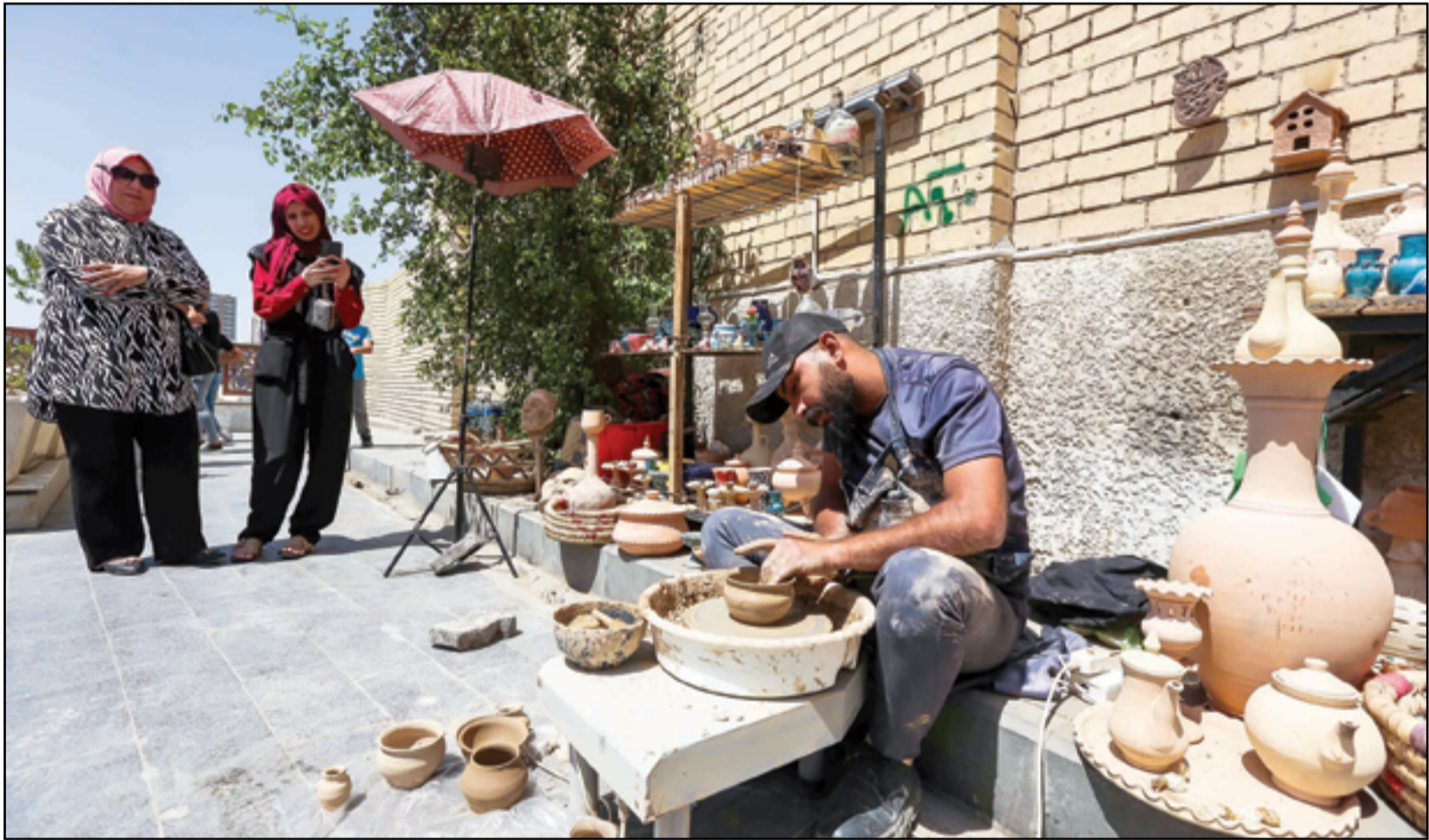
حرفي فخاريات تراثية في شارع المتنبى.. عدسة: محمود رؤوف

اثارت قائمة التعديل الوزاري المرتقبة موجة من الخلافات بين رئيس الحكومة محمد شياع السوداني والقوى والأحزاب السياسية لاسيما داخل الإطار التنسيقي الذي يعززم إصدار تعليمات وبنود تحدد صلاحيات وتحركات السوداني. وفي رد على ما صرح به نواب في ائتلاف دولة القانون عن ان "السوداني تنسم منصب رئاسة الحكومة بناء على المحاصصة وانفاق الأحزاب، والتلويح والتهديد بإقالته في حالة إصراره على "التفريد خارج السرب"، خاصة وأنه "لا يملك سوى (3) مقاعد في البرلمان وصل إليها بعد انسحاب نواب الكتلة الصدرية". جاء الرد بحسب المصادر عن وجود تحركات ولقاءات للقوى الوطنية والنواب المستقلين في دعم إجراءات رئيس الوزراء المتخذة في تغيير الوزراء الذين فشلوا بأداء مهامهم، فضلاً عن الاتفاق على الخطوط