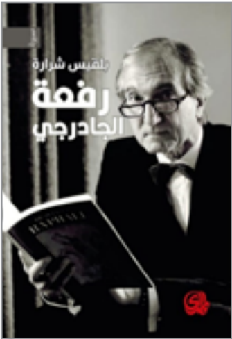
غلاف كتاب رفعة الجادرجي