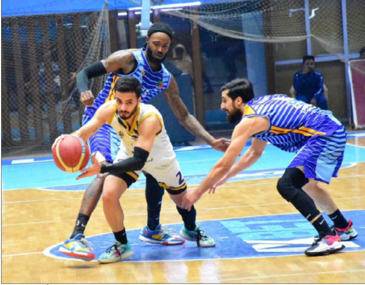
سلة الدفاع الجوي خسرت تقاطعاً ثمينة في المرحلة الأولى

وكشف نضال " أن نظام التجمع أفقد حلالة الدوري ، ولو كانت المباريات تجري بنظام الذهاب والإياب ينتج ذلك الفرصة للمدربين تصحيح أخطاء اللاعبين ، لكن خوض المباراة كل يومين يُصعب من مهمة أي مدرب سواء في حالة