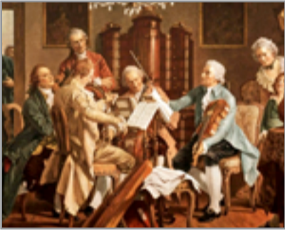
لوحة تمثل جوزيف هايدن يقود ربابي موسيقي (موسيقى الحجرة)

ويبدو ان الاديب الراحل قد وظف فيها خبراته الحياتية والتقنية ودربته الفنية المدخرة منذ ابتدا قاصا واعداطع سبعينيات القرن الماضي قبل ان يجتذبه المسرح الى ميادينه تقدا واخرجا وتاليفا ثم وفوضوية التلاعب بصائر البشر الثقافية. وتتعدد مستويات السرد في الرواية واساليبه وكذلك انواع سرادها مطوعا السرد بشقيه الواقعي وغير الواقعي في المثن الفني الواحد. ونجسد الرواية رؤية فكرية مفتحة بالمآلات المجتمع العراقي منذ سبعينيات القرن العشرين وحتى مرحلة غرقه في دمويته الارهاب والقتل المجاني وفوضوية التلاعب بصائر البشر واعراضهم ومقدراتهم الاخرى. ورسم الروائي الراحل شخصيات روايته ومنهاهداها والبيئة والرقعة الجغرافية التي تتحرك فيها كل مفردات السرد وعناصره بلغة دالة على الخبرة والمهارة وكأنها ليست الرواية الاولى لكتابتها مما من قبل الجمعية لعقود بسبب بعده على الحياة الموسيقية في فيينا والبلاط الإمبراطوري