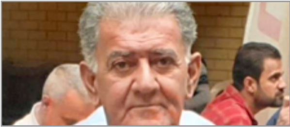
الراحل عدنان منشد

الكتاب يوثق وبالتفصيل سيرة الجادرجي ومنجزه المعماري الكبير، إضافة إلى مؤلفاته التي تخص العمارة