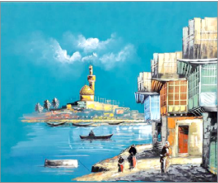
لوحة رسم لاشايل بغدادية

لان المعنى في النص الشعبي خاتل بالمكامن الدقيقة وكان هذا التواجد من سماته التي تمنحه تعالياً واذا اردنا استعاده ما يدعم وجه النظر الثقافية هذه لابند من قراءه نصوص فدعة الزيرجية ومظفر النواب والحاج زاير. ان النص بحكم ما سبق ان رأينا من ضرورة استنادا الي سجل يتمثل في ما اتلقى من انساق في ضوء العلاقة مع المحيط الاجتماعي والثقافي.