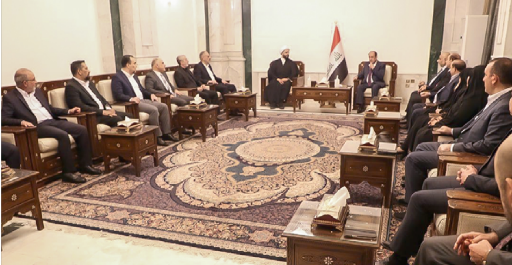
اجتماع سابق بين المالكي والخزعلي

خلافات على موعد وعدد المحافظين الذين سيتم استبدالهم، وبحسب النائب ان «بعض الأحزاب تريد استبدال المحافظين قبل الانتخابات المحلية التي من المفترض ان تجري قبل نهاية العام، لكن السوداني كان يدعم فكرة تأجيل هذا القرار لما بعد الانتخابات لكن قد يتراجع بسبب الضغط».