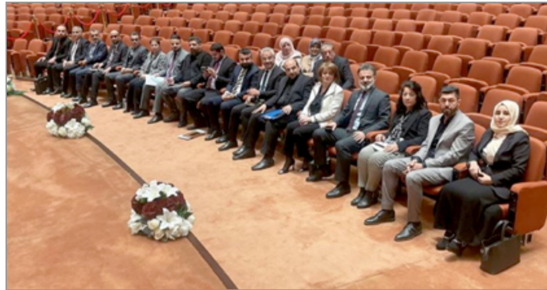
النواب المستقلون دخل البرلمان