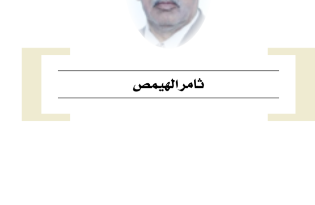
معلوماتي عن المريخ.

لا يسعنا الان ونحن مقبلون كما نسمع ولا نرى ان الشراكة قادمة بين القطاعين العام والخاص، امين ان استثمار تجربة القطاع المختلط النموذجية والتي لا زالت ناجحة حيث الروح المؤسساتية التي لا تهزها الاعتبارات غير الاقتصادية وجدواها. كما ان الشراكة لكي تضمن نجاحها لا بد من استدعاء تاريخها وتفعيله، بالإضافة لمبادئ عامه مقونة مثل مركزية التخطيط ولا مركزية التنفيذ برقابة مالية حكومية مستوفية الضوابط واستقطاعات الضمان الاجتماعي والصحي باجهزة الكترونية، ان التوظيف حسب الكفاءة وليس بموجب الولاء، والمبدأ الثالث هو دفع الانشطة