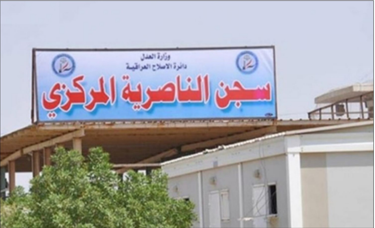
مدخل سجن الناصرية المعروف محلياً بسجن الحوت

المؤشرة في السجن تتراوح ما بين حالتين إلى ٣ حالات شهرياً".