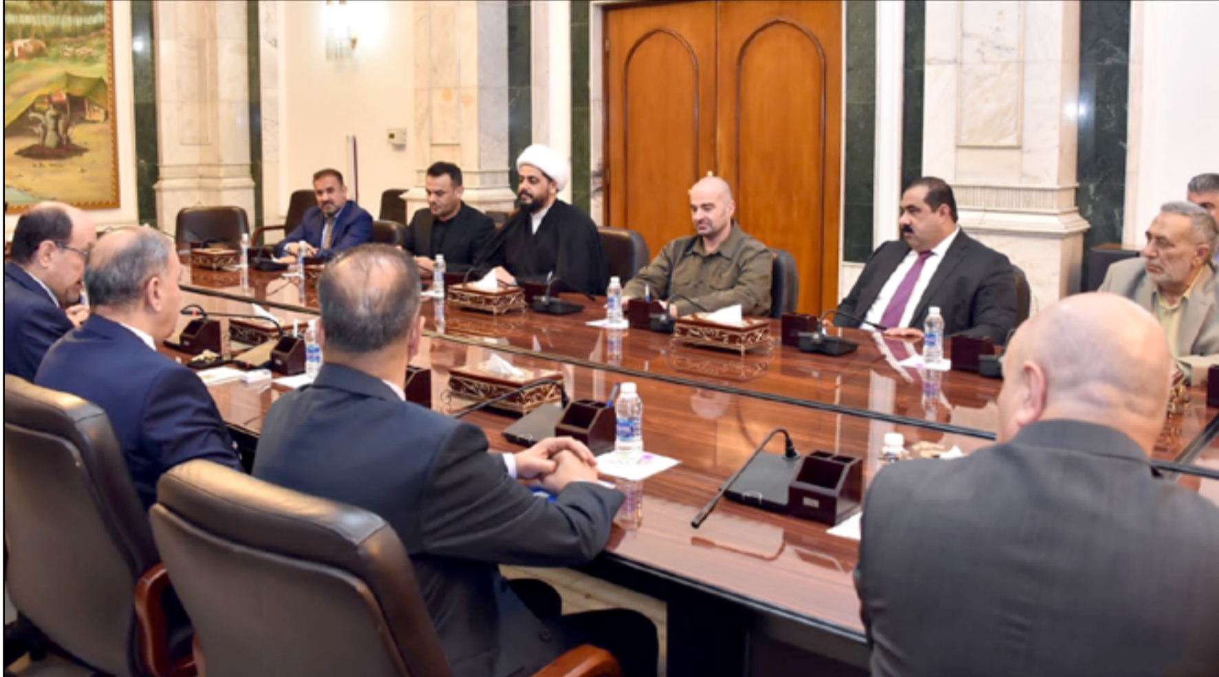
اجتماع سابق لقادة تحالف إدارة الدولة

ويقترض ان ينتهي البرلمان بعد غد الاربعا من نقاشات الموازنة، بحسب مهلة القوى المهيمنة على المجلس، لكن قد يحتاج الاخير الى ضعف المهلة المعلنه على الاقل. وتفيد معلومات حصلت عليها (المدى) من داخل البرلمان بان الترجيحات تذهب الى ان اقرب وقت لحسم مناقشات الموازنة هو في "20 ايار المقبل او نهاية الشهر الحالي". وقابلت اللجنة المالية التي تجتمع يوميا نحو 12 ساعة على فترتين نهائية ومساندة، حتى الان 11 وزيرا اخرهم وزير الداخلية عبد الامير الشمري. وتخطط اللجنة لمناقشة الموازنة مع كل