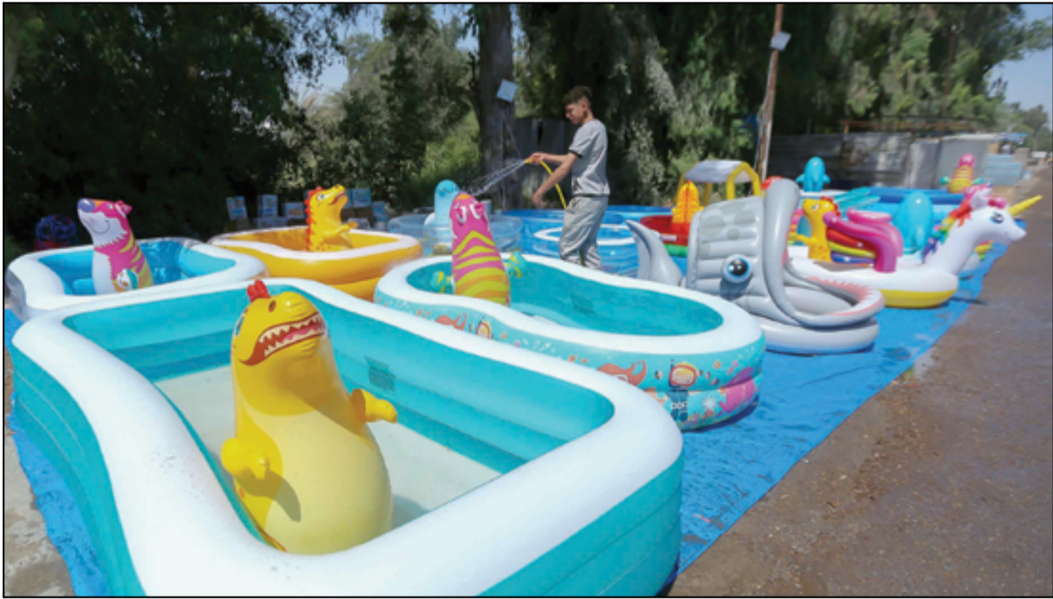
انتشار بيع مسابح الأطفال مع قرب حلول فصل الصيف .. عدسة: محمود رؤوف