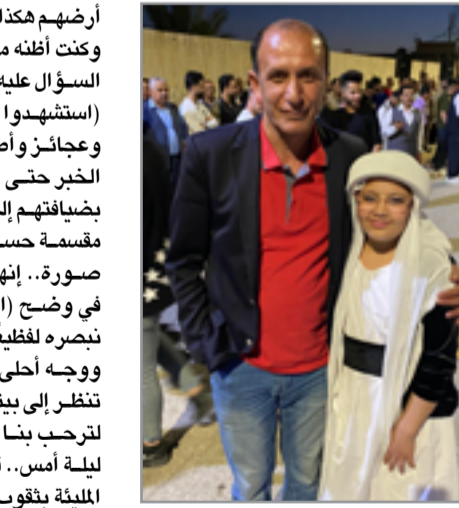
الكاتب مع طفلة أيزيدية فحنن إزاء السنة (6725) العراقية الأصل وهي أضعاف مضغفة من تقاومينا: الميادية والهجرية..

أرضهم هكذا دفعة واحدة؟ صمت السائق وكنت أظنه منشغلاً بأمر آخر وحين كررت السؤال عليه أجاب بهمس بالكاد سمعته: (استشهدوا جميعاً!!) نساءً ورجالاً والخبر حتى أخطنا الأصدقاء الذين نحن بضياقتهم إلى قاعة مليئة بالصور الفردية مقسمة حسب العوائل بما يقارب الألف صورة.. إنها لأبناء القرية المغدورين في وضج (العراق)؛ تبدلت أحوالنا فما نصره لغلغلي. صورة أجمل من صورة، ووجه أعلى من وجه، وتكاد كل صورة تنظر إلى بيتها المهجور ثم تدبر النظر لترحب بنا كما رحب أخوتهم الأحياء ليلية أمس.. قنادني الهلع إلى تلك الديار المليئة بقبور الرصاصات الإسلامية وهي تكبر إلى وتمدده على (القفري) بهم.. هل انذهلت كل مرضعة عما أرضعت؟ هل التفت الساق بالساق يوم جي بهم ليناووا حكم (الخليفة) العادل!!.. وما بين ركام الطين المائل والحيطان المهمة وإذا بلوحة تبرز من ركاب الوجود مكتوب عليها (دكان) وفي نهايتها (الله) وخفي ما بينها حاولت قراءة المخفي فضع علي المضاف إليه من الدكان غير أنني لحث موقع كلمة الله إنها بقايا رسم للعلم العراقي، الذي رفعه صاحب الدكان مفتخرًا به لأنه علم بلاده ولا يدري بأن هذا الدال سيكون شعار القائلين: كانت مساحة الحزن هائلة ومساحة الصمت أهول؛ حتى أقترح علينا الشيخ لهم لأنه مهما اختلف سمبائعي فهو بعد ديني. لا شرعية لأخر لا يؤمن به.. أيمانهم بمعقداتهم تسهل الطرق لمن يطعم بهم وهو الإيمان نخسه الذي جعلهم (شقائق العراق) التي لا تفشى الجذب، فتفض من قلب التراب اليابس مليئة بألوان الحياة.