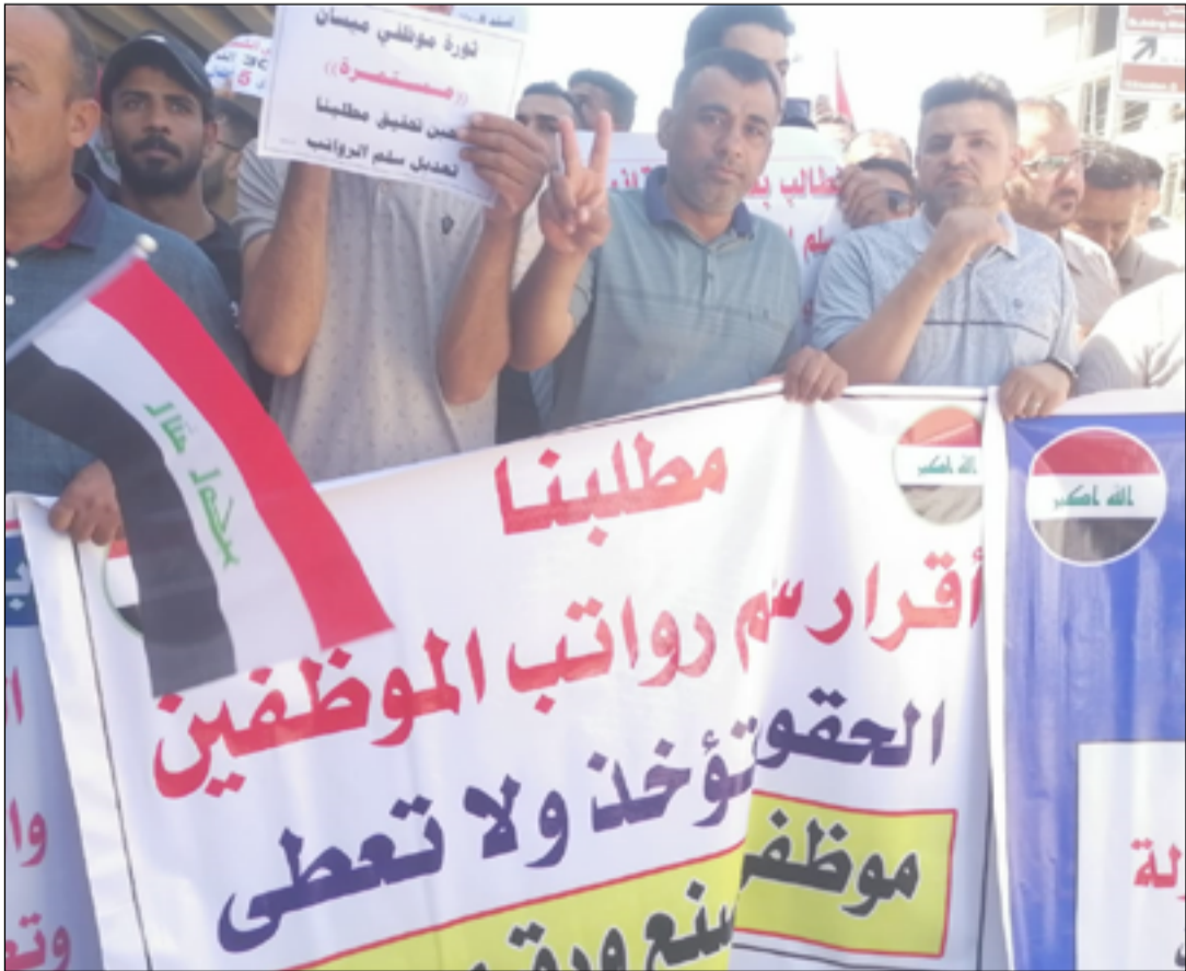
تظاهرات تطالب بالإسراع في اقرار سلم الرواتب

عمل على تحويل الحكومة لرفع نسبة الرواتب المتدنية من اجل انصاف شريحة اصحاب الرواتب الدنيا". ويؤكد النائب عطوان العطاوي "المضي بخطوات تعديل سلم رواتب موظفي الدولة بما يحقق العدالة، لافتا الى ان سلم الرواتب الجديد معروض حاليا على لجنة من الخبراء لإعطاء الرأي الأخير ومن ثم يتم تحويله إلى مجلس الوزراء للصادقة عليه". وتابع العطاوي، أن "السلم الجديد يحدد الزيادة في رواتب الدرجات الدنيا بأنها ستكون بنسبة 100%". وأشار، إلى أن "الحد الأدنى للراتب الاسمي (الدرجة العاشرة) سيكون 420 ألف دينار، وبذلك سيكون بموجب القانون الجديد ستمنح 50% مخصصات تحسين معيئة لجميع الموظفين". لكن استنادا للاقتصاد نبيل الرسومي، ذكر أن "السلطتين التنفيذية والتشريعية إذا كانتا جادتين في إعداد سلم جديد للرواتب يحقق نوعا من العدالة الاجتماعية بين الموظفين، فإنه يمكن تحقيق ذلك من دون اضافة تخصيصات مالية جديدة إلى الموازنة العامة". وتابع الرسومي، أن "ذلك يكون من خلال إلغاء الرواتب المكررة والمزدوجة التي تصرف لبعض فئات المجتمع لأسباب سياسية، وكذلك تخفيض رواتب ومخصصات الدرجات الخاصة وبعض فئات الموظفين في الدرجات العليا، واستخدام الفائض المالي المتحقق في رفع رواتب الشرائح الدنيا من الموظفين لتحقيق نوع من التوازن في الرواتب". ولفت الرسومي، إلى أن الامر إذا كان غير ذلك فهذا يتطلب إضافة 11 تريليون دينار لتغطية تكاليف السلم الجديد، ويجب على الحكومة واللجنة المالية تضمينه في موازنة 2023". وشهدت المحافظات العراقية قبل أيام تظاهرات لعدد من الموظفين، مطالبين بتوحيد سلم الرواتب والقضاء على الفوارق في المخصصات بين وزارة