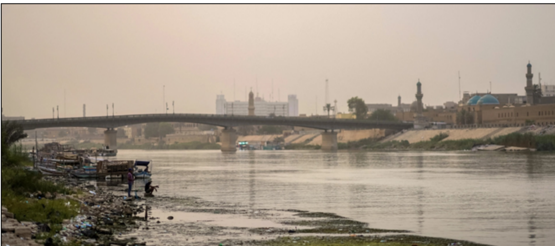
مصدر مجهول ينتظر نهري دجلة والفرات بسبب قلة المياه

وبين شمال، أن "هذا الامر القى بظلاله على الواقع المائي العراقي وتحديدا في المحافظات الجنوبية وهي البصرة وذي قار وميسان". ولفت، إلى "إجراءات اتخذتها الوزارة بداية من الموسم الشتوي بخزن أكثر من يمكن خزته لتعزيز الخزين الاستراتيجي واستخدامه في موسم الصيف". وتحدث شمال، عن "تطبيق سياسة توزيع مياه ومناوبة ومراسنة صرامة للسيطرة على توزيع المياه على سفنتي الأنهر، مع عدم اطلاق أية إضافات مائية على نهري دجلة والفرات إلا للحاجة