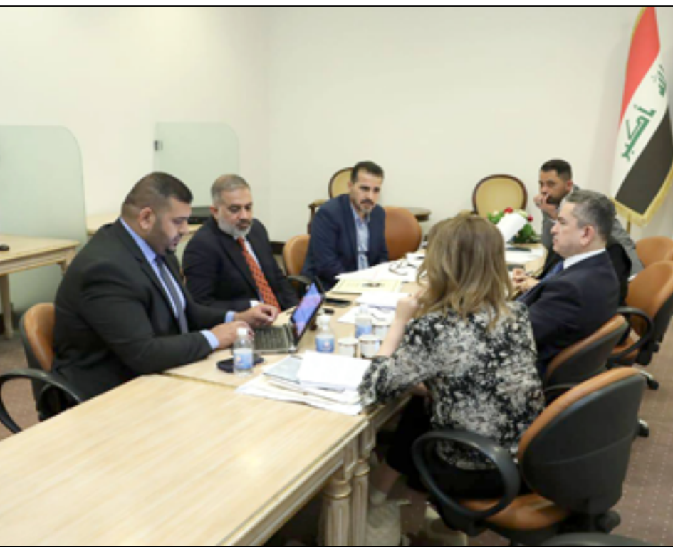
لجنة فرعية في المالية النيابية تناقش وضع المسامات الأخيرة للموازنة

ونك نهاية الأسبوع الحالي». ولفت، إلى أن «اجتماعات المناقشة بين الأبواب ما زالت مستمرة لاسيما داخل اللجنة المالية»، مشدداً على أن «تحالف إدارة الدولة داعم لأي إجراء من أجل الإسراع في اقرار القانون». وأورد البنداوي، أن «بياناً فنياً سوف تتم تلاوته في البرلمان، يستعرض جميع التعديلات التي أجريت على الموازنة حتى يطالع النواب على كافة التفاصيل والمساعدة في اقرار القانون». وشدد، على أن «ما تبقى لإقرار القانون هي قضايا فنية تتعلق