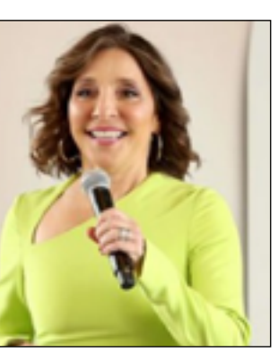
سينقل إلى منصب رئيس مجلس الإدارة التنفيذي ومسؤول التكنولوجيا،

الإشراف على المنتجات والبرامج وأجهزة الكمبيوتر، وفقا لصحيفة "وول ستريت جورنال". في حين تعمل ياكربو منذ أكثر من عقد مديرة للإعلانات والشركات العالمية، ولها دور كبير في إيجاد أفضل الطرق لقياس فعالية الإعلانات بحسب الصحيفة، كما لها دور كبير في إطلاق خدمة "بيجوك" للبيث. وأتى إعلان ماسك عن رئيسة تنفيذية جديدة قبل أيام من التي تجريها "ان بي سي يونيفيرسال" في نيويورك، بدوره، أوضح المتحدث من "ان بي سي يونيفيرسال" للصحيفة أن