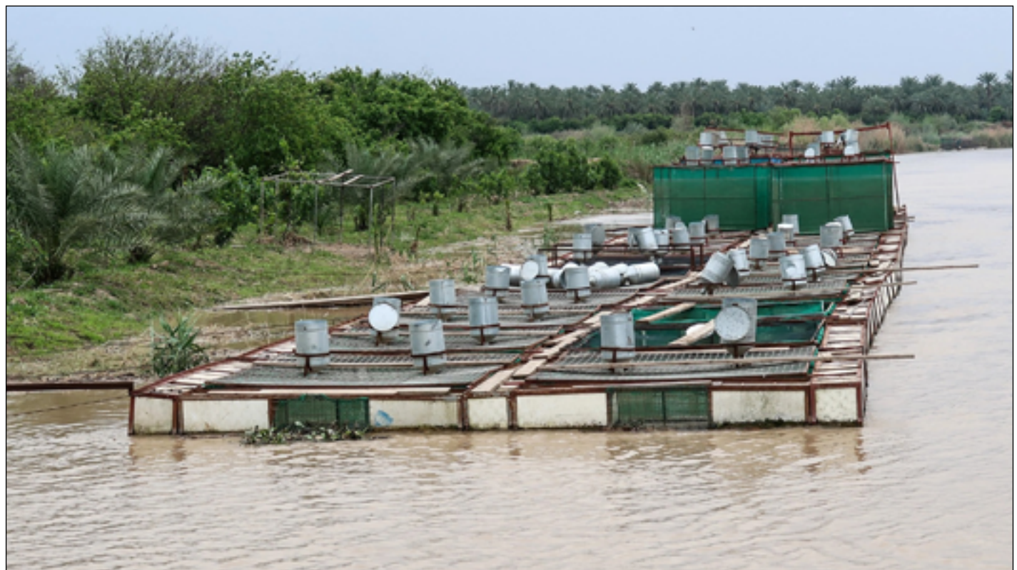
بحيرات الاسماك تستنزف كميات لا يستهان بها من واردات الانهر

الصحيحة ومنع التجاوزات لاسيما بحيرات الاسماك التي تستهلك كميات مياه كبيرة". وتحدث العتاي، عن ان "توجه الوزارة يتمثل بالري المغلق ومغادرة الري السحيق أو الري المفتوح، وهو ما سيمنع التجاوزات والتبخر،