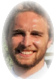
ثيو نينسيني × ترجمة: عدوية الهلالي

المركزية الأمريكية عن كتب مع قوات الأمن المحلية والإقليمية لمواجهة هذه الجماعات، مع تطوير استراتيجيات لمنع التطرف في المنطقة.