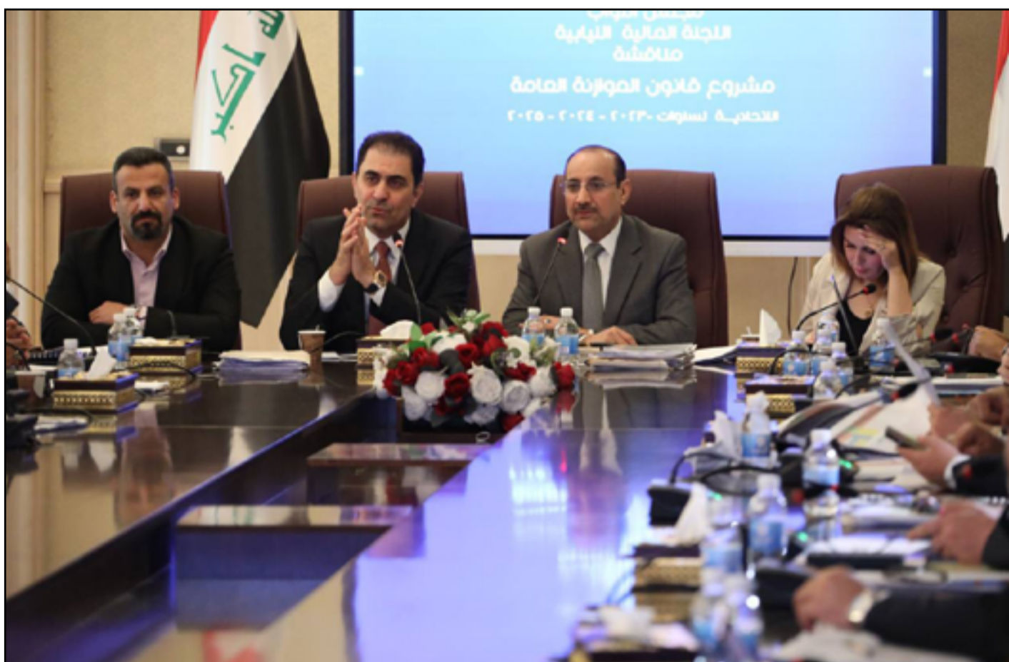
حوارات مكثفة داخل اللجنة المالية لإنضاج قانون الموازنة