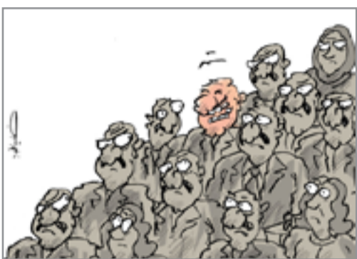
من رسومات الحميري

تسريع ايضاح فكرة الرسم، وتؤدي وظيفتها دون الاخلال بالشكل الفني الذي يعمل عليه فلاتجدها عبثا وانما اضافة لصلب الرسم وتجنبه من ان يكون توضيحيًا فقط، فتفاعل التعليق المكتوب في فقاعة التعليق يعد تشكيلا بصريا لا يؤثر على الرسم بل يصيغ معه كتلة ضرورية، تركزه وتزيد من المتعة في مشاهدته. من المعروف ان التعليق الذي ظهر في المراحل الاولى لتطور الكاريكاتير الحديث كان يشكل المركز الذي يخدمه الرسم ويبدو وكأنه (اي التعليق) موضوعا يزيّنه الرسم، الا انني ارى في ما اجترحه الحميري في اعماله المنجزّة جعل فيها للرسم اولوية لتكريز نظر المتلقي ويأتي التعليق مرافقا متوازيا معه ويعمل على تركيز تلقية، ويميز التعليق لديه باستعارات لفظية مقننة وتمتع بطرافتها وحسن الفكاهة والسخرية اللاذعة فيها، لذلك استخدم الحميري قدرته في استخدام اشارات شكلية مهمة لتسند مآكرته وقدمها كاجراءات تنفيذية تستحسون على الانتباه ومنها حركات الوجه واتجاه المتكلمين والمهتهين لها وهي افكار او جدها العصر وتحدياته، فيبتذل من اكثر الموضوعات التي تتعلق بحياة المواطن الى افرازات الحدث السياسي وكل ما يهدد وجود الانسان ويؤثر على نوع الحياة التي يحيهاها وتلك كما اشوع تتطلب سرعة في التناول وقدرة على المعالجة واسلوب يقترب الى التقشف في البناء الشكلي بما يتبع اضاءة مباشرة على الموضوع وقوة في الإشارة تعتمد بالاساس على خبرة الفنان ومران اسلوبه.