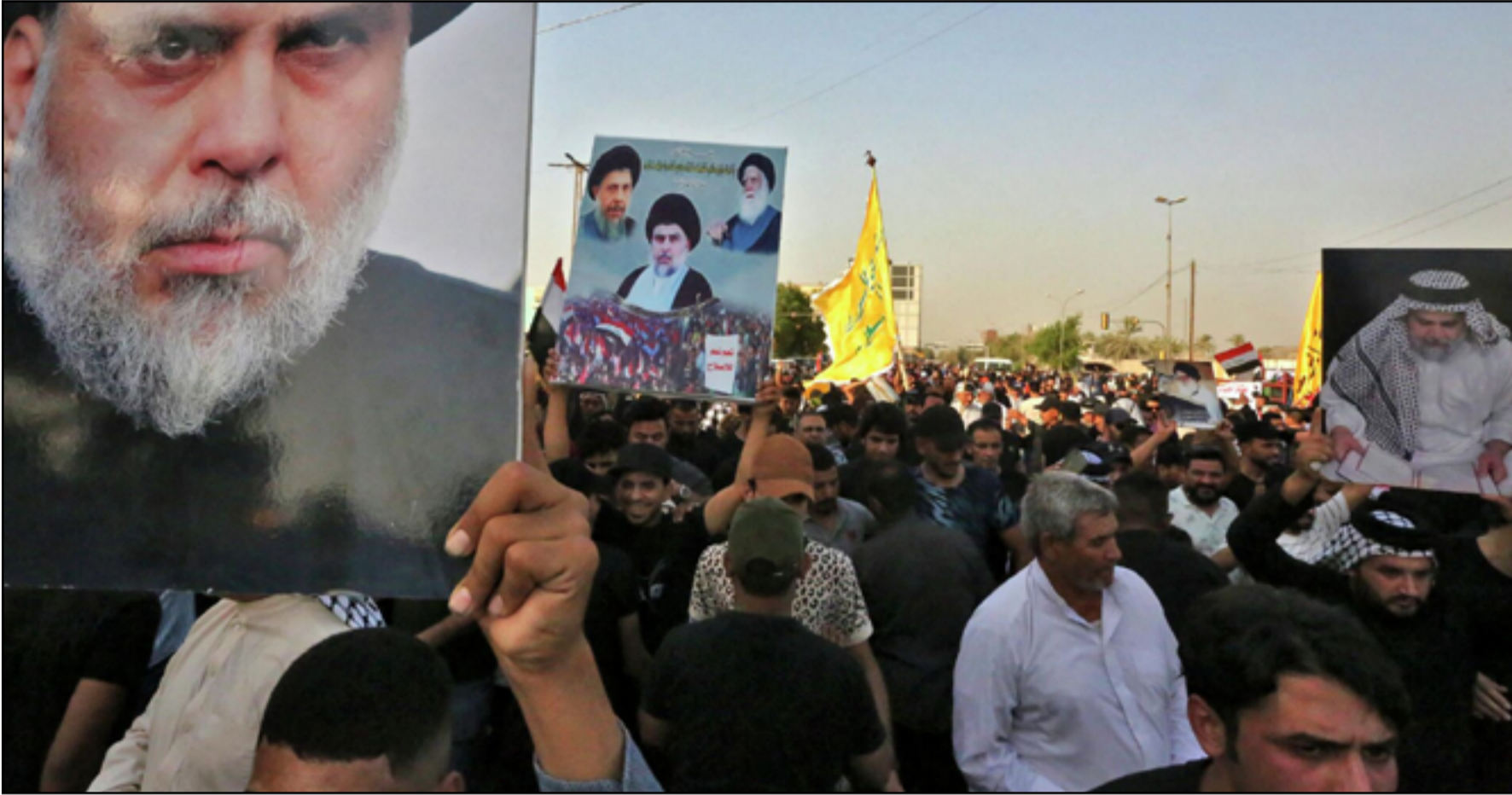
□ بغداد / تميم الحسن

تجري محاولات في داخل القوى الشعبية للتلميح بان ما يعرف بـ «أصحاب القضية» مدفوعين من مقتدى الصدر زعيم التيار الصدري، الذي أعلن سابقاً براءته من تلك المجموعة التي تدعي ان الأخير هو الإمام المهدي. وترى بعض الاطراف الشيعية ان الصدر هو المستفيد من إثارة هذا الموضوع لإيجاد مبرر للخروج من حالة العزلة السياسية التي «تورط بها» العام الماضي، ورفضها مقربون منه ما دفعه بالنهاية الى تبني خطة لترميم انصاره عبر ما عرف بوثيقة «تعهد الدم». لكن هذه الاتهامات ترفضها اوساط الصدر التي تؤكد بان هذه المجموعة «منحرفة عقائدياً» وهي ذراع لتيارات سياسية معارضة للتيار تتحرك في هذا التوقيت بسبب اقتراب الانتخابات المحلية التي قد تشهد عودة الصدر مرة اخرى الى النشاط السياسي. كما يرى بالمقابل مراقبون ان «أصحاب القضية» هو فريق يشكل خطراً على الصدر ليس سياسياً فقط، وانما قد تقوم هذه المجموعة بـ «تصفيته» خصوصاً وان هناك مشاريع من خصوم زعيم التيار تتبنى خطة ازاحة الصدر الى الأبد.