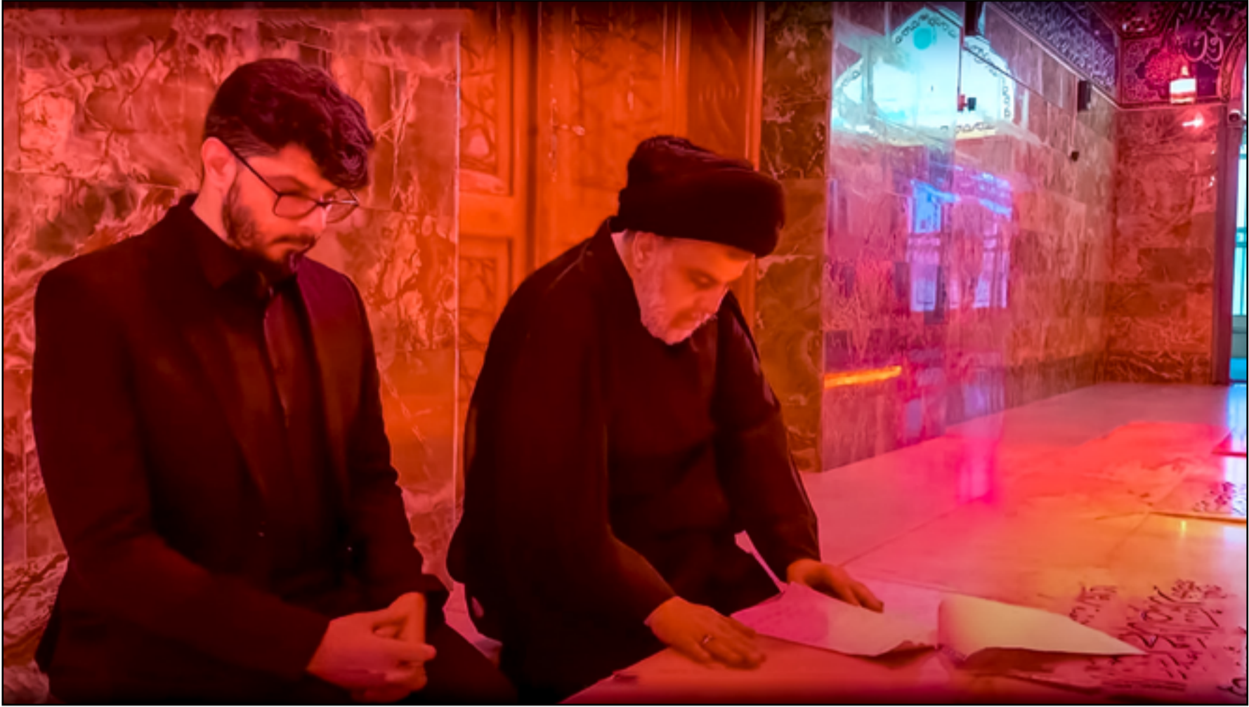
زيارة الصدر الى قبر والده امس الاول