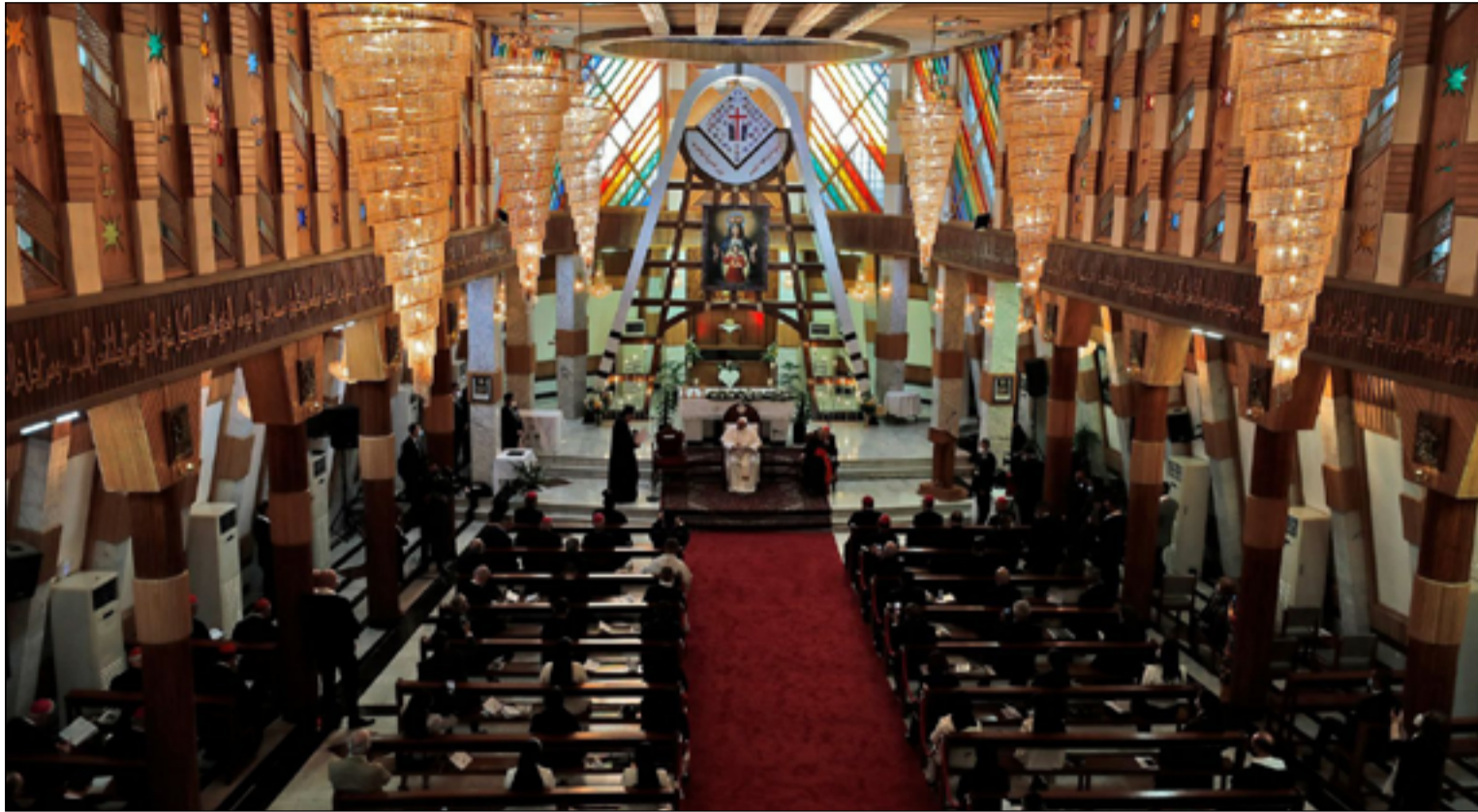
البابا أثناء زيارته كنيسة سيدة النجاة وسط بغداد

تنظيم داعش قد دمر حياة الأقليات الدينية في البلد، معدل البطالة في القرى المسيحية يصل إلى 70٪، إذا لم يحصل الناس على فرص عمل، فإنهم قد يفكرون بالهجرة". وعلى صعيد متصل، يتحدث المطران وردة عن توفير أكثر من 530 فرصة عمل موزعة بين مستشفى مريم، المحلي وجامعة أربيل الكاثوليكية مع أربع مدارس محلية". ويقول ستييفن راشي، مواطن أميركي خدم في الكنيسة الكاثوليكية الكلدانية في العراق منذ العام 2014 والذي كان حاضراً عبر مرحلة التعافي التي عاشها المسيحيون عقب الحاق الهزيمة بداعش، إن "المسيحيين في العراق يبدون رؤية اهتمام أكثر جدية من قبل المجتمع الدولي وتركيز جهودهم تجاه أبناء الأقلية في العراق". وأشار راشي، إلى أن "جهود ابدلت في هذا المجال من قبل الخارجية الأميركية ومنظمة (USAID) ومنظمات أميركية أخرى". زيارة البابا فرنسيس استقطبت اهتماماً بوضع المسيحيين ووفرت دعماً مؤقتاً لهم،