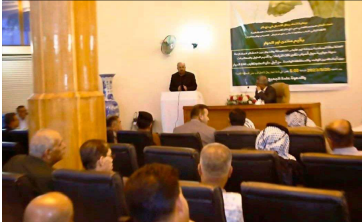
جانب من الندوة الحوارية

عازمة على مواصلة تطبيق القانون وفرض هيبة الدولة وعلى الجميع التعاون مع تلك القوات للحفاظ على حالة الأمن والاستقرار في المحافظة". وتمخضت الندوة الحوارية التي عقدت على قاعة اتحاد رجال الأعمال في ذي قار عن جملة من التوصيات أبرزها "ضرورة إعلان القوى المجتمعية دعماً للقوات الأمنية وتوفير الغطاء الشعبي ودعم مساعيها لفرض هيبة الدولة"، مشددة على "ضرورة اسراع القوات الأمنية في تنفيذ إجراءات القبض على المطلوبين وعدم التهاون أو المجاملة على حساب القانون".