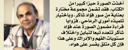
أخذت الصورة حيزا كبيرا من الكتاب، فقد تضمن مجموعة مختارة بعناية من صور فؤاد شاعر، وباختيار لتمثله أموري الرماحي. فزوايا قراءة مضمون الصورة عند فؤاد شاعر تتعدد تبعاً لتباين واختلاف مستويات الفهم والإدراك وعلى هذا فإن كل متلق يفسر على هواه.

ومن هنا يأتي عنوان ذاكرة المدينة متوافق تماما مع منجز الراحل فؤاد شاعر.