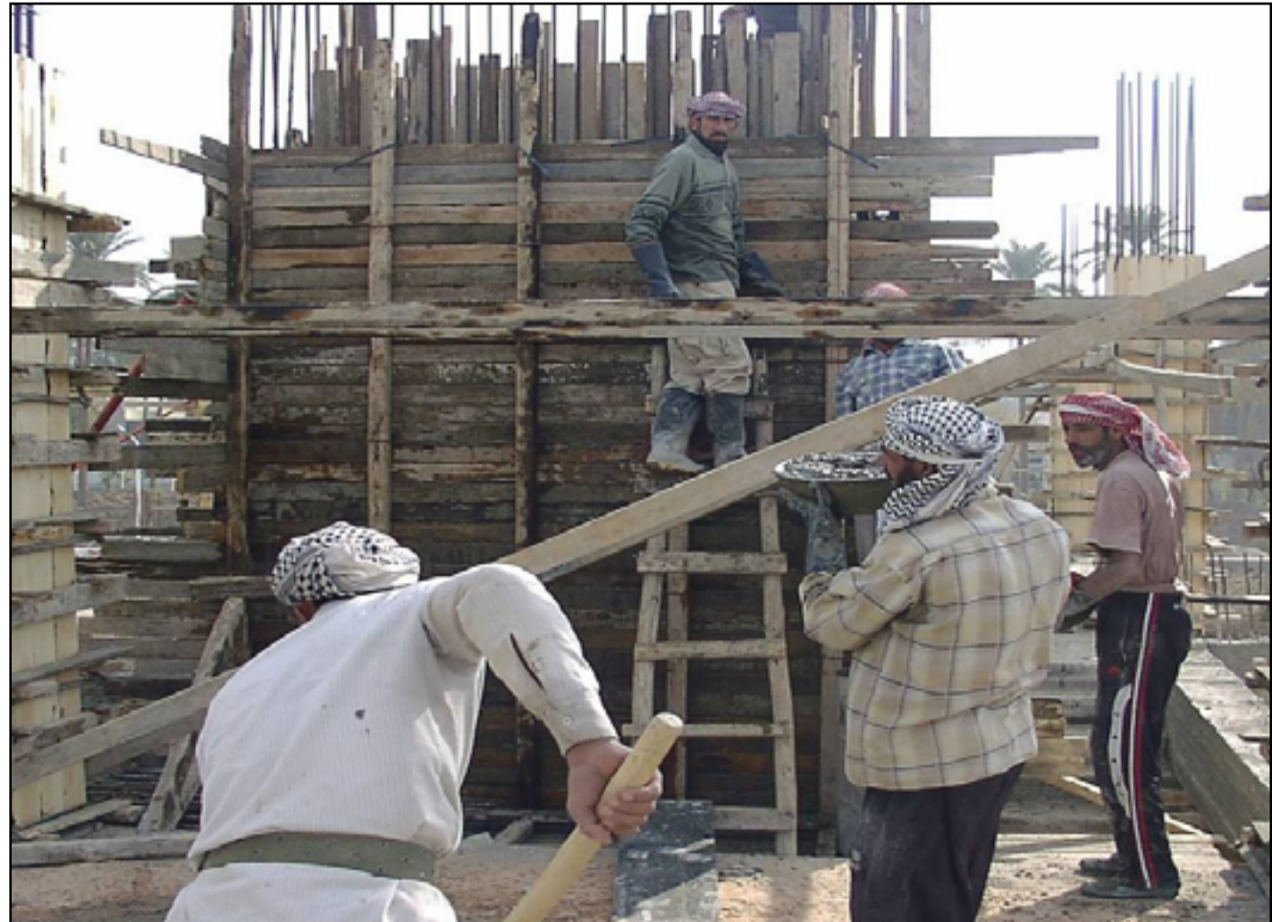
العمال يأملون بقانون ينصفهم ويوفر لهم الضمان

وأفاد، بأن "مشاركة الدولة في اشتراك الاستقطاعات التقاعدية للعامل المضمونين سواء الذين هم ضمن القطاع المنظم أو غير المنظم، هو أمر إيجابي يحصل لأول مرة في العراق، ويأتي اتساقاً مع جميع الالتزامات الدولية بشأن دعم العمال". وانتهى عرب، إلى أن "هذا الامتياز