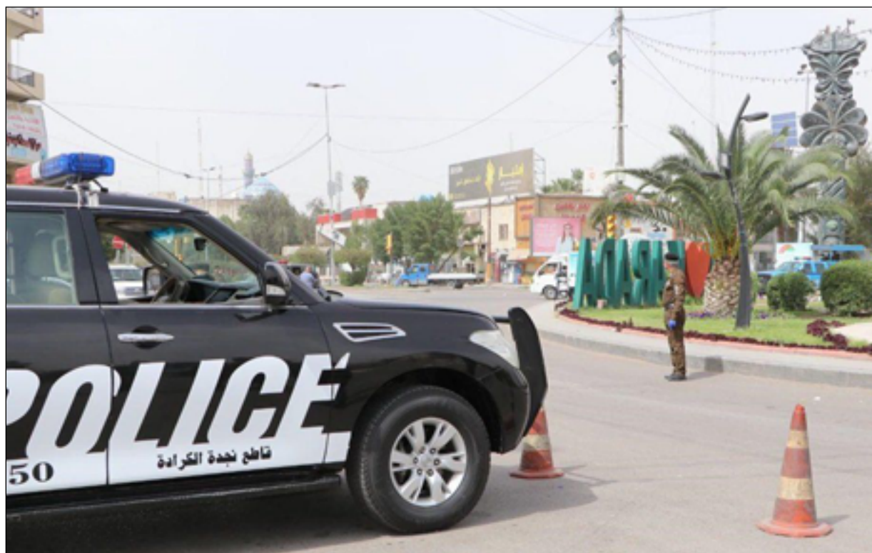
مفرزة للشرطة وسط بغداد

وتابع، "تم على الفور التحري الدقيق وجمع المعلومات الأمنية التي تمكنت من خلالها قوة يامرة أمر الفوج الثالث اللواء العشرون شرطة اتحادية بالاشتراك مع مركز شرطة الثورة من القاء القبض على الجاني بوقت قياسي، حيث تم تسليمه اصولياً إلى الجهات