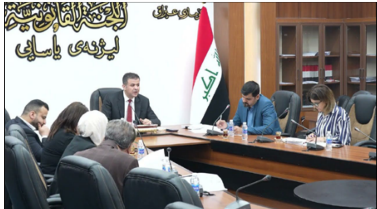
اللجنة القانونية النيابية

أن "اللقاء بحث أهمية دور مجلس النواب في سن وتشريع القوانين المهمة التي نص الدستور على تشريعها سيما تلك المتصلة بمتطلبات المواطنين والتي تعمل على تحسين الأوضاع المعيشية والخدمية وتوفير أفضل الخدمات لهم". وتابع البيان، أن رئيس الجمهورية وجه هيئة المستشارين والخبراء في رئاسة الجمهورية بالتعاون التام مع اللجنة القانونية في مجلس النواب من أجل تقديم حزمة تشريعات متكاملة وفق الحاجة الفعلية". وأشار، إلى أن "رئيس الجمهورية وجه بضرورة الإسراع في إعادة النظر بقرارات مجلس قيادة الثورة المنحل، وتحدث عن الجهود المبذولة من قبل رئاسة الجمهورية لمتابعة قضايا الموقوفين والمعتقلين ومن انتهت مدة محكومياتهم". وفي هذه الأثناء، أشار رئيس اللجنة القانونية النيابية، بحسب البيان الرئاسي،