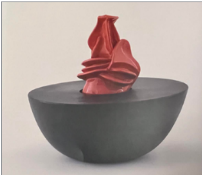
من أعمال العزاوي