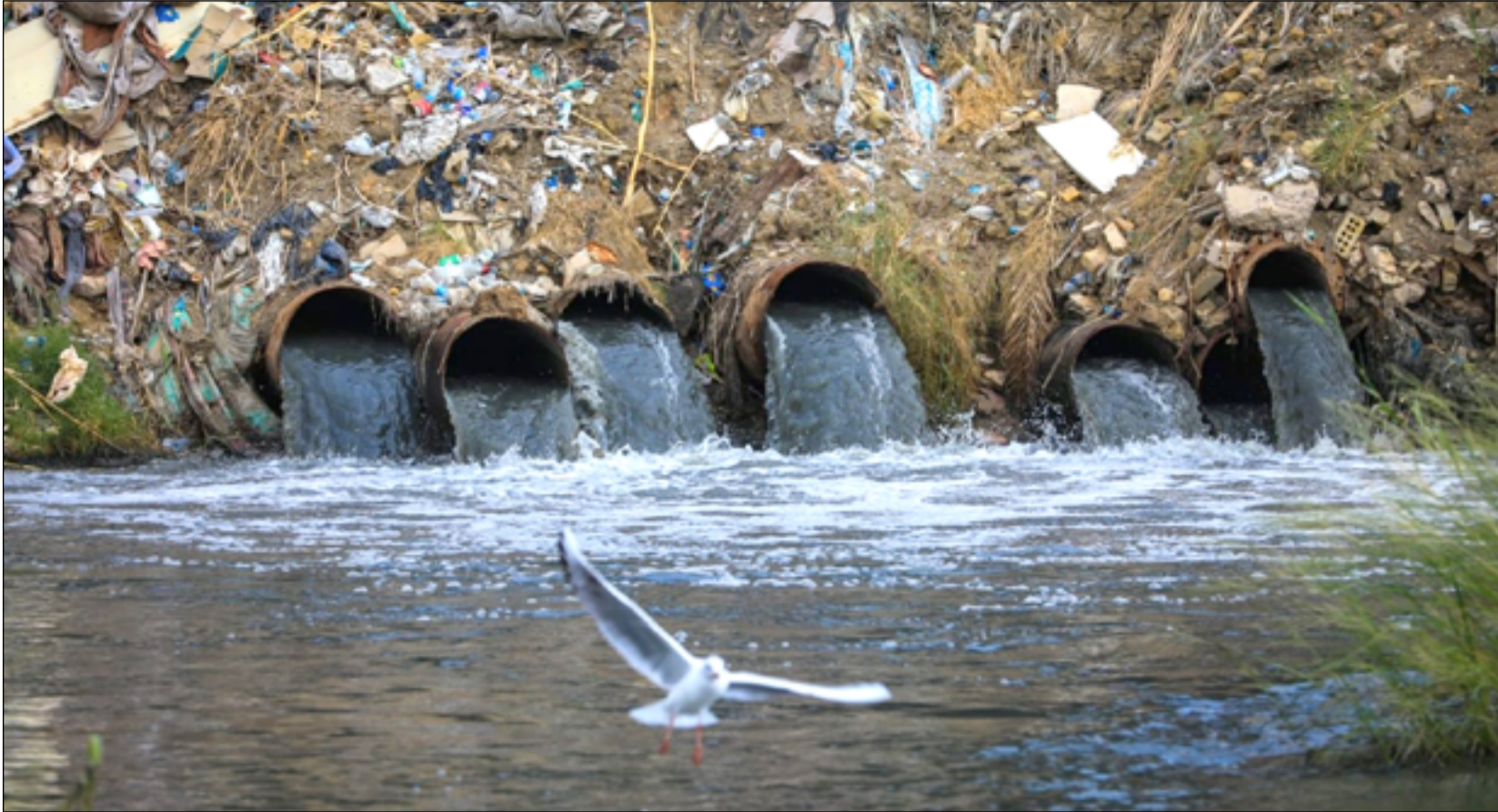
العراق مقبل على موسم جفاف حاد بسبب قلة الواردات المائية

العراق مقبل على موسم جفاف حاد بسبب قلة الواردات المائية وشهد التقرير، على أن "العراق تعهد في وقتها بتقليل نسب حرق الغاز في حقوله النفطية والغازية والتحول بالترجيح نحو استخدام الطاقة النظيفة البديلة عن الوقود السائل والأحفوري بالاعتماد على الغاز الطبيعي وتطوير الاكتفاء الذاتي بالطاقة من خلال توسيع تكنولوجيا الطاقة البديلة". وأرف التقرير، أن "العراق ما زال لغاية الوقت الحاضر يعتمد على النفط دون أن يحقق تنوعا في مصادر اقتصاده". وتابع التقرير، أن "صادرات النفط تشكل نسبة ٩٠٪ من واردات الحكومة"، مبيّناً أن "قطاع