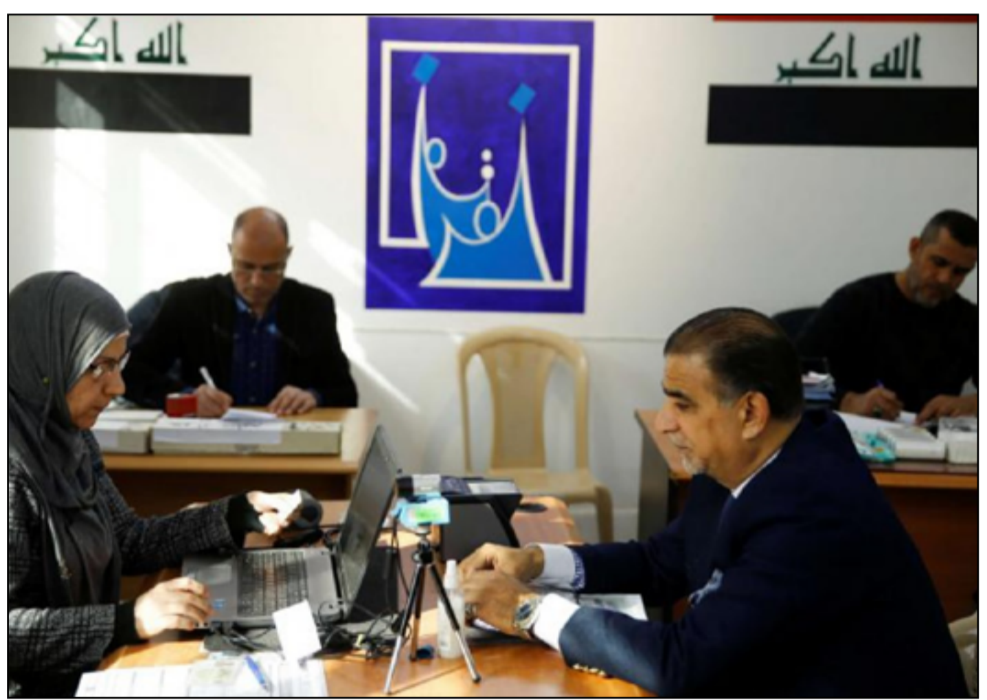
من عمليات تحديث سجل الناخبين في بغداد