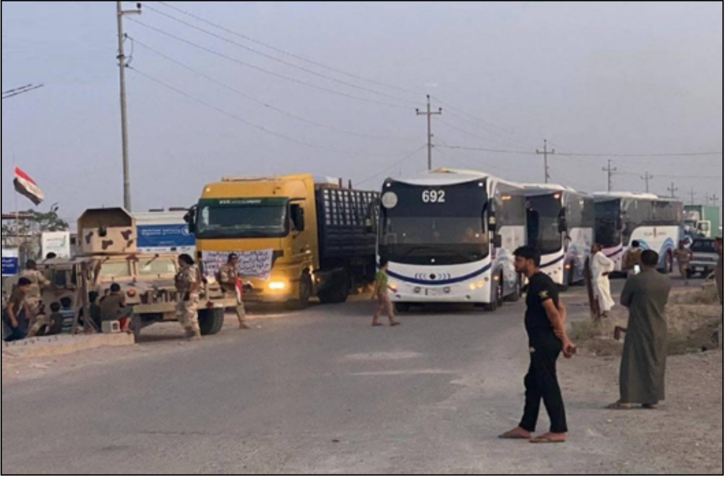
قافلة تحمل نازحين عائدين إلى ديارهم