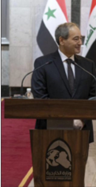
المؤتمر الصحفي لوزير الخارجية مع نظيره السوري في بغداد أمس

وأضاف: "تطرقنا إلى بعض القضايا التي تتعلق بسوريا في أوروبا والعراق سيشترك في مؤتمر بروكسل، حيث سنطرح فيه وجهة نظر الوزراء التي تمت الموافقة عليها من قبل الجامعة العربية، كما سنلقي النظر على الوضع المزري الصعب من جانبه، قال وزير الخارجية