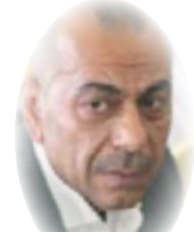
حيدر نزار السيد سلمان

محمد شياع السوداني أول رئيس وزراء عراقي بعد 2003 من أهل الداخل ، فهو عاش ظروف العراق الصعبة والأشد قسوة ، وهي ميزة كانت ولا زالت تشكل معيارا شعبيا مناقضا لسيطرة القادمين بعد الغزو كحكام للبلاد .