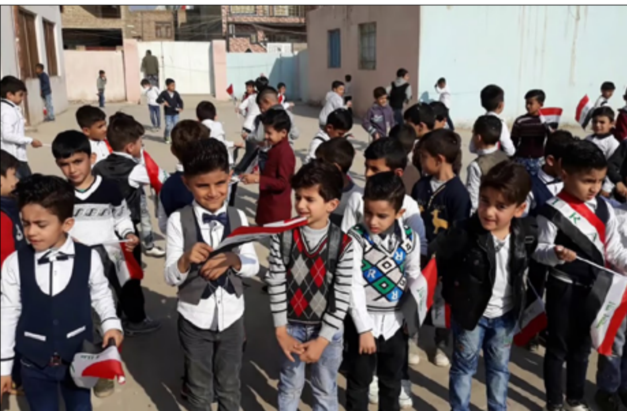
العراق يعاني من نقص كبير في الأبنية المدرسية والملاكات التعليمية

المركزية للوزارة، وكذلك انخاف وتم اشغال أبنية مدرسية عديدة تم استلامها من الحكومة المحلية بعد أن نفذت وفق تخصيصات تنمية الأقاليم، لافتاً الى أن "المحافظة بحاجة مستمرة لتشديد المدارس لأكثر من ٤٥٠ لبناية مدرسية". وكانت الإمانة العامة لمجلس الوزراء قد كشفت في وقت سابق، عن استمرار العمل لبناء ٥٢ بناية مدرسية في ميسان ضمن الاتفاقية الاطارية الصينية العراقية (القرض الصيني)، وأن هناك وجبة أخرى تمثل المرحلة الثانية من الاتفاقية. ويعد ملف الأبنية المدرسية واحداً من المشكلات المعقدة في العراق، حيث تسعى الحكومة إلى معالجته من خلال تشييد عدد كبير عبر مجالات مختلفة، لكن تلك الجهود يعرقلها تأخر إقرار الموازنة.