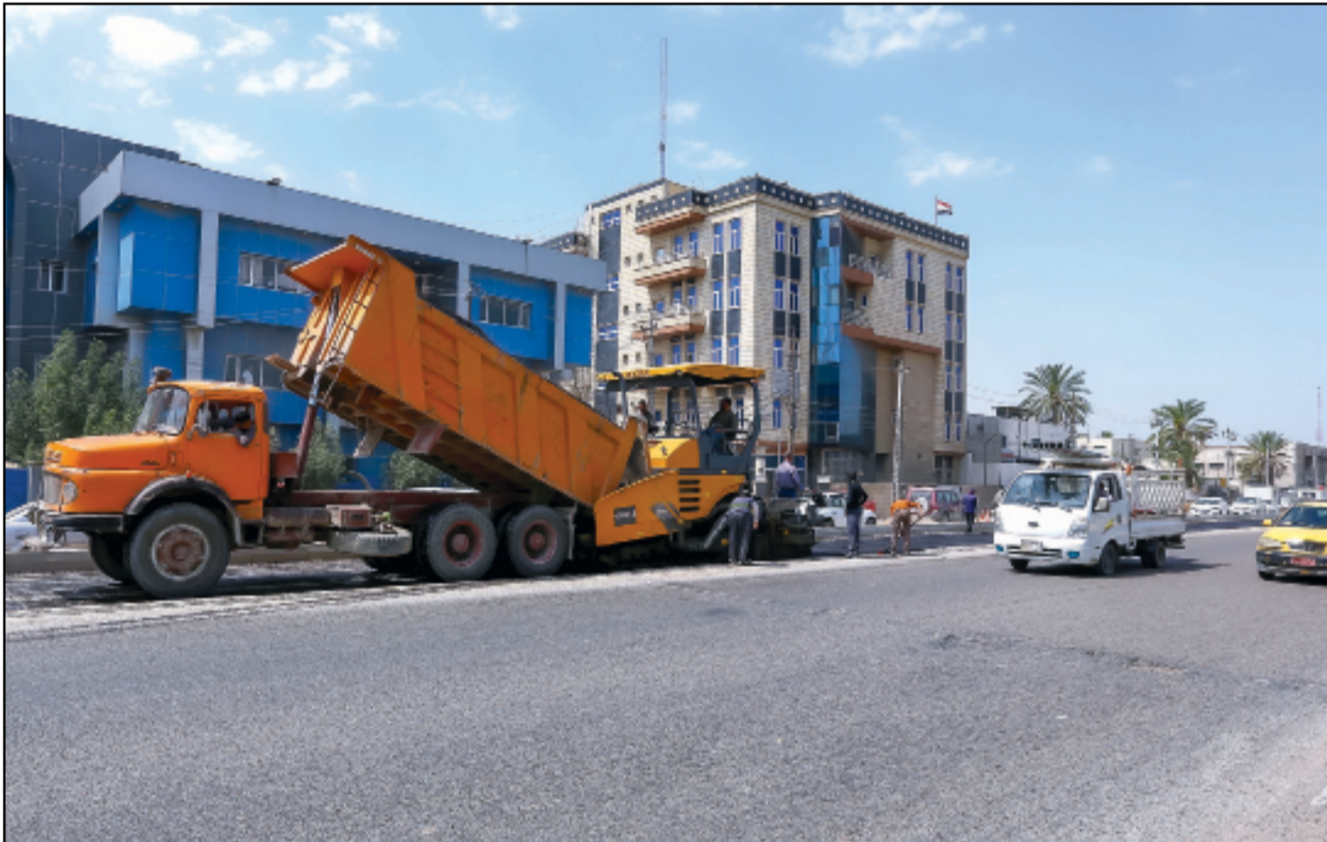
استمرار حملات تخطيط شوارع العاصمة بغداد...