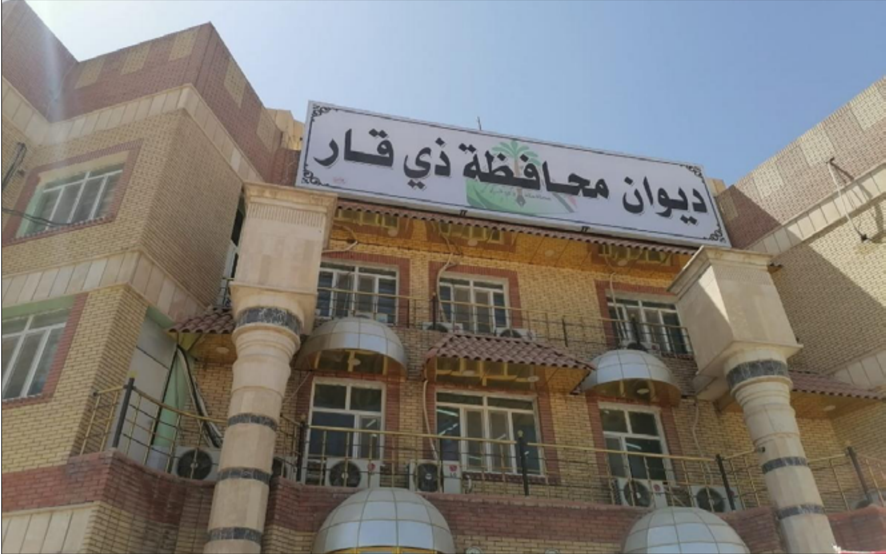
مبنى ديوان محافظة ذي قار

فيما تحدث شهود عيان عن مصادمات وتراشق بالحجارة بين المتظاهرين وقوات مكافحة الشغب، مشيرين الى اقدام أحد المتظاهرين على رمي نفسه في نهر الفرات القريب من المبنى إثر محاصرة الشرطة له، فيما تحدث شهود آخرين عن عدد من الإصابات بين المتظاهرين وعناصر الشرطة. وقال أحد المتظاهرين في حديث مع (المدى)، إن "مئات المتظاهرين جدوا