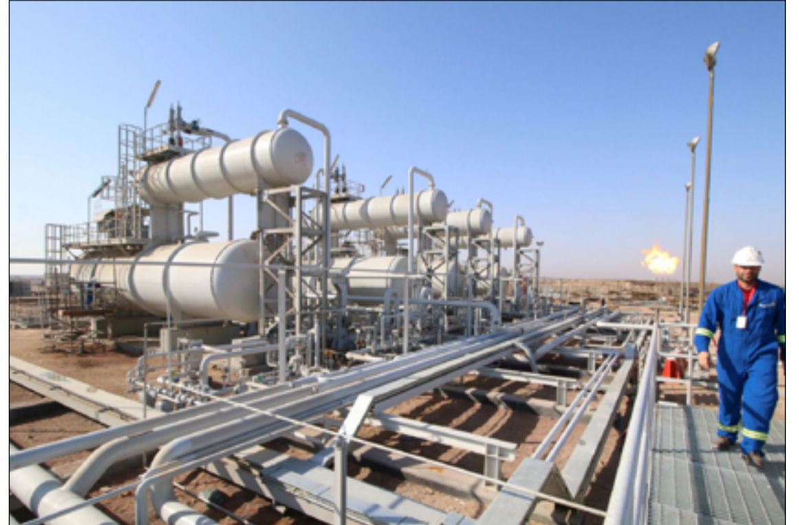
تشريع قانون النفط والغاز يساعد بحل الكثير من المشاكل بين بغداد اربيل