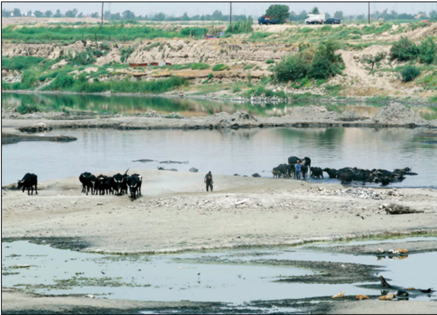
الجفاف في نهر ديال يفتك بجواميس القصبيلية في بغداد...

وتزداد هجمات الجمهوريين على حالة جو بايدن الذهنية. ويميل بايدن إلى ارتكاب هفوات، وتبدو عليه علامات التقدم بالسن واضحة.