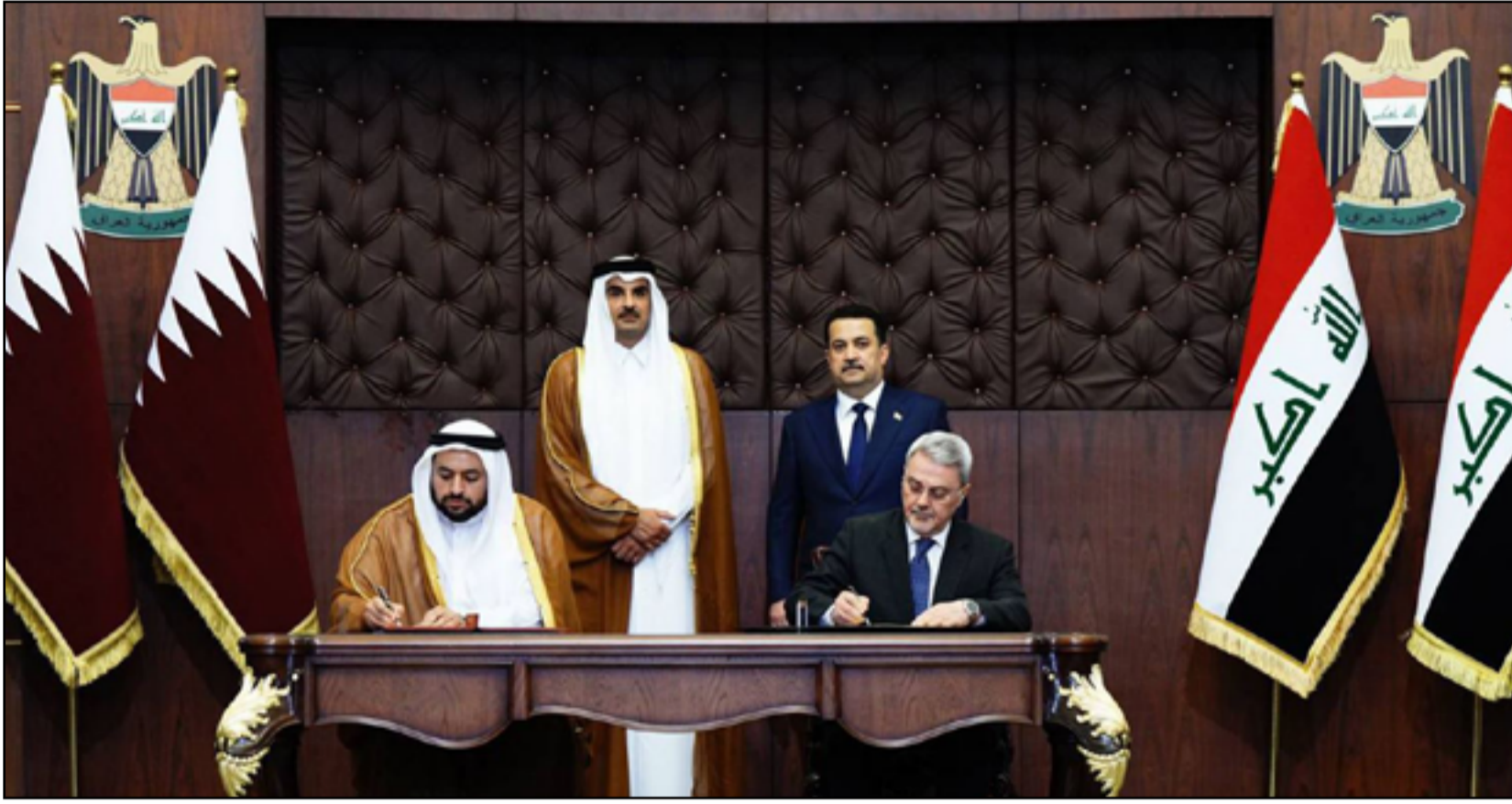
العراق يبحث عن بدائل للغاز الإيراني .. توقيع اتفاقيات مع قطر

استثمار الغاز في العراق، وابداء بديل بالمقابل للغاز الإيراني بالاعتماد على قطر التي زار أميرها تميم بن حمد بغداد قبل ايام في زيارة ربما هي الاسرع لزعيم عربي الى العراق والتي استمرت لـ3 ساعات فقط.