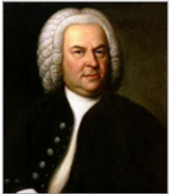
يوهان سيباستيان باخ