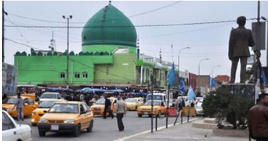
ادارة كركوك تتحدث عن تقدم في الملف الامني والعمراني للمحافظة

سجلت اقبالا كبيرا من قبل السائحين الأجانب على زيارة القلعة الأثرية في المحافظة". وأفاد، بيان "المحافظة تنفذ خطة للتوسعة العمرانية في المناطق القديمة لفك الاختناقات المرورية"، مبيّنًا أنّ "الحملة شملت فتح مسار جديد بممرين يمتد من منطقة الحرية ومرورا بمنطقة بنجا علي وصولا إلى الطريق الحولي وبمسافة ٢ كم، فضلا عن المباشرة بإكمال طريق البارود خاتمة ذو الممرين ونوه الجبوري، إلى أنّ "المحافظة