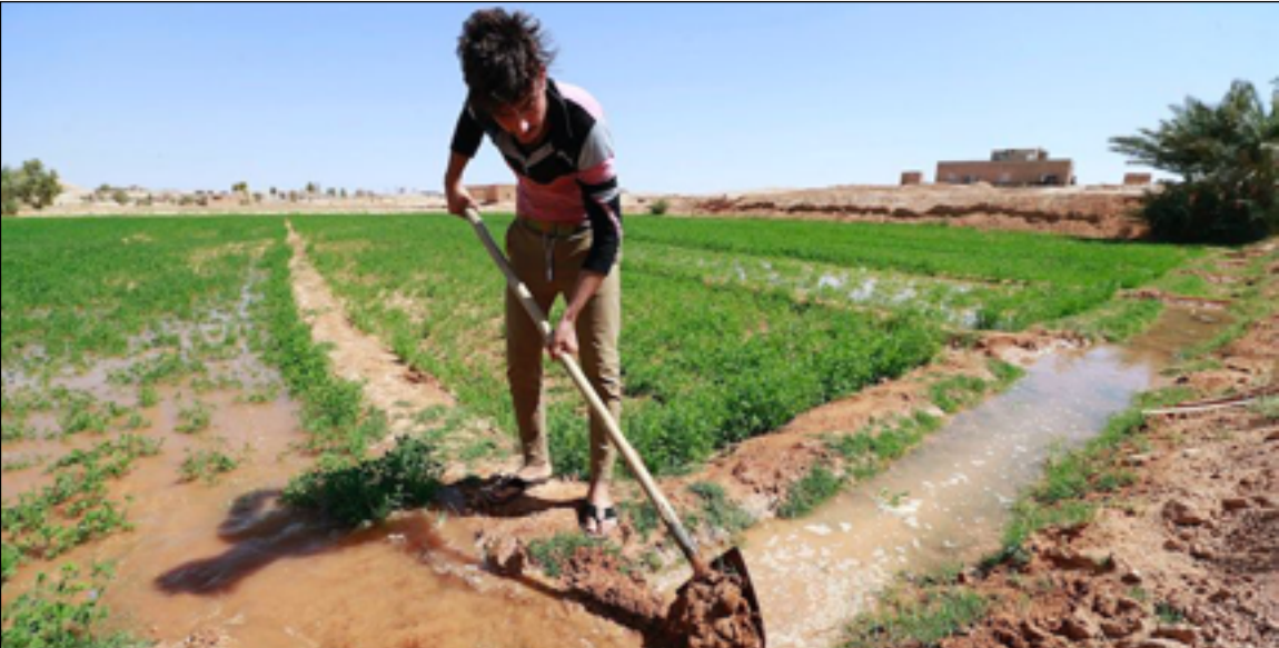
الوسائل التقليدية في ري المزارع تسهم في استنزاف المياه

المتزايدة من تلك المادة في ظل عملية الاعمار المتنامية في البلد والمنطقة الجنوبية والبصرة على وجه خاص. واضاف ان المشروع سينفذ وفقاً لقانون الاستثمار المرقم ١٣ لسنة ٢٠٠٦ المعدل، وعازمين على ان يكون نموذجاً لسائر المشاريع في استخدام التقنيات الحديثة والكوادر الفنية الكفوءة.