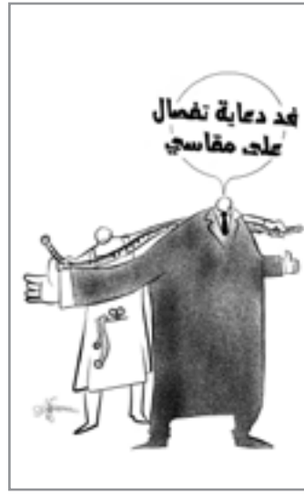
من أعمال المالكي