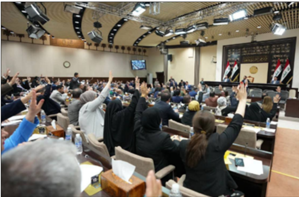
جلسة البرلمان للتصويت على الموازنة الأسبوع الماضي

وتابع، أن "هنالك أكثر من ٥٠٠ وحدة إنفاق وبعد مصادقة رئيس الجمهورية ستتم متابعة عملية تطبيق الموازنة من قبل اللجنة