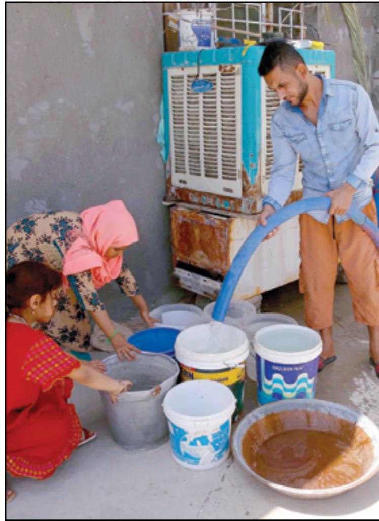
شح المياه يصعب العيش على المواطنين..

غادر ثلاثة من لاعبي المنتخب الوطني المعسكر المقام حاليا في اسبانيا، فيما يواصل الفريق تحضيراته لمواجهة أحد اندية جبل طارق غدا الثلاثاء. وكان المنتخب الوطني قد خاض مباراة في مدينة فالنسيا الاسبانية ضد نظيره الكولومبي يوم الجمعة، انتهت بخسارته بهدف نظيف. ونكر بيان لاتحاد الكرة، تلقته (المدى)، أن "المنتخب الوطني، عاود صباح أمس الأحد، إجراء تدريباته في مدينة خيريز الاسبانية، حيث احتضنت مراكز التدريب في مقر إقامة وفد المنتخب الوطني التدريبات الصباحية". وتابع البيان، أن "التدريبات شارك فيها جميع لاعبي المنتخب الوطني باستثناء كيفن يعقوب لمراجعته مركز الطب الرياضي في مقر الإقامة