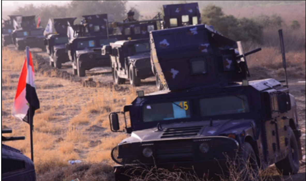
دورية للجيش العراقي في الطارمية

مراقبون يقولون إن طبيعة المنطقة الجغرافية تشكل تهديداً على العاصمة العمليات المشتركة: الطارمية مستقرة . . وعازمون على تأمينها بالكامل