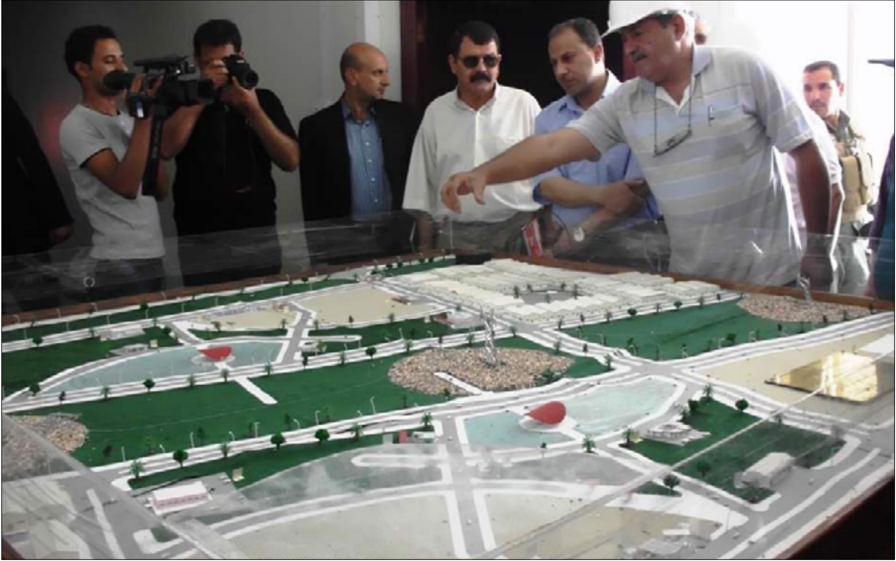
الرسوم المرسومة لمدينة ذي قار الصناعية