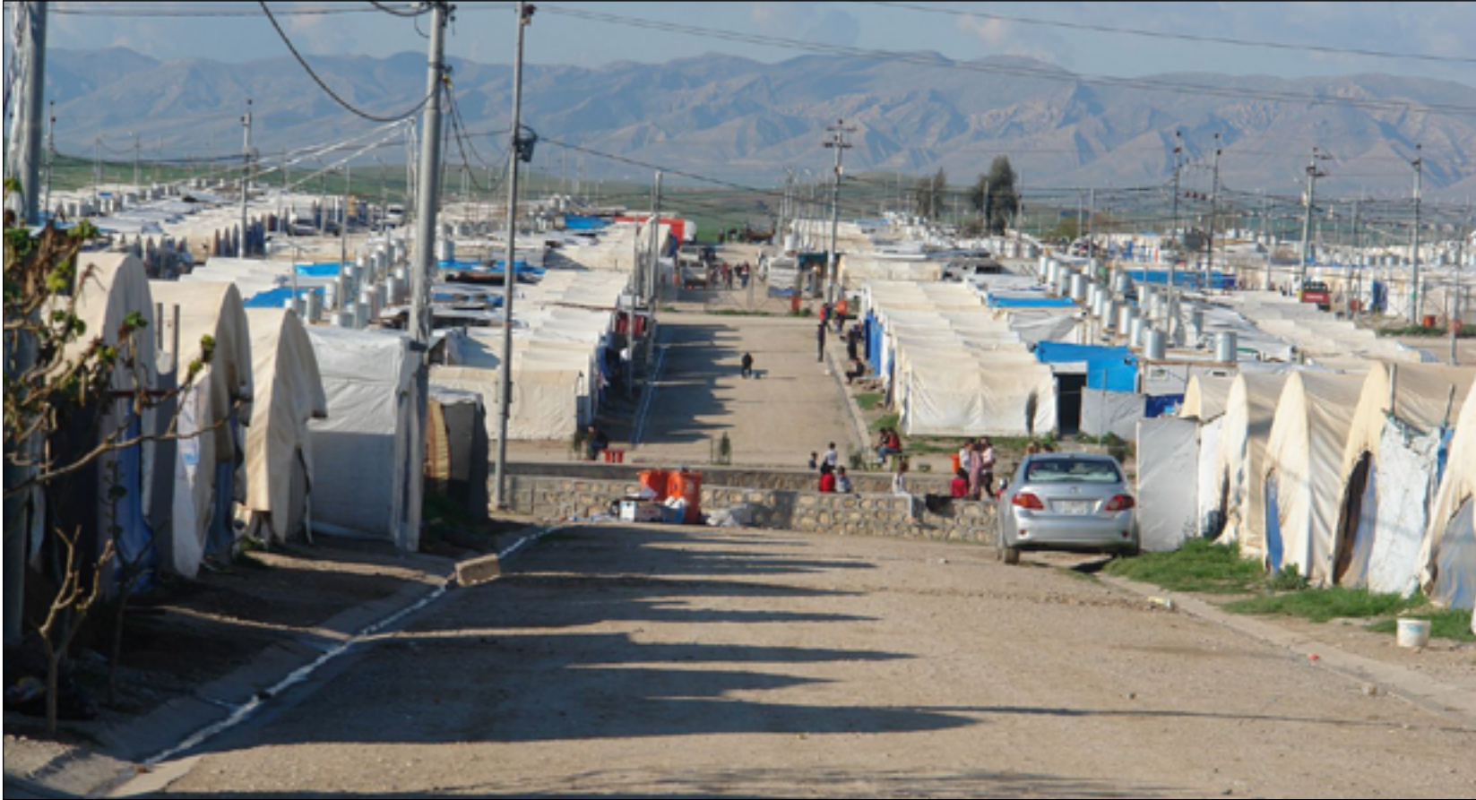
مخيم إيسيان للنازحين في إقليم كردستان

وتابع التقرير، "وخلال أيام قليلة فقط تم تجريف قرى بأكملها ونزوح أكثر من ٢٠٠ الف شخص أصبحوا مشردين بسبب العنف، وهي جريمة وصفها الأمم المتحدة فيما بعد على أنها جريمة إبادة جماعية". وبعد مرور تسع سنوات على ذلك الحدث ما يزال ١,٢ مليون شخص يعيشون حالة نزوح في المخيمات". وأشار التقرير، إلى أن "قسماً من النازحين لا يرى في خيار العودة مجالا وذلك لتعرض منازلهم للدمار والأضرار، ولم تبق سوى خدمات صحية واجتماعية محدودة فقط". وأكد، أن "كثيراً من الإيزيديين يعيشون في شبه مدينة واسعة لمخيم إيسيان للنازحين قرب دهوك في إقليم كردستان، حيث يجعل ١٣