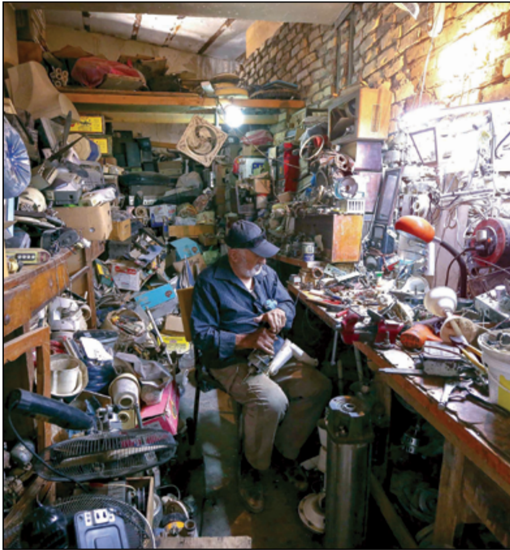
مصلح أجهزة كهربائية في سوق الميدان ببغداد...