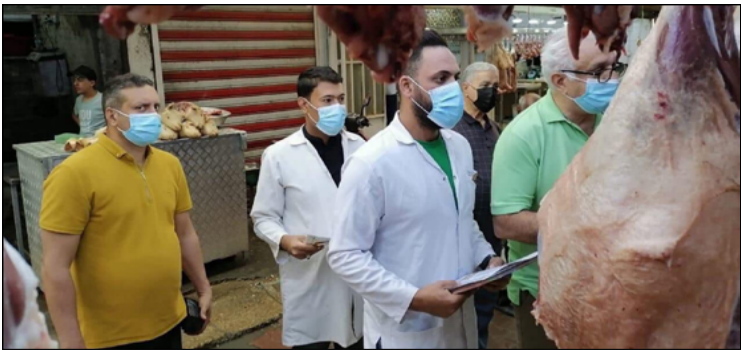
فرق طبية تتابع محلات القصابة